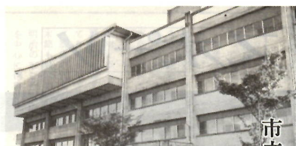
建設部専門の工業短期大学

入学案内・願書を希望するかたは、直接来校するか、または郵便で申し込んでください。郵送の場合は、百四十円の郵便切手を同封し、前橋市立工業短期大学（〒371