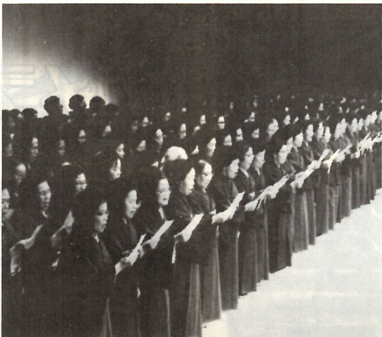
詩吟の発表 (昨年の市民芸術文化祭)

市教育委員会では、市民のかたがたの創作活動とその鑑賞などをすすめる、各分野ごとの合同発表の機会をつくるため、市民芸術文化祭を実施しています。十一月の発表会は次のとおりです。入場は無料です。