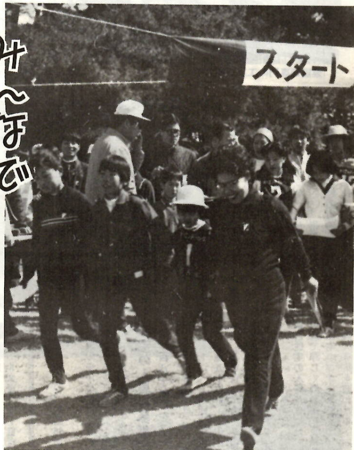
家族で楽しめるオリエンテーリング