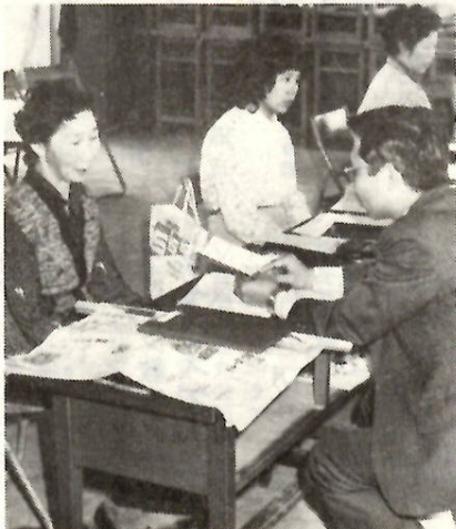
相談はお気軽に（芳賀公民館で）

国民年金についての相談に際するため、次の会場で、年金相談を行います。ご相談におかけのとき