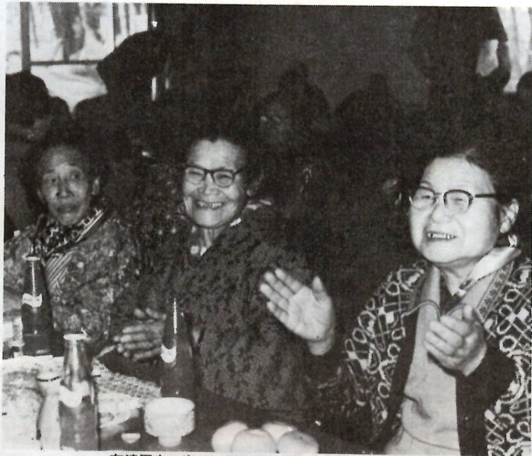
友達同志の楽しい語らい（老人福祉センターで）