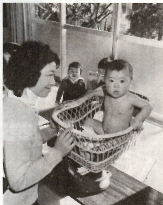
母子健康相談（若宮町二丁目公民館で）

3月3日(月) 〓 萩町公民館、朝日町三丁目公民館 芳賀公民館、南橘公民館。 3月5日(水) 〓 清里公民館。 3月6日(木) 〓 南町四丁目公民館、中石倉公民館。 3月10日(月) 〓 上川淵公民館、永明公民館、桂萱公民館。 3月14日(金) 〓 若宮町二丁目公民館。 当日、妊婦健康相談および家族計画相談も同時に行います。時間は午前十時から十一時三十分、午後一時から三時までです。ただし、南町四丁目・中石倉・上川淵公民館は午前のみ。萩町・朝日町三丁目・清里・若宮町二丁目公民館は午後のみ。午後のみ実施する会場については、午後一時三十分から三時までです。持参するものは、母子健康手帳、筆記用具です。 〓 前期(妊娠七か月まで) 3月4日(火) 〓 午後一時三十分から四時まで。 3月11日(火) 〓 午前十時三十分から午後二時三十分まで。 ・後期(妊娠八か月から十か月まで) 3月18日(火) 〓 午後一時三十分から四時まで。 3月25日(火) 〓 午前十時三十分から午後二時三十分まで。昼食を用意してください。 前・後期各二日ずつの計四日間で一コースが終了します。前期を受けた人は、妊娠八か月以後に後期を受けてください。対象は妊娠している人とその家族です。持参するものは、母子健康手帳、筆記用具です。 受講希望者は当日会場へお出かけください。 〓 母子健康相談 〓 前橋保健所の母親学級