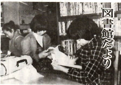
今日はこの本にしようかな