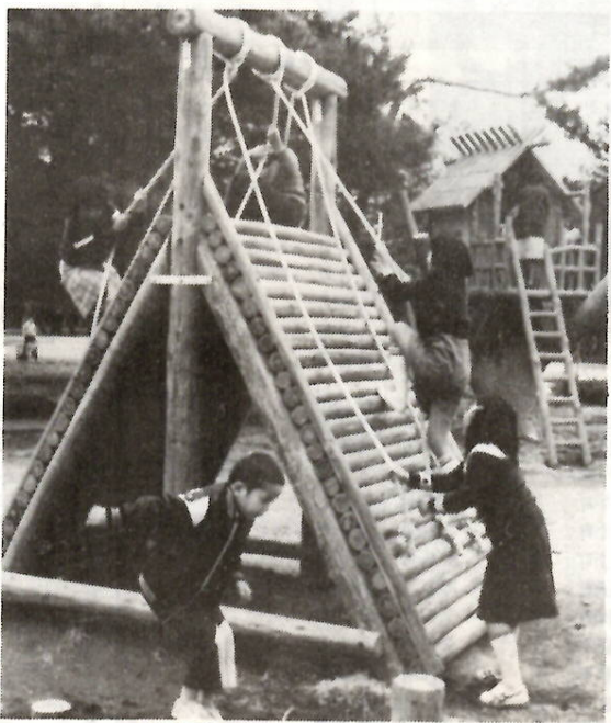
税金で子供たちの施設も……

所得税と市民税は、個人が昨年の一月一日から十二月三十一日までの一年間に得た所得に応じてかかる税金です。所得税の確定申告と市民税の申告期限は、三月十五日までです。期限間近になると大変混雑しますから、できるだけ早めに申告を済ませてください。