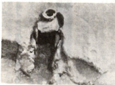
芳賀東部団地遺跡で発見されたかまど

ここは芳賀東部団地遺跡。すでに縄文時代には人が生活していた。奈良、平安時代も生活の舞台であったことは、数多くの住居跡が語るようにである。住居跡を発掘すると、火を使用していた場所は朱色に染まっていた。そこには何とも言いえない人間くささ、ぬくもりが漂っている。火が暖となり、明りとなり、食生活を支え、まさに生活の中心であったからだろう。火は住居内の生活空間と分化する一要素である。芳賀における奈良、平安時代の住居跡は各部屋の仕切りこそないが、寝るところ、物を煮炊きするところなど、住居内の生活空間の分化があったようである。とくに物を煮炊きするところは「かまど」によってうかがい知ることができる。かまど付近