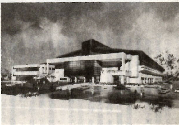
市民体育館の完成予想図

五十六年三月の完成をめざし、上佐馬町の市立工業短期大学西隣りに建設する市民体育館の起工式が、一月二十九日に行われました。