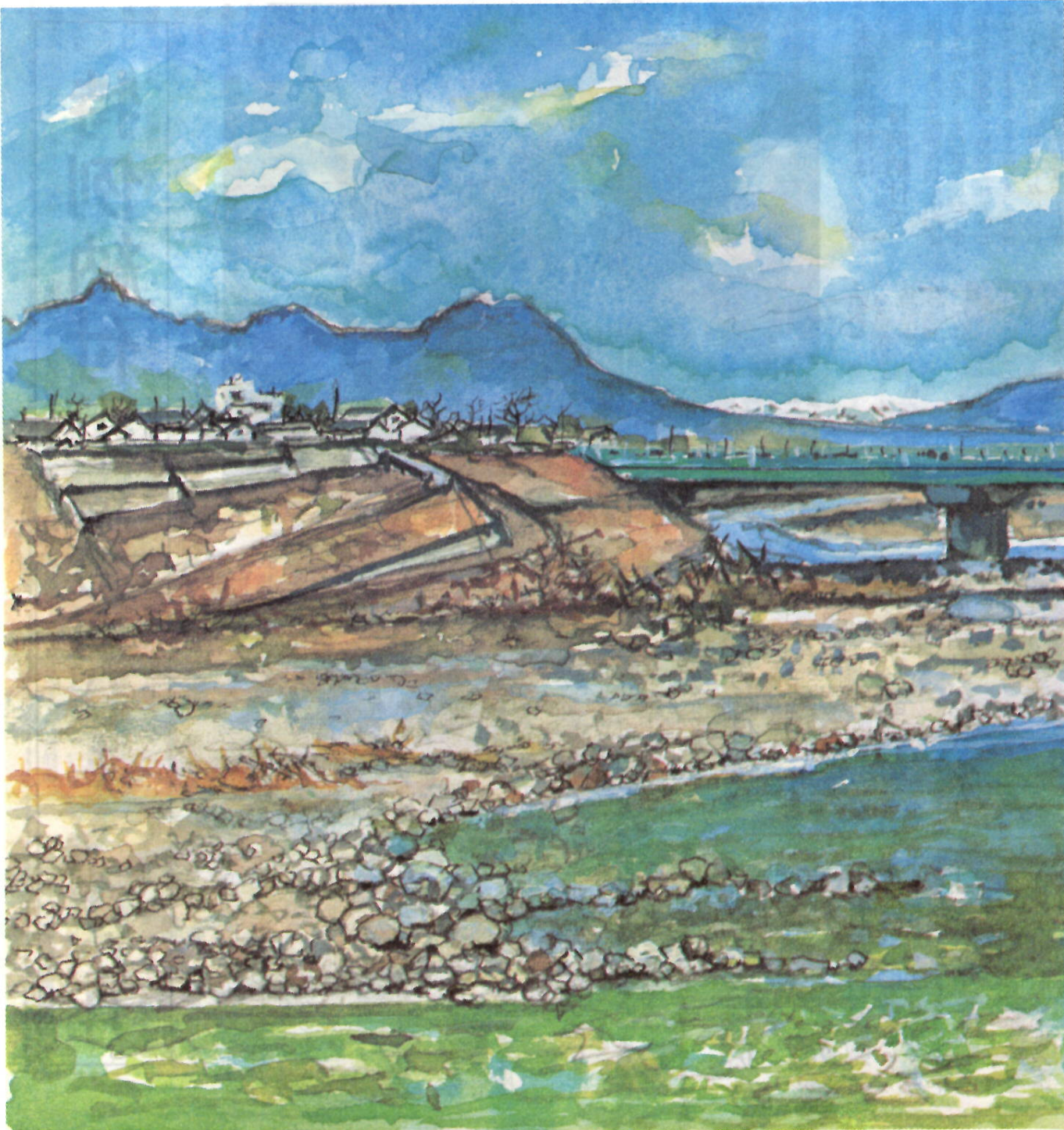
—— 絵・田中恒（恒夫）・二紀会同人 ——