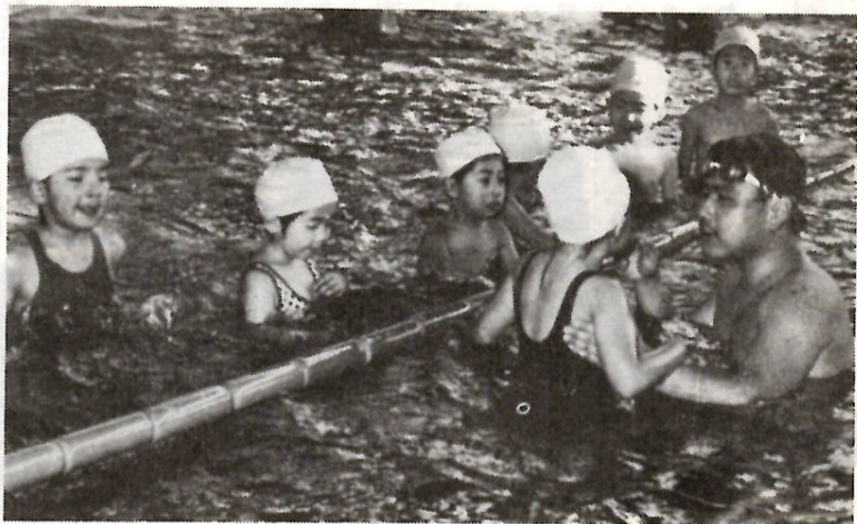
早く泳げるようになりたいな