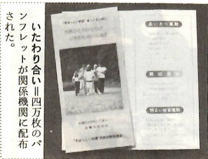
いたわり合いⅡ四万枚のパンフレットが関係機関に配布された。