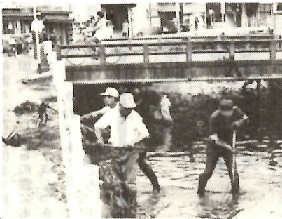
川をきれいに地区住民の人たちによる川の清掃も盛んに行われています。