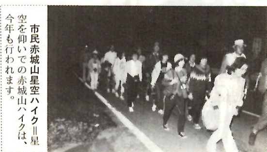
市民赤城山星空ハイキングは、空を仰いでの赤城山ハイキングは、今年も行われます。

運動 いろいろな大会や講習会に積極的に参加します。 □高齢者、身体障害者のためのスポーツの推進 □各種講習会、身体障害者体育大会などを開催します。