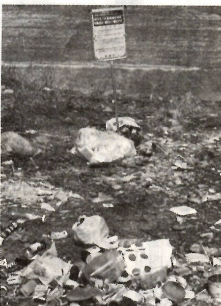
収集日前日の集積所はこんなに汚れていた (2月22日午前11時ごろ・旧市域北部で)

④事業所から出るごみなど 会社、工場、商店、飲食店などから出るごみ、増・改築、庭木のせんていなど、業者請負によって出るごみは、事業者の責任で処理しなければなりません。集積指定場所、コンテナには出せません。自己処理できない場合は、廃棄物処理業者等に依頼するなどして、適正な処理をしてください。