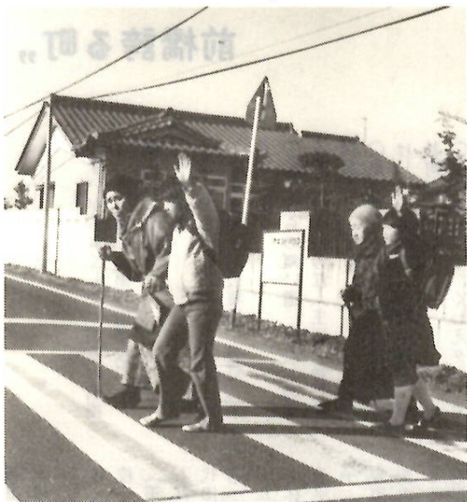
お年寄りをいたわる小学生——（永明小学校付近で）