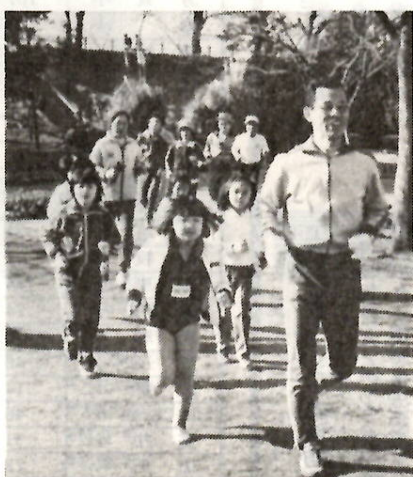
金バッジをめざしジョギング（前橋公園で）

「すばらしい前橋」市民活動協議会スポーツ部会では、市民のみなさんの健康生活上と体力づくりのため、「県内めぐりテクテク・ジョギングカード」をさしあげています。