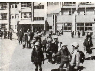
243人の新入学児童を迎える大根小学校

今年の一年生は四千五百十人 現在市内には、市立小学校が三十六校、中学校十五校、養護学校一校があります。児童生徒数は昭和五十四年十二月一日現在で、小