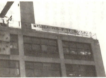
ノー・マイカー運動Ⅱ「毎月ついたち」はノー・マイカーデーです。