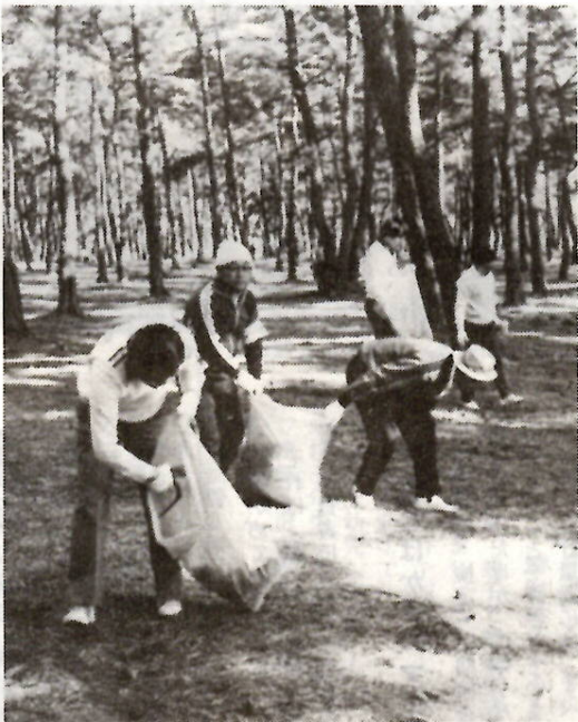
松林にきれいな朝が……（クリーン前橋奉仕隊の清掃）

明るく住みよい私たちのまちを創造し、三年後前橋を中心に開かれる「あかぎ国体」の成功をめざす「すばらしい前橋」市民活動協議会が活動の二年目を迎えました。今年度は、市民と行政が一体となつてつくりあげてきた初年度活動の土台をもとに、活動の輪をさらに大きく広げようとしています。 さあ、ご近所のみなさんと誘い合つて、まずやりやすいところから、地域に合った方法で活動を始めよう。二十六万市民による「すばらしい前橋」づくり大行進にご参加ください。