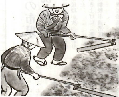
麦打ち唄は追力に満ち、力強い曲想を持っている。

照りつける太陽の下、体に突きささる「ノゲ」の痛みと、汗とほこりにまみれた重労働の作業の中で、この歌は歌われるのである。