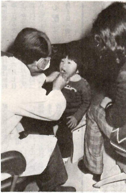
虫歯はないかな？(前橋保健所で)

6月27日(金) 市母子健康センターで乳児を対象に行います。なお、家族計画相談も同時に行います。受付時間は午前十時から午後三時までです。