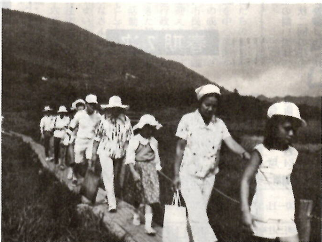
清らかな大自然の中を歩く (赤城山麓満洲)

赤城少年自然の家では、親子の心の触れ合いを深め、多くの人と交流を図っていただくため、「親子ハイキングの会」を開きます。