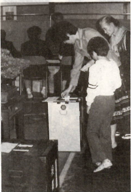
貴重な一票を大切に

先の市町村で住所期間が三か月に満たないため、選挙人名簿に登録されない人は、投票日に本市の従前の投票所へ来て投票するか、不在者投票所で投票することができます。 ただし、県知事選挙については、転入先の市町村長から、住所を有する旨の証明書か住民票の写しを交付を受け、投票のとき提示しないと投票することはできません。なお、県外転出者は知事選挙の投票はできません。