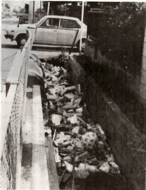
これは困ったもの——側溝につまった空きかん、紙くず

から七時まで 場所：前橋—古河線（天川松並木から駒形バイパス終点まで） 参加者：道路沿線自治会、婦人会、青年会、老人会など約三百人 なお、このほかにも、工場や事業所の騒音調査など、環境をよくする行事を計画しています。