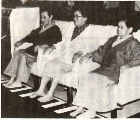
ご好評にこたえて増設されたヘルストロン

人体に高電圧(一万五千ボルト)を通じ、酸性の血液を正常な弱いアルカリ性にもどし、健康の維持増進をはかるもので、血液の流れを円滑にし、自律神経系を刺激して、神経機能の異常を正し新陳代謝を活性化させる効果があります。したがってお年寄りに多い肩こり、