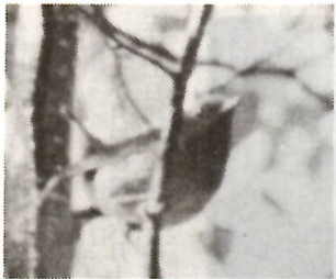
コマドリ(ヒタキ科)

ウグイス・オオルリと共に日本三名鳥の一つに数えられるコマドリは、声のすばらしさはもちろんですが、その姿勢が美しく決まっています。