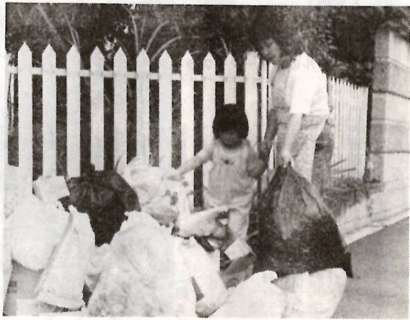
よく整理して集積所に出されたごみ

ごみ・キケン物は、分別して、定められた収集日の朝八時までに出すことになっています。