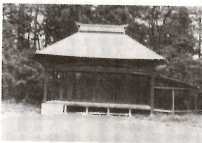
二之宮赤城神社境内にある舞台

赤城山麓一帯は、かつて百数十もの農村歌舞伎舞台があり、地芝居と呼ぶ農村歌舞伎の隆盛地だった。その最盛期は、幕末明治期で今日ではほとんど廃絶している。市内の旧勢多郡地域にも二十の舞台があった。現在も、二之宮町や上泉町では立派な舞台が残る。