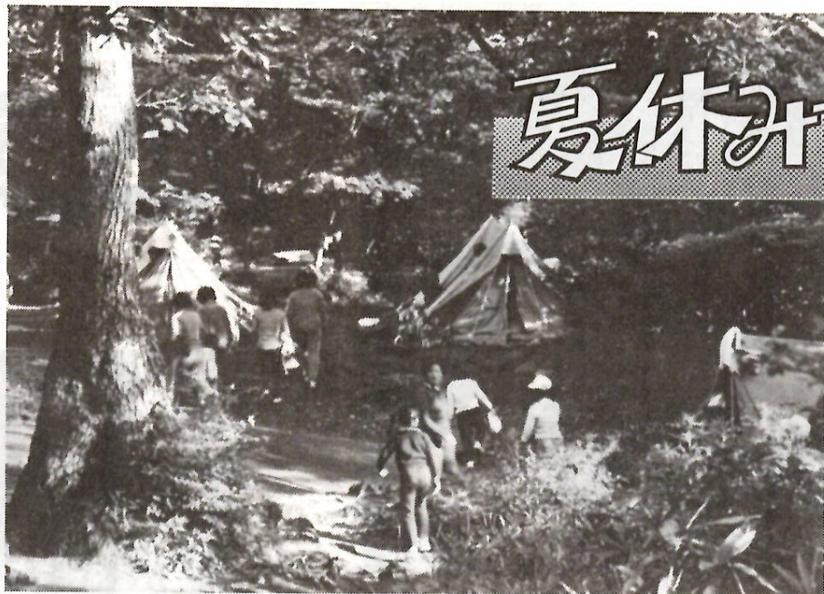
キャンプにも経験に富んだ指導者が必要（赤城少年自然の家キャンプ場）

もうすぐ夏休み——。市立の幼稚園・小学校・中学校は七月二十一日（月）から八月二十七日（水）までの三十八日間、夏休みになります。夏休みは、子供たちに心身の休養を与えるとともに、長期間の休みでなければいけない、いろいろな生活体験や学習を身につけられる大切な時期です。しかし、学校での直接的な指導や、規則正しい時間の過ごし方から離れるので、余暇の気分が強くなり、つい不規則な生活になりがちです。長い夏休みを楽しく有意義なものにするためには「規則正しい生活」「計画性のある生活」「安全な生活」をすることが大切です。今から心の準備を始めてください。