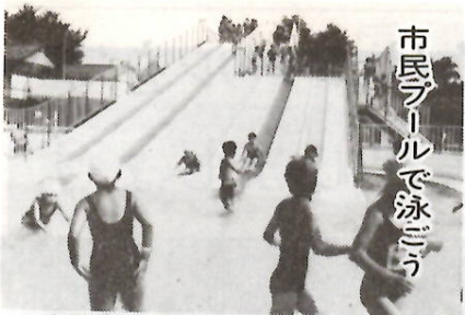
市民プールのウォーターライダー

真夏のレジャーを市民プールで お過ごしください。 所在地 岩神町一丁目一〇一（県スポ ーツセンター西） 開場時間 午前10時～午後6時 （6月29日～7月20日） （8月21日～8月31日） 午前10時～午後7時 （7月21日～8月20日） 利用料金 今年から一日制になりました 大人 100円