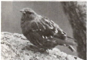
イワヒバリ (イワヒバリ科)

夏の間は、尾瀬、谷川などの高山の岩場に住み、冬になると低山の岩場やけ地のある場所に下ってくる渡鳥です。