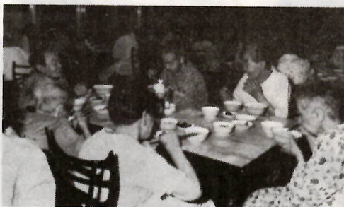
そろって食べるのも楽しみのひとつ

「毎日心配ごともなく、苦しいこともない。ひとに頼まれたりして買物に行くのが楽しみ」(七十五歳のおばあちゃん)。「働かないでも、おいしいごはんをいただけるのだから、それや今が一番しあわせ。むかしは苦勞のしどおしだったから……」(七十八歳の男)。