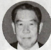
前橋市長 藤井 精一