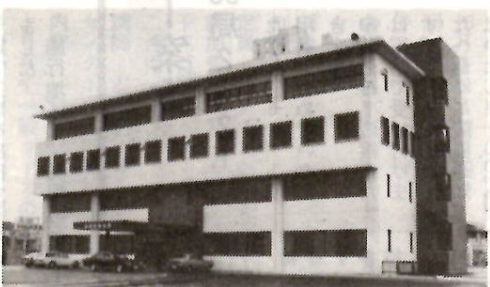
親しまれ愛される警察がモットー(新設の前橋東署)

道路と宅地との段差をなくす工事をする場合は、市の許可を受けてから、緑の切り下げ工事を施行することになりますが、費用は本人負担です。施行業者などについては道路維持課(24局一内線五二四・五五五)へお問い合わせください。