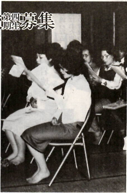
だれでも知っている歌をみんなで