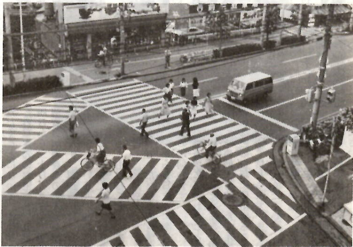
みんなで交通ルールを守り事故のない町づくりを

九月二十一日(日)から三十日(火)までの十日間、秋の全国交通安全運動が実施されます。今回の重点目標は、①安全運転の確保、特に無謀運転の防止、②歩行者、特に老人と子供の交通事故防止、③自動車および原動機付自転車の安全利用の促進、④道路交通環境の点検整備の推進の四つです。みんなで交通ルールをよく守り、事故のない明るい町づくりを進めましょう。