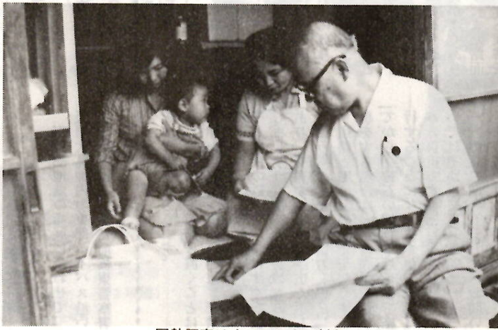
国勢調査はすべての人が対象

十月一日、全国いっせいに国勢調査が行われます。国勢調査は、みなさんの暮らしている住みよい町づくりのための、いろいろな施策を進めていく上で、欠くことのできない基礎資料を得るための調査です。この調査では、全国の一億一千五百万人を超えるすべての人たちに、もれなく申告していただくことになっています。 みなさんのお宅へは、九月二十四日から三十日までの間に、調査員が調査票の記入をお願いにきます。調査票には、お宅にふだん住んでいる人、長期に滞在している人や生まれたばかりの赤ちゃんも、もれなく記入してください。