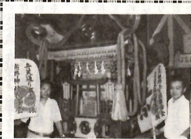
かつぎ手を待つ大人みこし

最近、自動販売機などによる有害雑誌の増加は、目にあまるものがあります。現在、前橋市内には有害雑誌の自動販売機が約三十三か所、五十一台が設置されています。これは八月現在の調べによる設置台数ですが、このままの状態では、なかなか減少は望めない状況です。 【買わない」「見せない」 八月十九日開かれた「前橋市青少年問題協議会」でもこの問題が協議され、この協議会に關係する