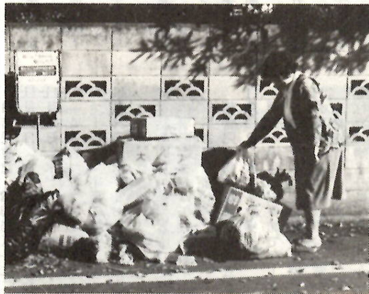
ごみは必ず収集日の朝8時までに