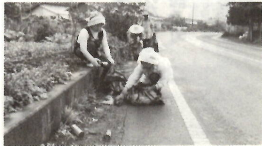
一日に車3台ものあきかんが（下大屋町で）

保健衛生地区組織連合会では、市民活動協議会「美しく清潔なまちをつくる部会」の中心となつて市内の各所で広域清掃活動をくりひろげています。これはクリーン前橋をめざす運動の輪をひろげ、毎月第一日曜日が「市民清掃の日」であることの徹底を図るための活動です。 十月十九日の日曜日は、朝九時ごろから下大屋町、荒子町で、今井一前橋、伊勢崎一太胡線を中心に、道路際のあきかん拾いが行われました。自動販売機の近くは特にあきかんの投げ捨てが目だつていました。田んぼの中に捨てられると、農作業にとても手間がかかってしまうので、困り果てた表情で話してくれた人もいます。 ここ一、二年かなり増えてきているということで、三十分もたないうちに大きなビニール袋はたちまちいっぱいになってしまふほど。この日はなんと車に三台分のあきかんが集められました。 この活動は、今後も芳賀地区、永明地区、桂壺地区でも行われることになっています。