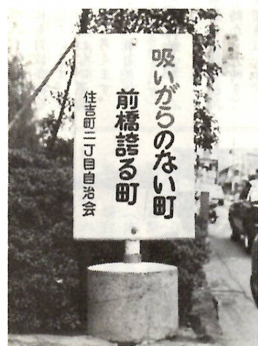
「ノーボイ運動」に役

よこれがひどいことから、設置さ れたものです。 通行する人には、直接訴え、ま た地区の住民には、自分たちの町 をきれいにしようと呼びかけ、こ の看板は、美しく清潔なまちづく りに一役買っているようです。 ほかでも、同じような計画があ るということです。