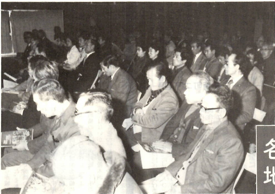
「すばらしい前橋」市民活動協議会の地区懇談会（桂壺小体育館）

市民活動協議会や「あかぎ国体」について、地区ごとに広く市民のみなさんに理解をしていただくとともに、市政への意見、要望などをうかがうため、各地で地区懇談会が開かれています。 今年二月六日の城南地区を皮切りに、すでに二十地区中十四地区で行われ、活動の輪はいつそのの広がりをみせています。 懇談会に出席するのは、各地区内の指導員と推進員、市民活動協議会会長以下役員・部会長、そして市側から市長はじめ助役以下関係部課長、市議会から地元関係議員。時間はほとんど夜間です。 ここでは、すでに開かれた懇談