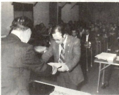
感謝を込めて 交通指導員表彰式

交通指導員の表彰式が十月十七日、前橋福祉センターで行われ、六年（三期）勤められた十四人のかたに市長から表彰状、今年九月三十日をもって退任された十三人のかたには、前橋警察署長、大胡警察署長から感謝状がそれぞれ贈られました。 席上、市長は「今年は交通事故による死亡者が多いが、このところ五十八日間、前橋署管内で死亡事故が発生していない。これも指導員の平素の努力が実を結んだものと深く感謝しています。市民ら事故の激減には大きな期待を寄せているわけです。まづるみで交通事故をなくし、明るい前橋のために一丸となって活躍してください」とあいさつしました。