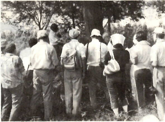
郷土の文化財に親しむ人は年々増えています

祖先の残した貴重な文化遺産をたずね、文化財保護と文化財の正しい理解をはかるため、恒例の文化財めぐりを行います。