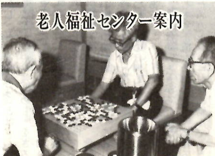
老人福祉センター案内

ねたきり老人の家庭へ家庭奉仕員を派遣 対象 ① 老衰、心身の障害、傷病等により、日常生活に支障をきたしている老人世帯 ② 重度の身体障害のため、日常生活に著しく支障がある身体障害者の属する低所得の世帯 奉仕内容 ① 家事、介護に関すること ② 相談、助言に関すること 派遣回数 一世帯あたり、おおむね週二回 申し込み 福祉事務所(24局一一一内線五四二)へ。