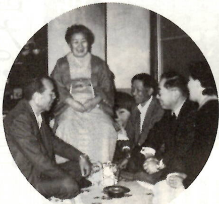
足の不自由な一人暮らしの お年寄りを友愛訪問

いま、都市計画で、墓地の移 転のことが問題になっています が、市街地の墓地は前向きに考 えてもらって、有効な、いわゆ る都市再開発をしてほしいです。 心の面では、前橋の人みんな が、もともと地域意識をも った住民になってもらいたい と思います。 最後に市の行政に期待され ることを願っています。 市長も議会もよくやってくれ てますんで……。まあ、行政で たいせつなのは、予算のムダ使 いをしないこと。もちろんサー ビス低下は困りますが、人件費 はたいへんな額なんです。から 最少の経費で最大の効果を上げ てほしいということです。 それから、地区懇談会でみな さんがいように、まず地域を よくし、そして全体をよくしてい く。犯罪のない、非行のない、 交通事故のない、活気にあふれ た住みよいまちにしたいです。 いものです。文化面について私 はよくわかりませんが、心の ゆとりはたいへん必要だと だと思えます。