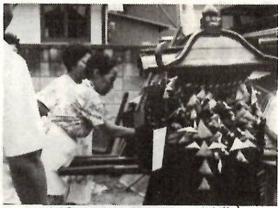
復活した江田町のかつぎ地蔵

「おはようございます」、元気な声があらちから聞こえ、主役である子供たちの集合だ。中学一年生の二人が親方と称し、厨子を担ぐ。二、三人が各家庭