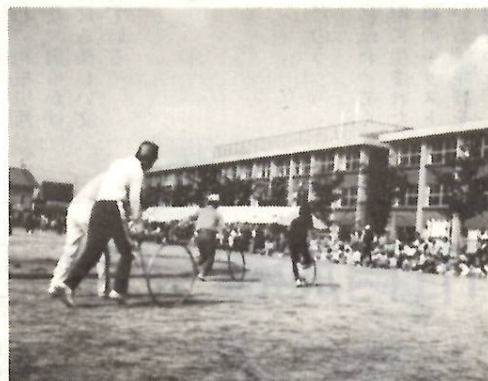
西片貝町の町民運動会

きょうの行事は「親子オリエンテリング」。子供広場に参加者が続々と集まってきました。親子組もあれば、友達組もいます。百五十組、三百人ぐらいです。顔見知りも多いから、なかなかふんい気です。コースは、もともと自分たちの町を知ろうと、町内めぐり、四〇〇、いよいよ出発――。