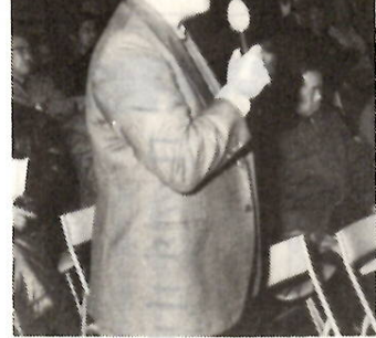
身近な問題をとらえて

●あき地を運動場に 発言者 町内に雑草の茂った空地があるが、ゲートボールに最適な場所と思われないか。 生活環境部長 空いている所を市にお貸しいただいて町内でゲートボールや子供さんのキヤッチボール等にご利用いただく方法があります。土