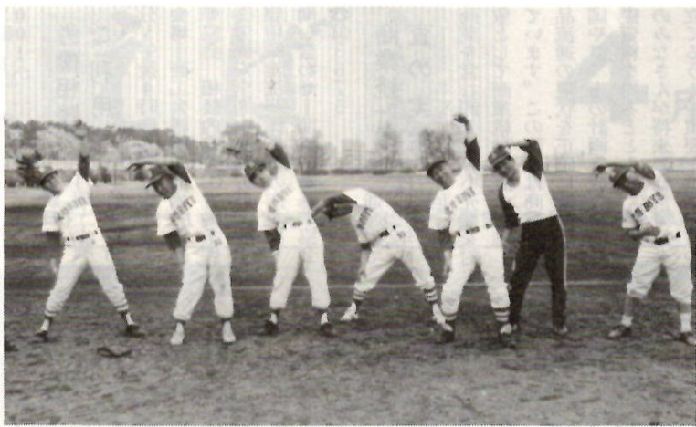
還暦野球のナイン 利根川河川緑地グラウンドで