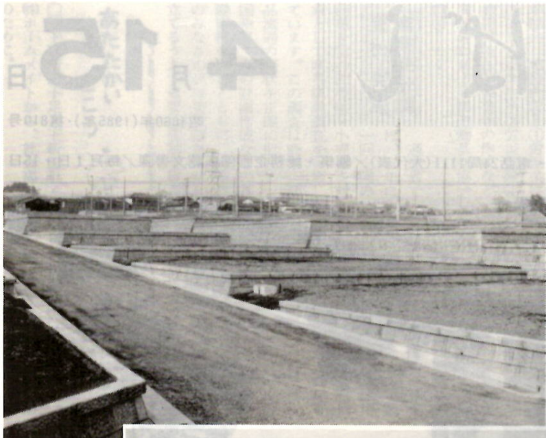
▲傾斜を生かし立派に造成された分譲地 ▲近くにある芳賀北部住宅団地の家並