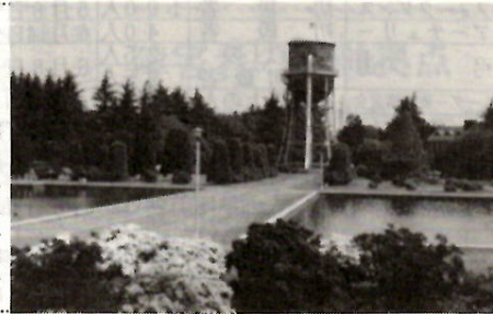
ツツジに映える敷島浄水場

●園管理課 ☎内線3942へ ●クリーンジャパン 4月28日(日)午前7時30分～8時30分、敷島公園はら園入口集合(詳細は別掲) ●敷島浄水場の開放 5月3日(金)～5日(日)、午前9時～午後4時。水道タンクで親しまれている同所を一般に開放。新緑と色とりどりの久留米ツツジをお楽しみください。車両の乗り入れ、犬の連れ込み、飲食などはできません。お問い合わせは水道局総務課 ☎5511 ●山野草展 4月28日(日)・29日(月)、午前9時～午後5時、敷島公園はら園