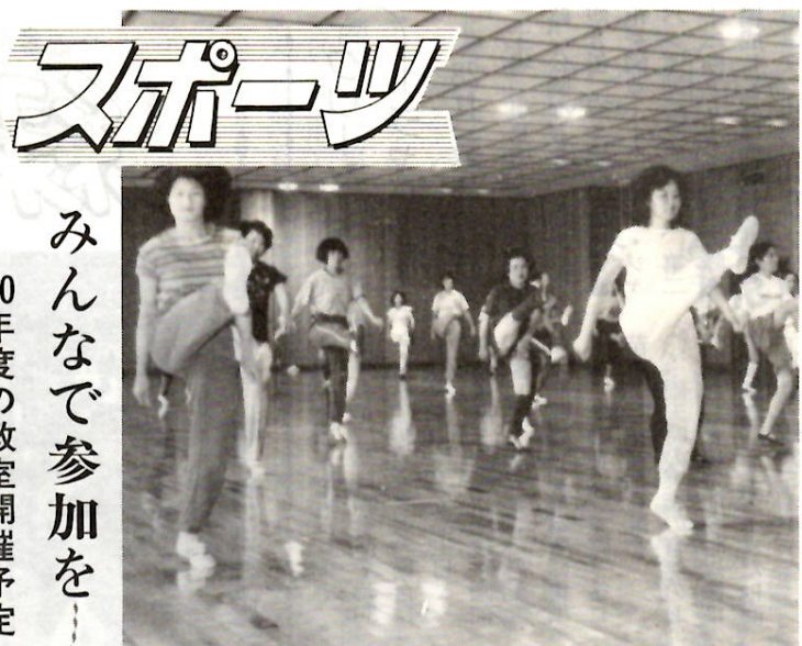
快適なリズムに乗って楽しいシェイプアップ