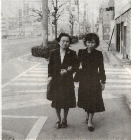
いたわりと信頼の心を結ぶガイドヘルパー

全身性障害者で、身体障害者手 帳一級の所持者③障害者の属す る世帯が原則として所得税非課 税世帯であること 付き添い内 容 ①公的機関、医療機関、学校、 冠婚葬祭、原則として月一回の 衣料品等の購入 申し込み 厚 生課 内線3240へ