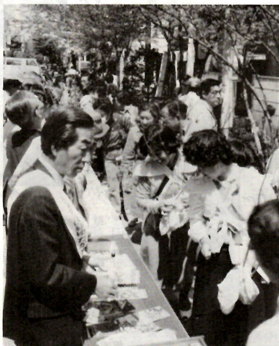
毎年大にぎわいを見せる苗木の無償配布

●苗木の配布と緑の羽根募金 ①4月18日(木)午前10時、第一勧銀馬場川遊歩道と諏訪橋際 ②5月4日(土)午前10時、前記馬場川遊歩道。苗木それぞれ二千五百本、千五百本の無償配布と緑の羽根募金。 ●市民植木市 4月27日(土)・28日(日)、午前9時～午後5時、敷島公園はら園で。苗木の廉価販売、緑化相談。 ●緑と花の講習会「植木の育て方」 4月28日(日)午前10時～正午、敷島公園はら園。定員五十人。ハガキで公園管理課へ申し込む。 ●カンナの球根の配布 花のあるまちづくりを推進するため、学校、自治会、企業などの団体に配布。希望団体は4月15日(月)～20日(土)に、電話で公園管理課 ☎3942へ。