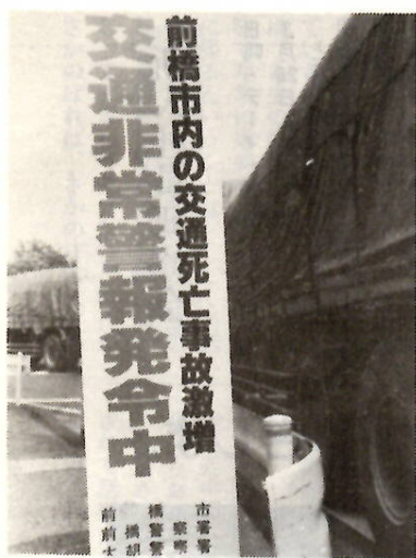
初の交通非常警報 交通死亡事故が急増したことから、8月に発令。交通事故防止のための運動が展開されました。

完成間近い新市庁舎 新庁舎建設工事は、いよいよ最後の段階。鉄筋地下二階、地上十二階、高さ六十・三層の高層市庁舎が、県都前橋にふさわしい、新しいシンボルとして登場するのは間近です。