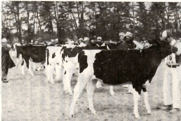
県代表を選ぶ第1次予選会(県畜産試験場)

●全国の精鋭300頭が集合 全国から選ばれた乳牛300頭が優劣を決める——第7回全日本ホルスタイン共進会が本市で開かれます。これは、5年ごとに行われる全国的な大行事です。市民のみなさんのご理解とご協力をお願いします。 ●30万人の参観者 開催期間中、予想される参観者は、延べ30万人。全国各地からはもちろんのこと、アメリカ・カナダ・オーストラリア・韓国など、