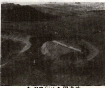
なぞを秘めた周溝墓

人間の一生の間には幾つかの節目があり、それに伴うさまざまな行事(通過儀礼)が執り行われてきている。誕生と相まって、「死」は、人生の終焉(えん)という意味で非常に重要である。死ねば墓に葬るといふことは、しごく当然のことと考えられているが、その方法(葬法)は必ずしも明らかになっていない。時代がさかのぼれば、さかのぼるほど