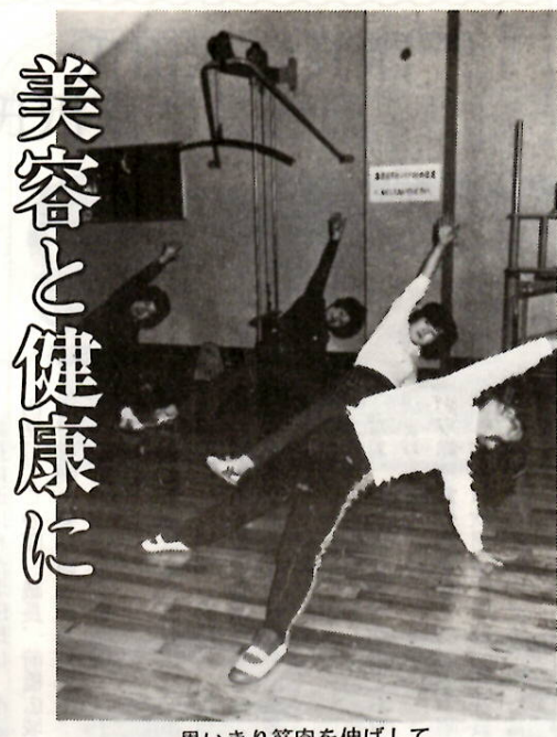
思いきり筋肉を伸ばして