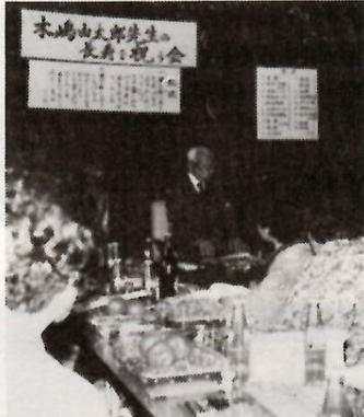
“しきしま”にふさわしい祝賀会

老人福祉センターでは、お年寄りの皆さんの趣味を広げ、健康増進を図っていただくため、各種クラブ活動の会員を募集します。 時間Ⅱいずれも午前10時30分〜午後2時30分 定員Ⅱ各クラブとも二十人 参加費Ⅱ無料(材料費は各自負担)ただし、センター使用料は納めていただきます。 申し込みⅡ3月20日(金)から、直接または電話(☎33局二二二)で受け付けます。申し込みされた人へ、個々に開催通知はしませんので、忘れずに実施日にお集まりください。