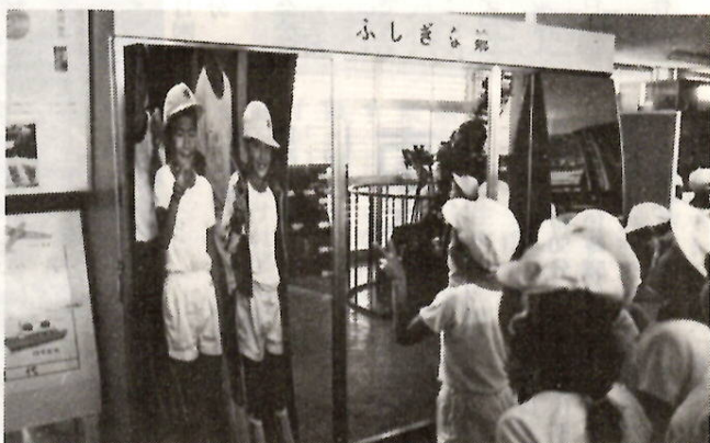
わあ、こんなにノッポになった