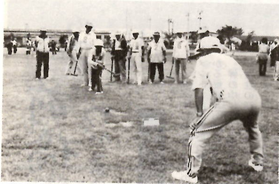
日ごろのトレーニングの成果を発揮して

「若い」を感じさせないこの元気なお年寄りたち、その「健康」をみごとこの大会で示し合いました。