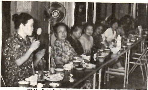
誕生会に招かれて楽しいひととき

この会では、自分たちの手で、をモットーに、会場づくりやもてなしのための料理など、すべて手づくりです。「少しでも、気持ちのこもったおもてなしをしたい」と思っています。この日、卓に並んだお赤飯は、老人会の人たちが朝六時から公民館の庭で炊きあげたものです。