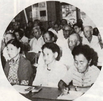
身近なテーマ 熱のこもる学習会

市内二十か所所公民館の主催事業「高齢者教室」が開設されています。ここ「上川淵高齢者教室」も、約百三十人のお年寄りが、学習に参加しています。