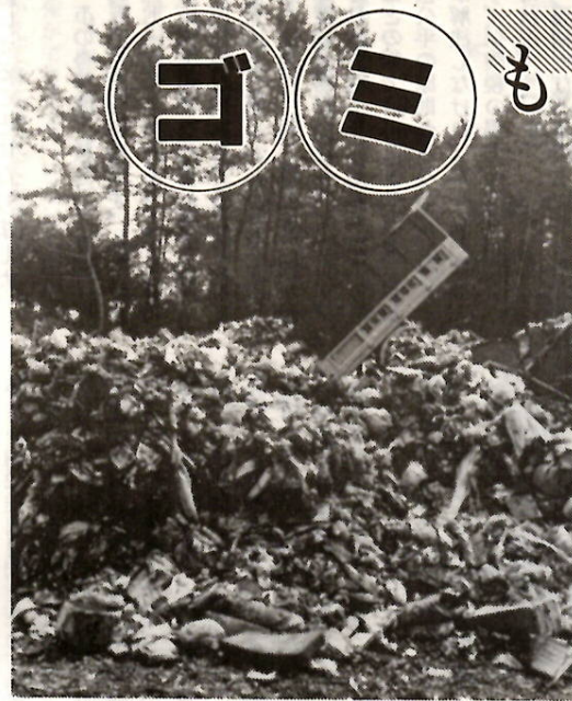
破砕後のゴミの埋め立て 荻窪清掃工場

事業(商売)上発する廃棄物(ゴミ)は、法の規定により事業者自身が適正に処理することになっていきます。市の収集場所へ出すことはできません。ご注意ください。事業者自身が処理できない場合、一般廃棄物は市の許可した業者に、産業廃棄物は法律で定める十九品目は県の許可した業者に処理を依頼してください。正しく処理しない場合は、法の規定により不法投棄などで処罰されます。