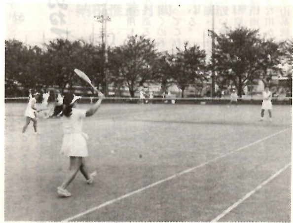
ママさんの利用が増えている市庭球コート

日時10月3日(土)・4日(日)・10日(日)・11日(月)・17日(日)・18日(月)・24日(日)・25日(月)・土曜日は午後1時から、日曜日・祝日は午前9時から 会場市庭球コート、王山運動場庭球コート 対象市内在住・在勤・在学の人種別男子シングルスA級・B級・C級、男子ダブルスA級・B級・C級、女子シングルスA級・B級・C級、女子ダブルスA級・B級、混合ダブルス、壮年シングルス・ダブルス