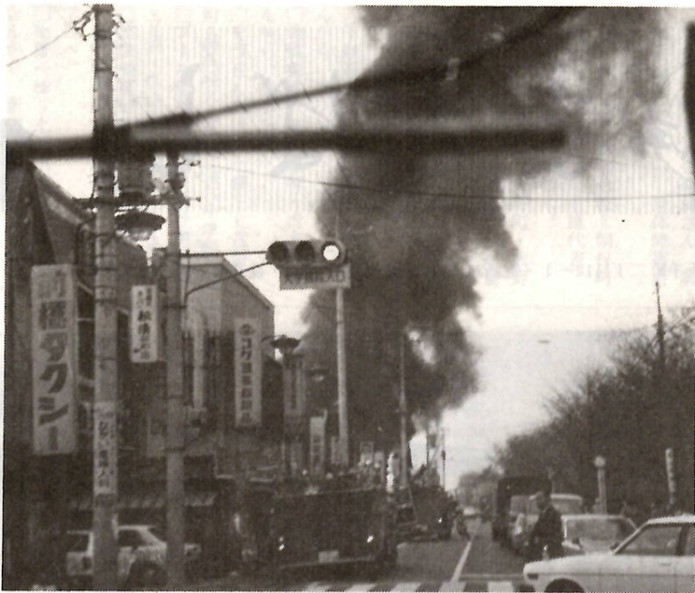
ちょっとした不注意が恐ろしい火災を引き起こします

火災の多発期を迎えて、秋の火災予防運動が、十一月二十六日から十二月二日まで全国一斉に実施されます。市では、消防本部と「すばらしい前橋」市民活動協議会の合同で、この運動を実施します。