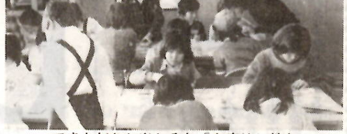
でき上がりが楽しみな「七宝焼」教室

しだい締め切ります。 □子供映画会 日時 11月22日(日)、午後1時30分 ～3時 内容 「バスツール」「草原の少 女ローラ」など