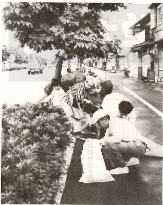
みんなの参加でたちまちきれいな町に