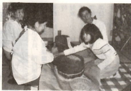
古い石うすを使ってきな粉づくり

九十点余りが、公民館講堂に所狭しと並べられています。十一月一日集鳥地区では、公民館とそれに並んで建てられた歴史民俗資料館「集鳥館」の建設記念事業として、歴史民俗資料展を開催しました。これは、町の人たちによって、今春から準備が進められていたものです。