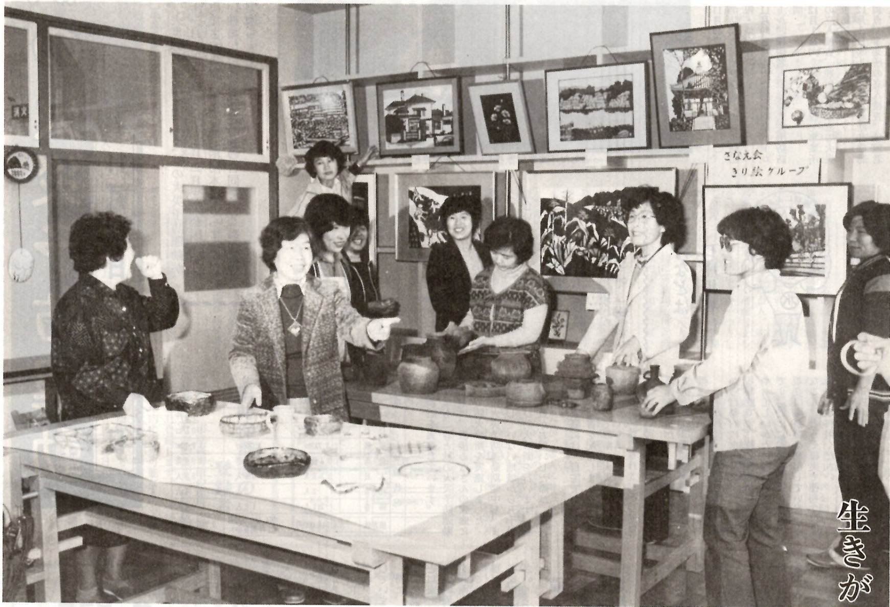
生きがいいっぱい