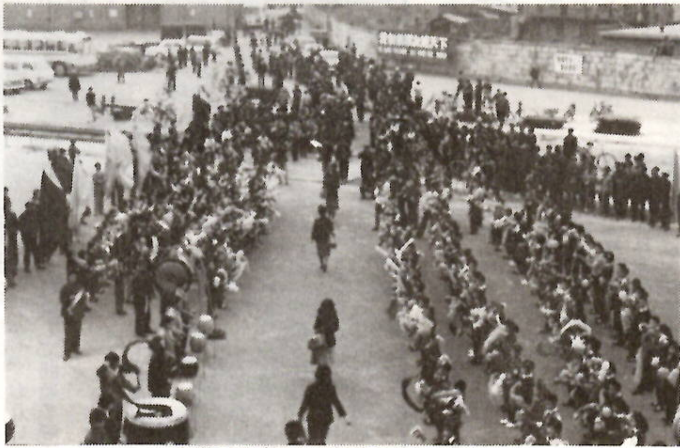
青島で盛大な歓迎を受ける団員たち

先月行われた県青年洋上大学には、本市 から二十人が参加し、中国各地の視察や現 地青年との交歓をとおして国際的視野を広 めて帰朝しました。 帰朝報告会は、参加者を囲むグループ懇 談とレクリエーションの機会です。今後、 洋上大学に参加したいかた、中国に興味関 心のあるかたの参加をお待ちします。