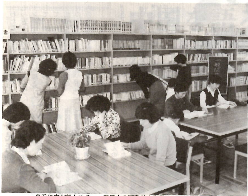
身近に本が親しめる——新田小の図書館を利用する地域の人たち