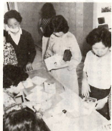
貸し出しはボランティアの大事な仕事

「図書館開放」はただ場所を提供するだけでなく、本をそろえなければなりません。特に大人向けの図書が必要になります。新田小では、市立図書館の払い下げ千冊と団体貸し付けの二百二