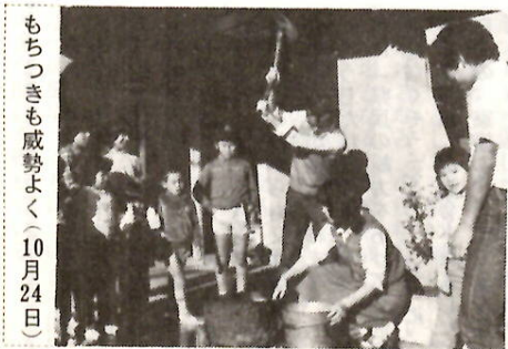
もちつきも盛勢よく（10月24日）

この募集は、既設市営住宅の空き住宅をあっせんする補充募集もかねた一回の機会ですから、希望者はお早めに申し込みください。