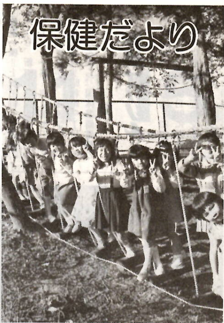
濱町・みねっ子の森で