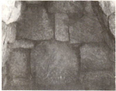
塩原塚古墳の石室

先月行われた県青年洋上大学には、本市 から二十人が参加し、中国各地の視察や現 地青年との交歓をとおして国際的視野を広 めて帰朝しました。 帰朝報告会は、参加者を囲むグループ懇 談とレクリエーションの機会です。今後、 洋上大学に参加したいかた、中国に興味関 心のあるかたの参加をお待ちします。