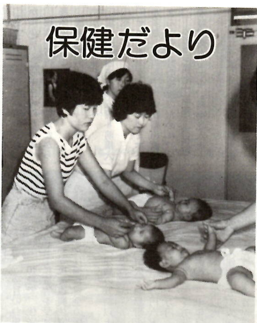
赤ちゃん体操 三か月児検診

□九月のガン検診（胃検診） 9月1日・8日（例）東公民館、午 前9時～10時 希望者は、ハガキで①受診会場 ②受診月日③検診名④住所⑤氏名 ⑥年齢、生年月日⑦電話番号を明 記して環境衛生課（〒371前橋市大 手町二丁目二一―）へ。または 電話（内線3264）で同課へ申 し込んでください。