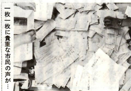
一枚一枚に貴重な市民の声が

一人一人のかたから市政への率直なご意見を寄せていただき行政に反映させる大事な調査。いま回答が続々と郵送で到着しています。