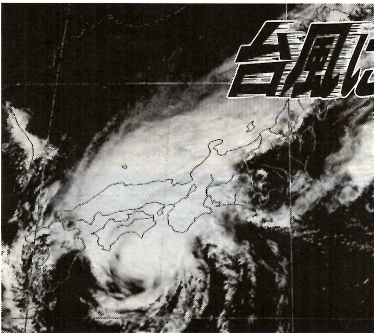
気象衛星「ひまわり」から送られてきた台風の写真

台風の季節——。先の台風10号により本市も市内全域で大きな被害を受けました。台風10号に備えるためには、なんといっても正確な情報と心の準備が大切です。市民のみならず一人一人がふだんから防災に心がけ、いざというときに備えましょう。