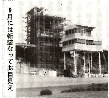
9月には新装なお目見え

国体自転車競技場となるのを機会に明るく楽しいスポーツ施設にイメージアップ。審判塔や婦人子供コーナーを改・新築中です。