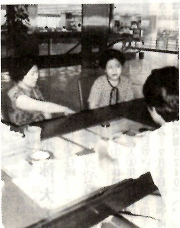
税の相談は気軽に窓口で