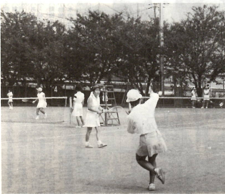
大会を目指して練習にも熱が入ります 市庭球コートで

生大会十六本以内の人へ一般男子B・C級以下・A級以外の高橋生へ一般女子・高校生・家庭婦人上級者へ家庭婦人A・B・C級・家庭婦人B・C級程度へ壮年一部45歳以上の入会者へ壮年二部60歳以上の入会者へ 試合方法 参加組数によりリーグ・トーナメント方式を併用