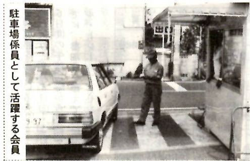
駐車場係員として活躍する会員

昨年設立した 前橋市シルバー 人材センターは、 七月二十三日で 一周年を迎え二 年生になりました。 この間、幾多 の障害、難関を 乗り越え高年者 に適した就業機 会の確保と事業 運営の基礎固め に重点をおき、 推進した結果、当初の目標を大幅 に上回る好実績をあげることがで きました。これもシルバー人材セ ンターをご利用くださった、みな さんのおかげだと感謝申しあげま す。引き続きシルバー人材センタ ーをご利用ください。 各事業所や家庭で、高年者によ