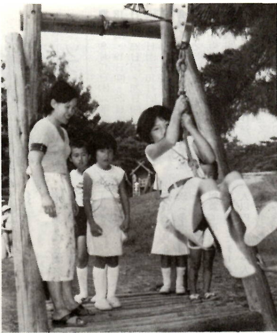
子供たちの健やかな成長を願って

八月は現況届の提出月です。児 童扶養手当を受給している人は、 八月の支払いを受けたら指定され た書類と証書および印鑑を、特別 児童扶養手当を受給している人は 証書と印鑑を持参して福祉事務所 へ提出してください。