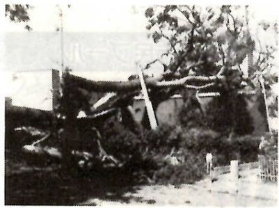
倒れた松の太木 高花台団地で

八月一日から二日にかけて、日本列島を襲った台風10号は、本市にも大きな被害を与えました。今回の被害は、風によるものが多く、街のあちこちで樹木や塀な