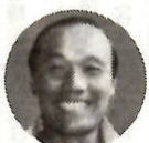
ベスト8までもう一歩でしたが、子供たちはほんとうにがんばりました。ほかに比べたところでは、スピードとフットワークがよくカバーしました。