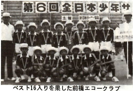
ベスト16入りを果たした前橋エコークラブ