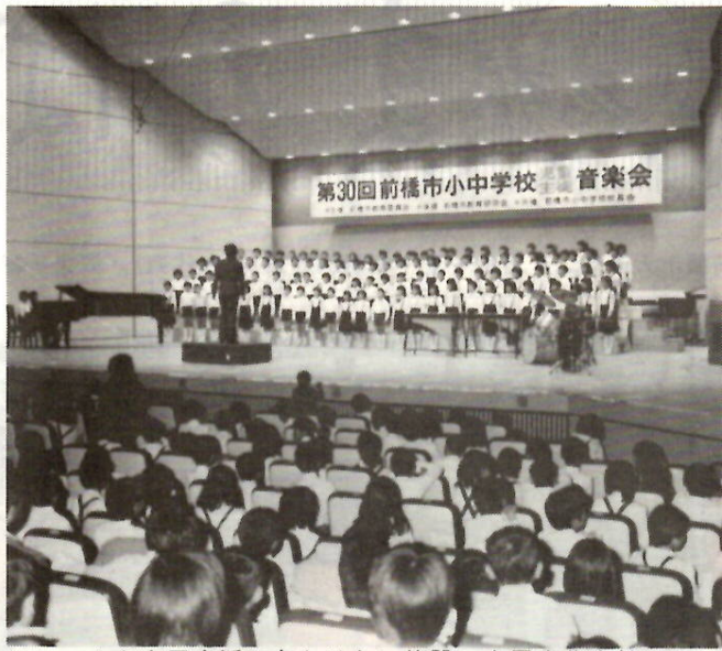
もう市民生活に欠かせない施設 市民文化会館

五十八年第四回定例市議会は、十二月二日から二十三日までの十四日の会期で開かれました。五十七年度各会計の決算、今年度補正予算、条例等議案など二十件が上程され、いずれも原案どおり可決承認されました。ここでは、認定された前年度一般会計を中心に、各会計の決算についてお知らせします。なお今年度一般会計は、今回の補正により五億八千三百万円となりました。