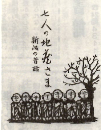
自分たちが採集して作った民話の本

作ります。昨秋は太田市の小学校に招かれて大成功を収めました。 「個人の名前を呼び合って本音を呼び合っています。お気楽に話にのっています。」