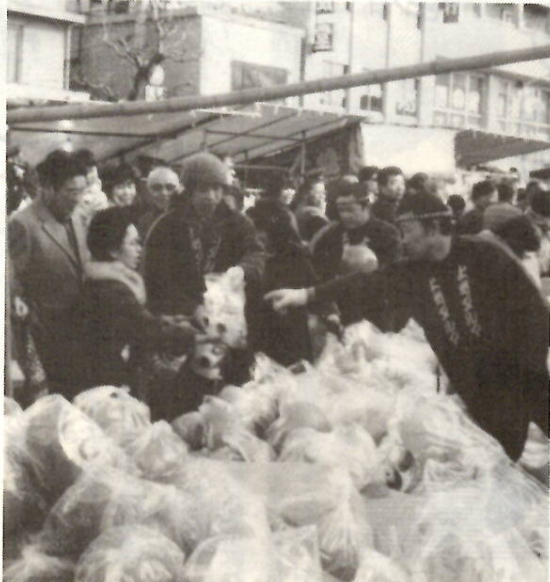
活気あふれるグルマ市 昨年

一月九日(日)は、恒例の「前橋初市まつり」が盛大に開かれます。この初市まつりは、元和三(二六一七)に起源を持つ初