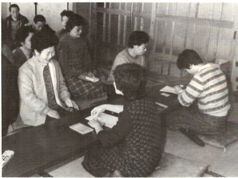
問診 最近若くは若い人の受診も目立ちます

●地区での検診日程 1月11日(水)東公民館(稲荷新田町、上新田町、下新田町)小相木町 1月18日(水)元総社公民館(元総社公民館、元総社町一〜四区) 1月24日(火)元総社公民館(大友町、大渡町、石倉町) 1月25日(水)医療センター(文京町三丁目、天川町、南町一丁目) 1月27日(金)元総社公民館(鳥羽町東、西、下石倉町、間屋町、元総社町78区) 1月30日(月)桂宮公民館三俣町(桂宮町)