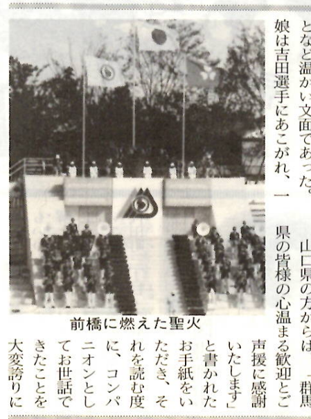
前橋に燃えた聖火

市指定史跡になった。の敷を換尺すると高麗尺で幅六尺、長さ九尺で、玄室の長さ幅の比が一・五である。横穴式古墳の研究上本墳はその基準とされることであることなどである。