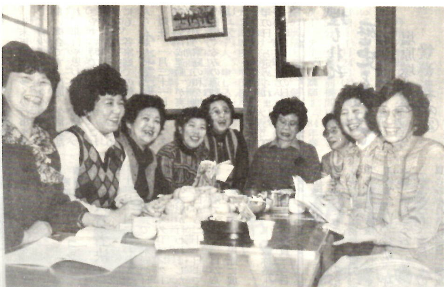
にぎやかな例会 このグループでは持ち回りで会員の自宅が会場に

自主的な学習グループの拠点の一つ、中央公民館。玄関を入った左側に、その日の部屋利用状況が表示されています。その一部をまとめると、上の表のようになります。古典、木彫り、陶芸、民謡、ダンス、オーケストラ、語学など、実にたくさん、そして多彩な団体、グループが利用しています。 学習活動の場は、有志の自宅や町の集会所などを除くと、多くの場合公共施設が利用されています。 市関係では、中央公民館を始め、図書館、地区の公民館、勤労青少年ホーム、市民文化会館などがあり、場所の提供、相談（別掲の社会教育相談を参照）や助言などを行っています。