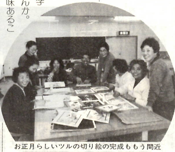
お正月らしいツルの切り絵の完成ももう間近

つて活動しています。この背景には、経済社会構造が変わり、生活様式の多様化、情報化社会や高度社会の到来などが余暇時間の増大とあいまって、新たな生活課題、心の豊かさや求める意識の高まりがあるものとみられます。 ここに紹介するのは、おおむね一般教養を内容とする、しかも市の施設とかかわりの深いものに限定した、ほんの一部の例に過ぎません。しかし、学びの時代」の新しい息吹が聞こえてくることは確かです。