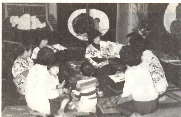
文化祭会場では子供たちに民話を聞かせた「民話の部屋」

語り合える友だちがいっぱい出てきた。民話の世界から自然と人間とのつながりの大切さを知った。顔を見ながら、ナマの声でお話を聞かすばらしさを子供に与えられる。などなど、会員の自稱「自画自賛」の生き生きとした声が聞かれます。