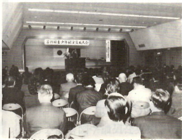
市内各地から熱心に 12月10日中央公民館で

年末年始は、多くの行事を通じて青少年に豊かな心を育てる良い機会です。反面、生活が乱れ、非行や思わぬ事故に結びつきやすい時でもあります。これらの事態を未然に防止するためにも、各家庭での触れ合いやだんらんがとても大切なことです。