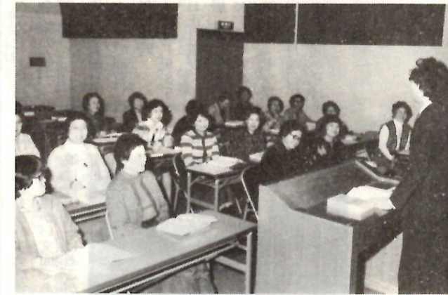
テキストを離れた先生のお話の魅力の一つ

時代背景や細かい事柄の説明などもされ、大学の教養ながらの本格的な講義が続きます。この日は「紅葉の賀」の終わりの方。先生のユーモアある話し振りに、思わず笑い声も上がります。