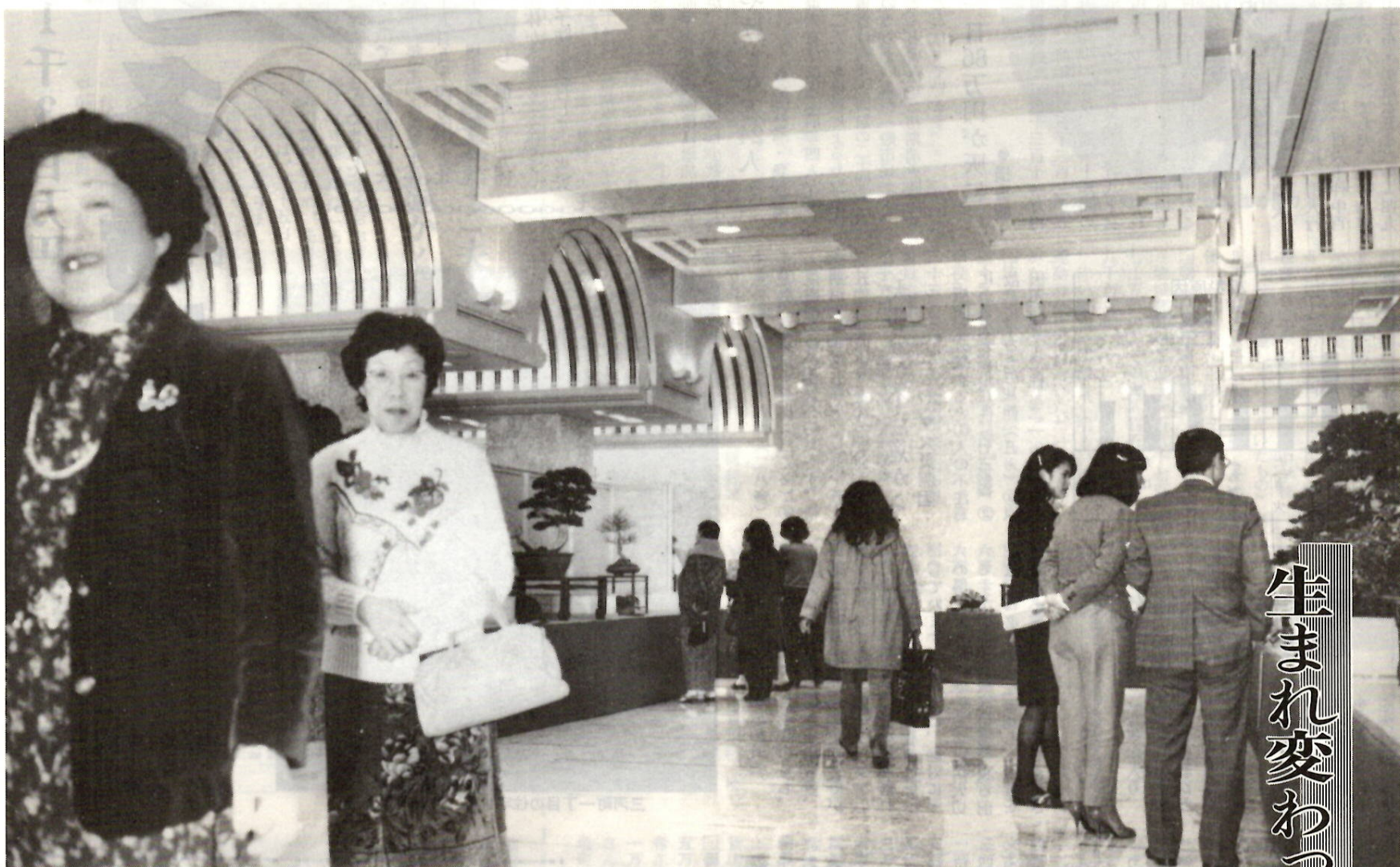
改修記念行事の展示会場になった大広間。大理石の床や壁、アーチ型の天井などとてもリッチな感じです。

発行・前橋市役所 前橋市大手町二丁目12-1・電話24局1111(大代表)／編集・総務企画部広聴文書課／毎月1日・15日