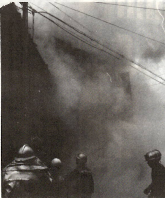
三河町一丁目の住宅火災 昨年3月1日

原因を分類すると①人の不注意による失火百十八件（七三％）②故意によるもの八件（五％）③原因不明三十三件（二二％）④自然