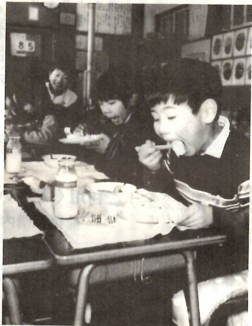
はしで給食のご飯を食べる一年生 駒形小

けれども、大室小学校や中央小学校のように、保護者と学校で相談をして、家庭からはしを持参しているところもあり、こうした学校が増加する傾向にあります。今後保護者のかたの協力をいただきながら、改善に向け努力してまいります。(教育委員会総務課)