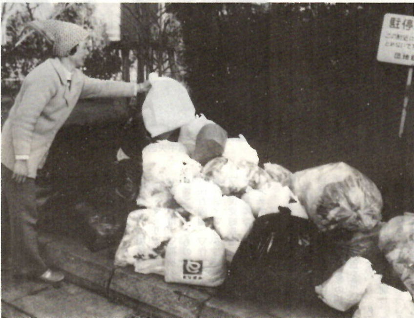
袋出しの方式がよく守られているゴミ集積場所 下細井町で

下水処理場の近くに住んでいます。最近、処理場の中も整備され、たいへんきれいになってきま