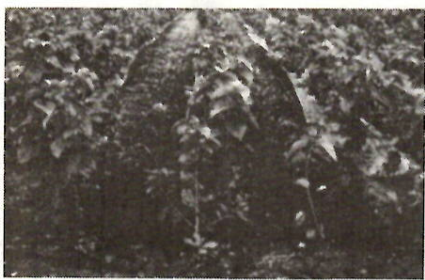
桑の新品種「新一の瀬」

最近では、品種の改良や機械の導入などにより、旧来の桑園も変わりつつある。機械による桑刈りが実現するのもそう遠くないことだろう。