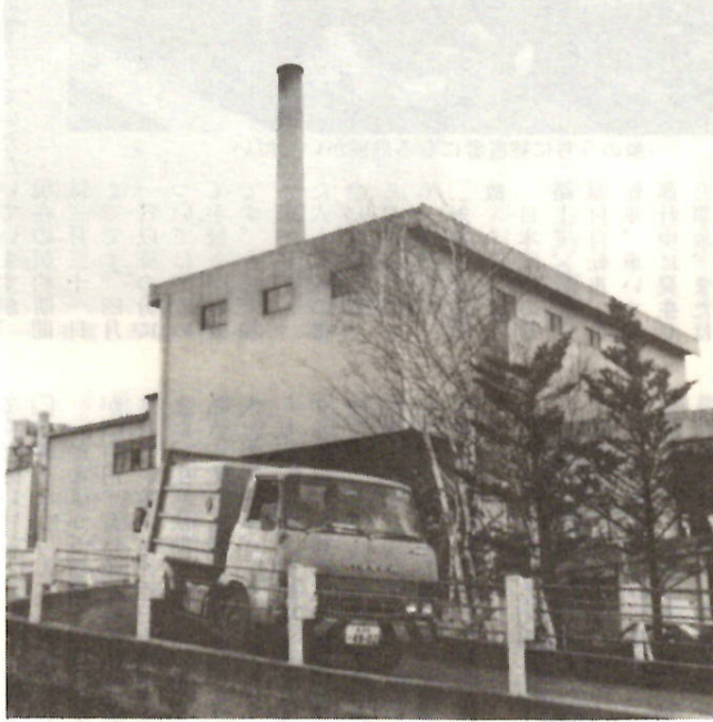
快適な生活環境づくりにフル回転の六供清掃工場

「他市より税金が高い」とのご意見がありました。個人の住民税と固定資産税の課税の実態を紹介いたします。