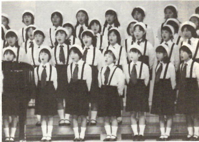
美しいハーモニーをのびのびと 昨年の発表会