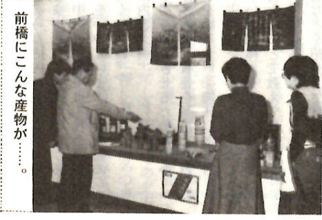
前橋にこんな産物が……

☆ 図書館で民芸・物産展 文学のれん、模型はわ、竹細工、菓子、地酒など前橋の特産物を紹介する図書館としては異色の展示。三月二十六日まで。