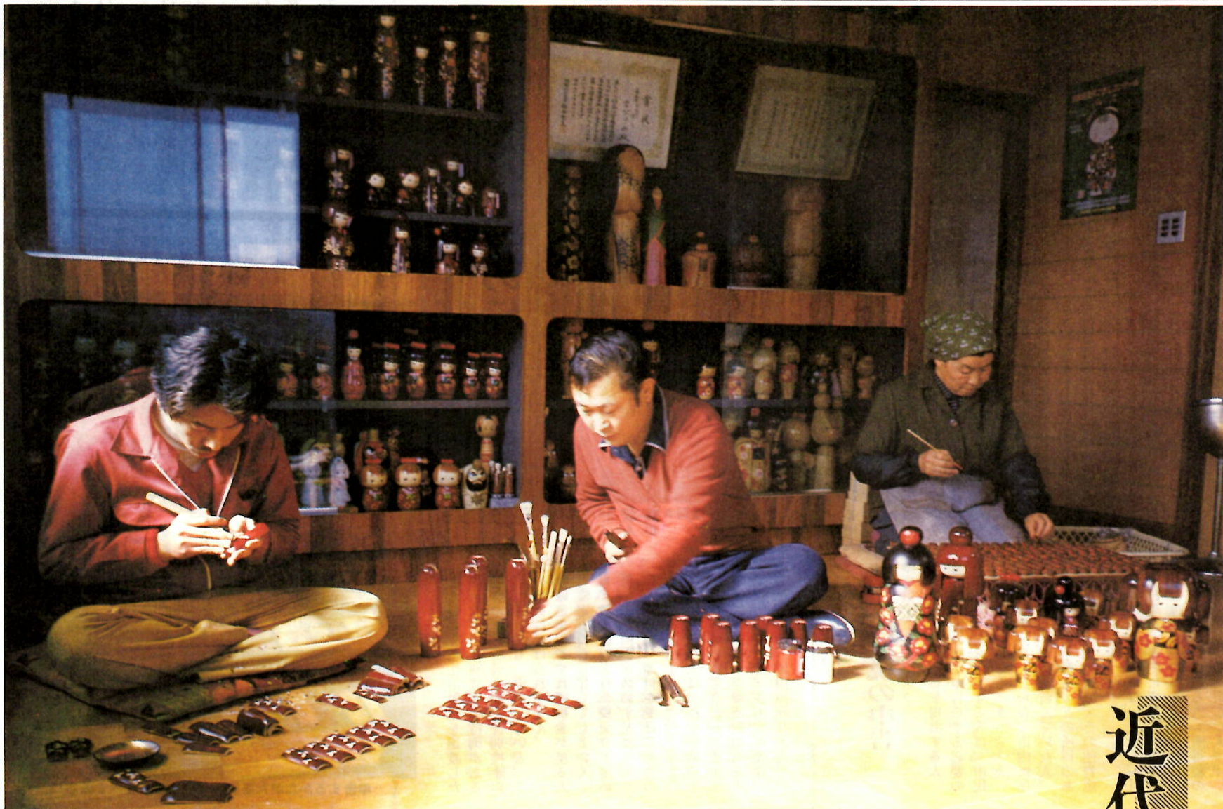
〇 として保存してください つかまた お役にたちます 〇