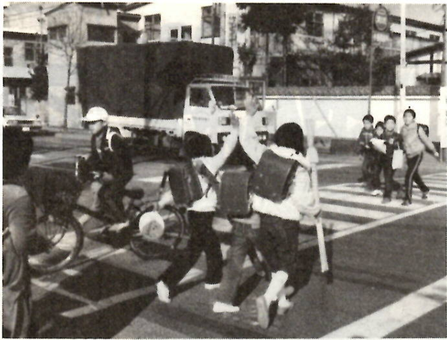
一瞬のうちに被害者になる危険がいっぱい

日本国内の道路上で、自動車、原付自転車、自転車、車いすの運行中に発生した事故、またはこれらの車両や電車などに、は