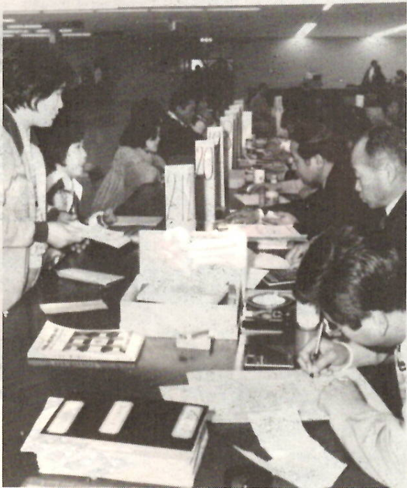
申告するかたがたを受け付ける市役所2階窓口

る所得がある人。 ③二か所以上の給与などの支払者から給与を受けている場合で、年末調整をしなかった給与の収入金額と各種の所得金額の合計額が二十万円を超える人。 ④同族会社の役員や、この人と親族関係などにある人で、その同族会社から給与所得のほかに、店舗・工場などの賃貸料や貸付金の利子などの支払いを受けている人。 ⑤災害を受けたため、五十七年中の給与の源泉徴収額の徴収税額の徴収の猶予を受け、また徴収された税金の還付を受けた人。 退職所得がある人Ⅱ退職所得は、通常申告する必要はありません。しかし、退職手当などの支払いを受ける際に、「退職所得の受給に関する申告書」を提出しなかつたため、二〇〇の税率で所得税を源泉徴収された人などで、退職所得について源泉徴収される所得税が、正税に計算した税額よりも少ない人。 資産所得合算課税の適用を受ける人Ⅱ資産所得の合算課税を受ける人は、申告しなければなりません。譲渡所得がある人Ⅱ土地や建物などを譲渡（交換、法人への贈与、地上権の設定なども含む）した場合に、申告しなければなりません。