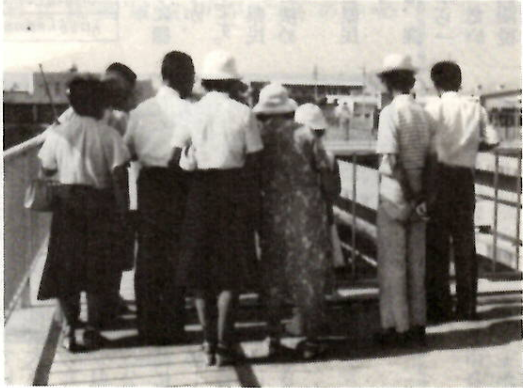
市有施設の下水道処理場を見学するモニター