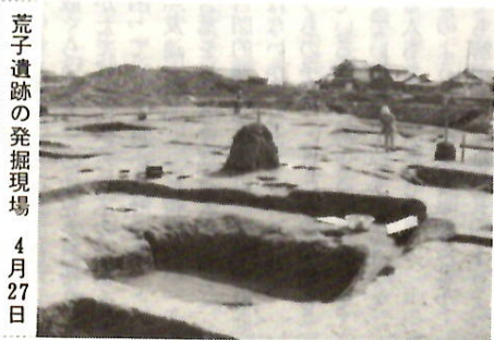
荒子遺跡の発掘現場 4月27日

このほど土地改良事業関連で発掘調査された荒砥荒子遺跡は、五・六世紀の築造。最も古い豪族の居館と見られる貴重なものです。