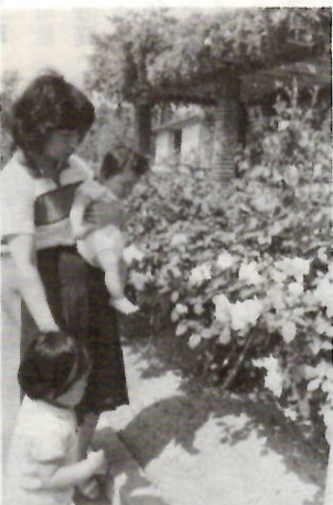
咲き始めたばら園のバラ