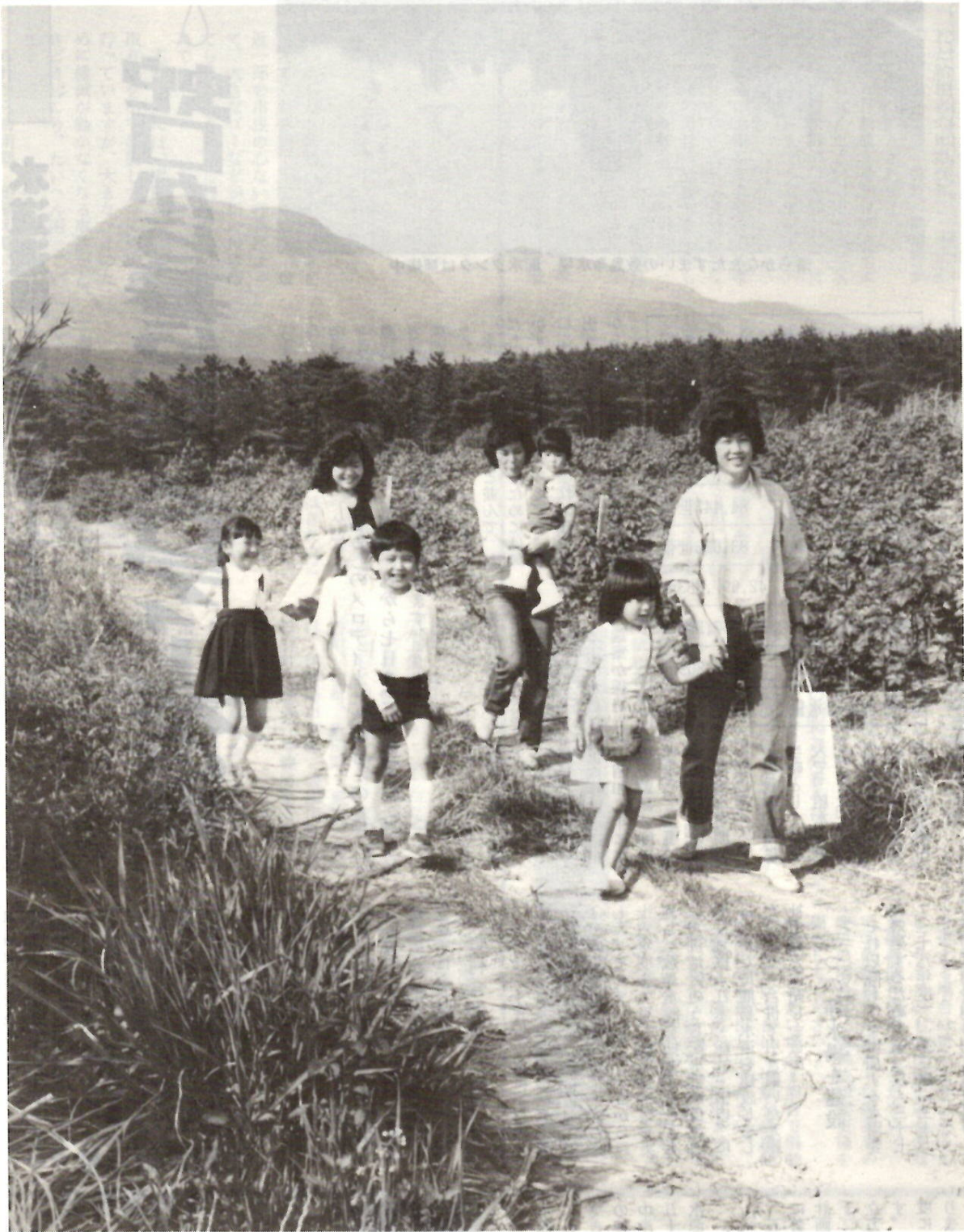
きれいな空気、あふれる緑。草の生えてる土の道も大好き。出かけて来てよかったね。