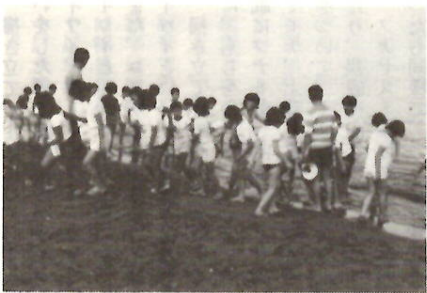
真夏の間は小学生の臨海学校