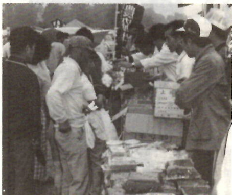
すっかり市民生活に定着した連合朝市

早起きをして、朝の買い物を楽しみませんか。 恒例の「市民連合朝市(夏季)」を立川町通りで開催します。地区朝市関係者や経済連などの九十余の店舗が出店し、野菜、果実、魚介類など新鮮で良い品を安価で販売します。広い駐車場も用意してあります。朝市開催中は、歩行者天国です。当日、先着千人の子供にプレゼントがあります。 日時Ⅱ6月5日(日)午前6時30分Ⅲ9時、小雨決行 会場Ⅱ立川町通り 販売品Ⅱ生鮮食料品、一般食料品、日用雑貨品、生活用品など 駐車場Ⅱ朝市開催中は弁天通り駐車場、中央駐車場を無料開放 問い合わせⅡ商政課 ☎3606