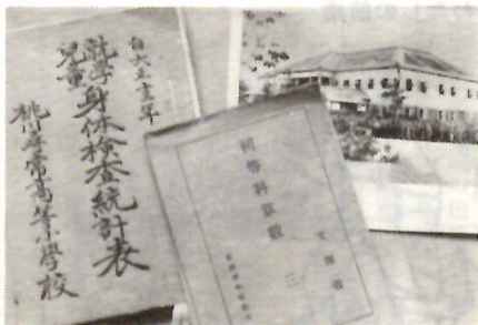
編さんに欠かせない教育資料