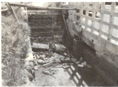
汚ない川 ゴミ取り機も動かない