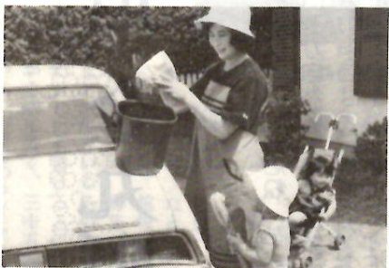
バケツを使って楽しい洗車

ホースでの流しっぱなしの洗車は、三百リットル以上の水を使います。バケツに水を含んだ場合は、五十リットル程度で済みます。一週間に一度洗車した場合、一か月の節約量は浴槽五杯分(一立方尺)。月にして約