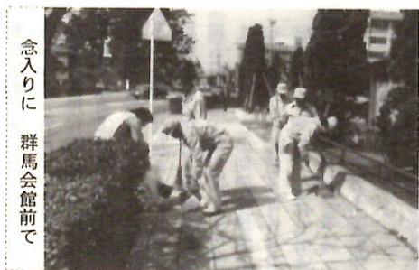
念入りに 群馬会館前で

で、二班は施設生五人と職員二人が群馬会館前から前橋公園内を通り、それぞれ臨江閣までを担当。当日が雨や施設の行事に重なる場合は、日をずらし週一回必ず実行しています。毎回、一時間半ほどの作業で、空き缶、たばこの吸い殻など約五十キロのゴミが集まるということです。 この清掃活動に参加しているのは掃除好きの人たちばかりで、活動の日が来るのを楽しみにしています。 「けっこう距離があるので体によいし、最近顔見知りの人ができ、ご苦労さんといわれると