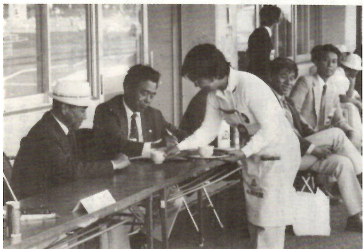
県身障者スポーツ大会でも大活躍の婦人ボランティア