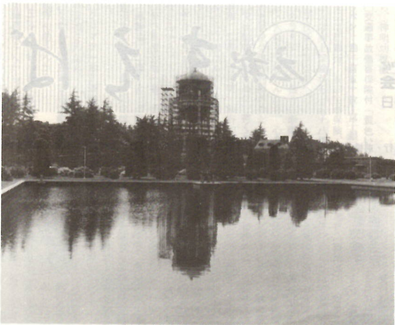
清らかなたづまの敷島浄水場、配水タンクは補修中

「蛇口から暮らしてのメロディー 水の音」の標語を掲げて、六月一日から七日まで「水道週間」が全国的に繰り広げられます。