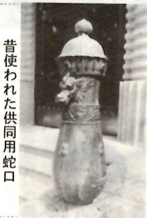
昔使われた供用用蛇口

丁目 定員 各百五十人 申し込み 6月1日(火)から10日(土)までに直接または郵送で群馬県消防設備保守協会(〒371前橋市大手町一丁目一 県消防防災課内)へ問い合わせ 県消防設備保守協会 ☎0158 3211 たは消防本部予防課 ☎243