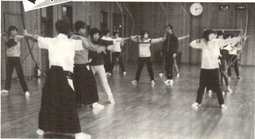
健康づくりにはもちろんシェイプアップにも…