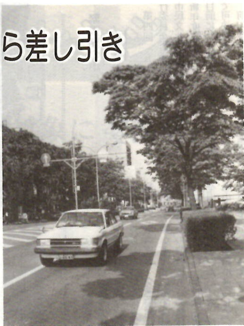
ケヤキ並木が美しい県庁前通り

説明します。この通知書が交付された納税者の市県民税は、給料から差し引きして、毎月、勤務先から市役所へ納入されます。年税額と月割額通知書の右側太線内をご覧ください。五十八年度の特別徴収税額の年税額と、六月から来年度五月までの月割額が記入してあります。