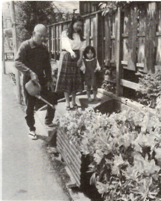
いたわりの気持ちが道路ばたの草花にも