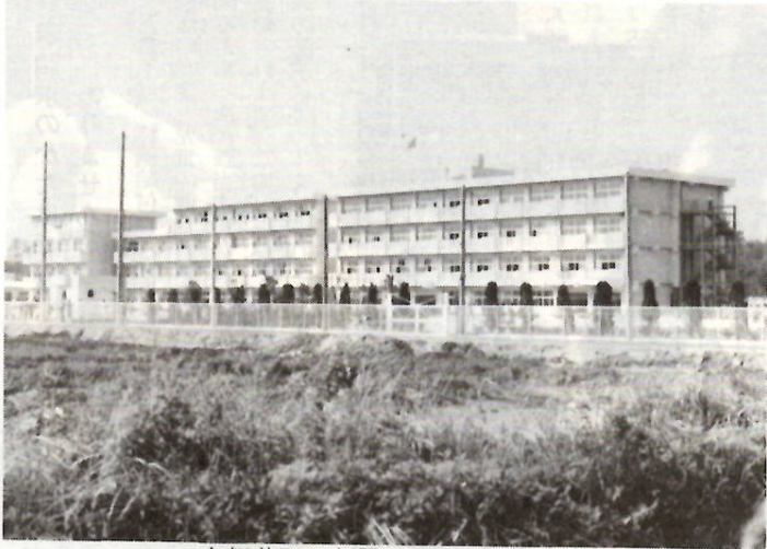
上細井町に新設された鎌倉中

市県民税の納税の方法には、普通徴収と特別徴収の二つがあります。このほど通知した納税通知書は、納税組合を通じて、口座振替によって納めていただくもので、これを普通徴収といっています。年税額を四回に分けて納めていただきます。第一期の納税額は六月です。