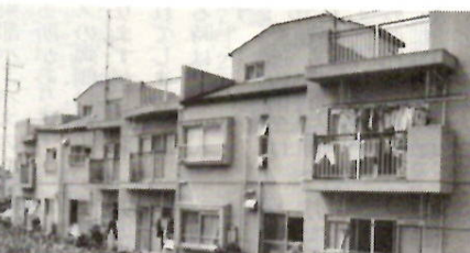
タウンハウス 日吉町一丁目

共同して建築するもの（二階以上で耐火構造のものに限る）（二）幅員八メートル以上の街路に面する土地（三）人以上の土地所有者五百平方メートル以上（四）三階以上の耐火構造の共同建築物を建築するもの