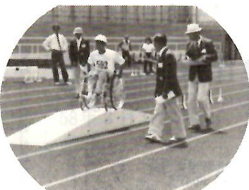
車いすスラローム

成果を挙げ、果敢に挑戦する姿が、市民のみなさんにより多くの人々の心を惹きつけ、この大会を盛り上げ、障害を持つ人々と交流を図っていただくために、今回から連戦で競技種目やその見どころなどをご案内します。