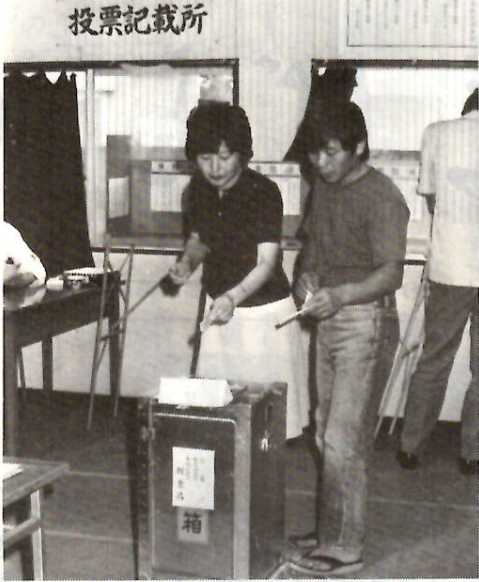
大切な選挙。棄権しないで必ず投票を