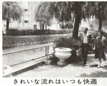
きれいな流れはいつも快適