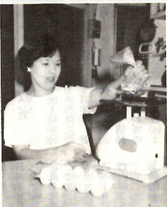
表示どおりあるかしら……

中に購入した消費物資のうち指定された商品について、貸与されたばかりで計量し、必要事項を計量日誌に記入、さらに計量に関する意見、要望なども記入して、期間終了と同時に市に提出していただきます。募集人員10人（応募者の中から地域など考慮して選考）応募資格計量に関心をもつ家庭の主婦（二人一組になっても可）委嘱期間7月20日（9月19日）（二か月間）