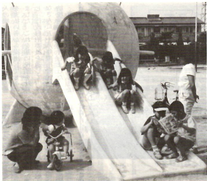
子供たちみんなが健やかに成長するために

の額（例えば、五十八年六月からは扶養親族四人の時はおおむね二百四十七万五千円）に満たないこと