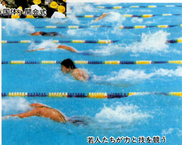
若人たちが力と技を競う