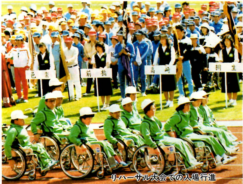
リハーサル大会での入場行進

この大会には二つの大きな目的があります。一つは、身体障害者がスポーツを通じてお互いの友愛を深めながら、自分自身の力で明るく強く生きていくための自信と希望を育てることです。もう一つは、身体障害者に対する一般社会の正しい認識を深めることです。特に会場地となる本市では、