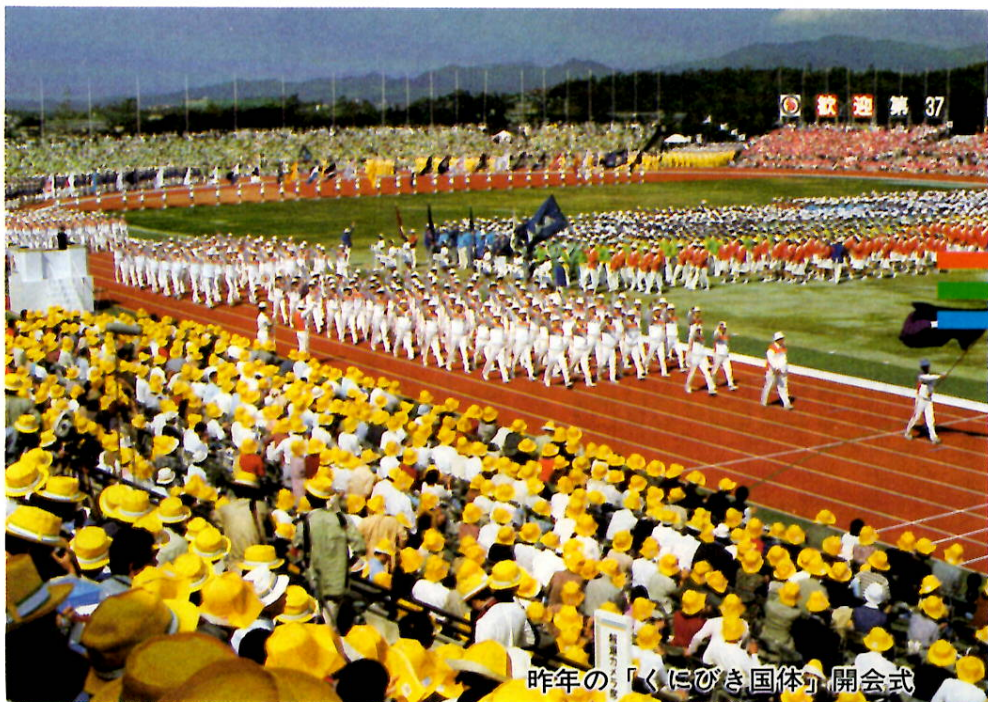
昨年の「くにびき国体」開会式