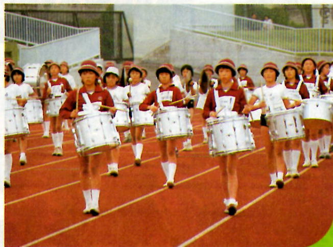
現地で鼓隊の練習会

「あかぎ国体」の本番間近……。いよいよこの夏と秋に第三十八回国民体育大会が、本市を主会場に開かれます。県や市の実行委員会の準備業務も急ピッチ。出演する団体の取り組み、歓迎する市民の活動も着々と進んでいます。五十年に一度の大事業を、市民みんなの力で成功させましょう。