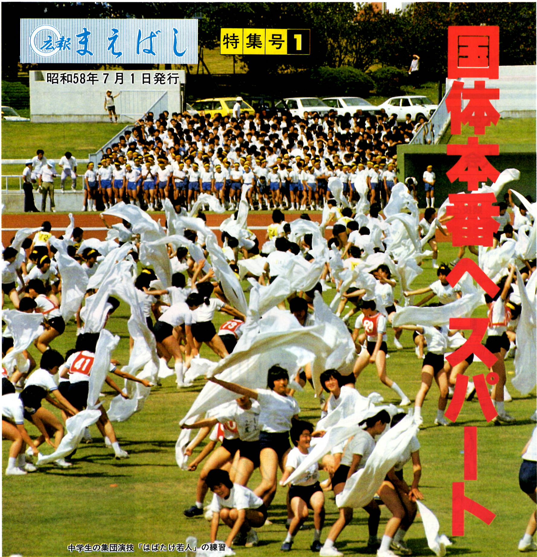
中学生の集団演技「はばたけ若人」の練習