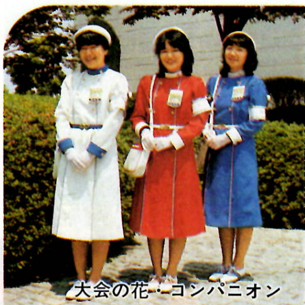
大会の花——コンパニオン