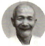
先祖の人の心 二百周年と いうので、総 社地区の史跡 愛宕会に提案 したんです。 七月八日に会

の名で塔婆(とうば)を建てました。この供養塔は、あの浅間焼けの様子と、われわれの先祖の総社の人々の気持がよく表れていてね。貴重な文化財なんだと思いますよ。(総社町総社・69歳)