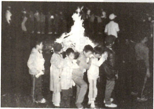
楽しいキャンプファイヤー 赤城山で

によって、創作表現に対する興味も養います。 □入園該当者 3歳児 55年4月2日から56年4月1日までに生まれた人 4歳児 54年4月2日から55年4月1日までに生まれた人 5歳児 53年4月2日から54年4月1日までに生まれた人 募集人員 市立 神明幼稚園 4歳児八十人、5歳児若干人、若宮幼稚園 4歳児百六十人、5歳児若干人、総社幼稚園 4歳児八十人、5歳児若干人 私立 3歳、4歳、5歳で、人は幼稚園により異なります。明和幼稚園は、3歳児を除きます。 □募集期間 お問い合せください。