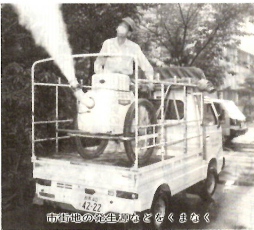
市街地の発生源などをくまなく

8月12日・26日(金) 前橋医療センター 午後1時30分～3時 8月19日(金) 前橋医療センター 午後1時30分～3時 8月26日(金) 前橋医療センター 午後1時30分～3時 8月31日(水) 前橋医療センター 午後1時30分～3時