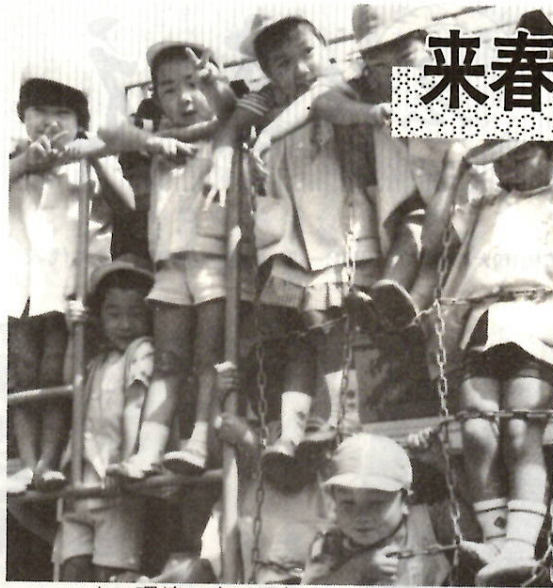
よい環境の中で元気に伸び伸びと

幼稚園は、幼児を保育し、適当な環境を与えて、その心身の発達を助長することを目的としています。 たとえば、園内において、集団生活を経験させ、喜んでこれに参加する態度と協同、自主及び自律の精神の芽生えを養います。また、音楽、遊戯、絵画など