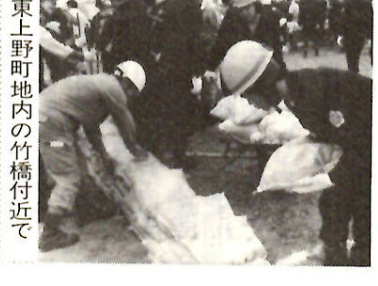
東上野町地内の竹橋付近で

昨年は予定していた日が本番の豪雨となつて中止。今年は六月三十日、消防隊員ら約二百五十人が参加して行われました。