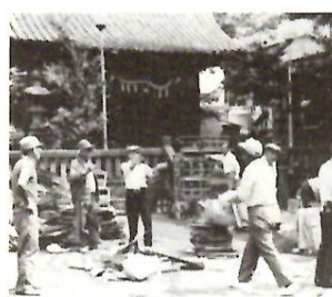
元気ががんばる人々

長寿会が「資源愛護」活動 城東町二丁目長寿会 城東町二丁目長寿会では、環境美化運動として、毎月第三日曜日を「資源愛護の日」と決め、廃品回収を実施しています。最初は「果たして自分たちに続けられるだろうか」と不安があったというのですが、三年間一回も休まず行ってきました。