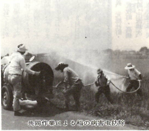
共同作業による稲の病害虫防除

伝染病を媒介する蚊、ハエを撲滅するため、夜間屋外薬剤散布を実施します。事故が起きないようにご協力をお願いします。薬剤散布実施日 7月29日(金) 8月19日(金)、9月2日(金)、当日が雨天の場合は、翌週の金曜日に実施。作業は午後10時ごろから始まりますが、区域によって時間が多少異なります。