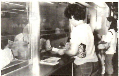
第2 土曜を休む金融機関の窓口