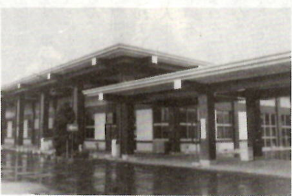
拡張工事が行われる市営斎場