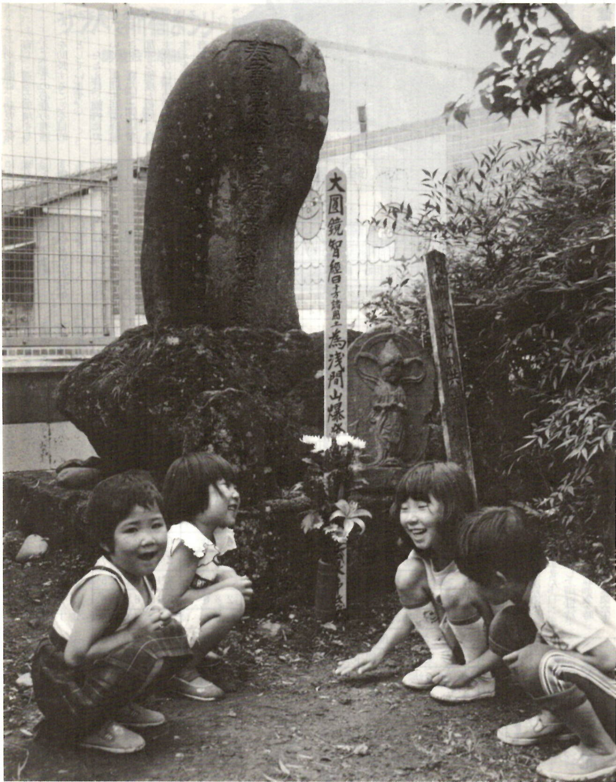
200年前をしのばせる自然石の碑。地元の人々によって塔婆と花が供えられました。