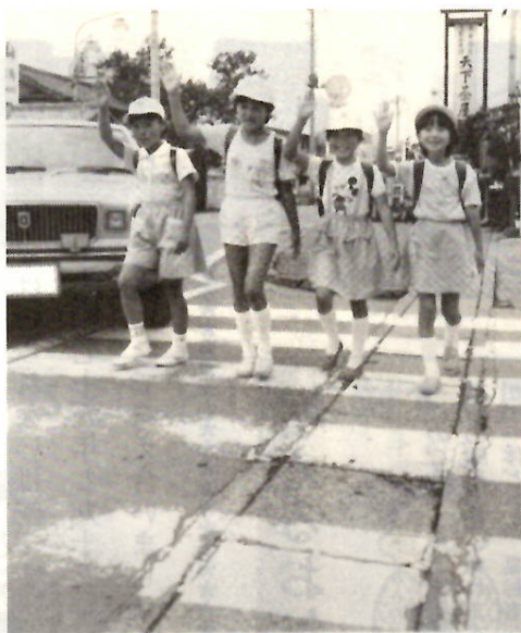
歩く人も運転者もルールを守って

交通事故が増えています。本市の今年一月から八月までの状況は、交通事故九百十二件、死者十八人、負傷者九百八十六人と、前年同期に比べて、事故件数四十九件、死者六人、負傷者四十人増えています。