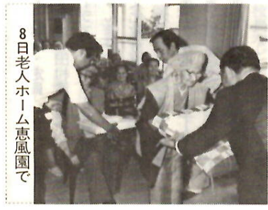
8日老人ホーム恵風園で

お遠慮でやっていますね」と市長らの「敬老の日」行事。長寿者家庭や老人ホームなど十か所で和やかに行われました。