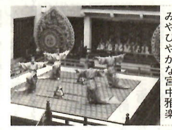
みやびやかな宮中雅楽

★宮中雅楽公演 地方へ出ることのほとんどない宮中雅楽がやります。日本の音楽の原点を探る最も確かな方法は、本物の管絃と舞楽を見ることだといわれています。どうぞご覧ください。