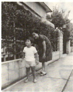
対象になった生け垣

道路に面して生け垣を作り、都市緑化に協力していただいた場合、奨励金を交付します。