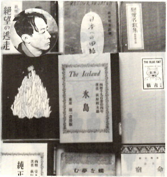
朔太郎(円内)と郷土詩集の原典になる著書

□マンドリン演奏と詩の朗読 日時 10月1日(日)午後2時～3 時 会場 市民文化会館 内容 『マンドリン演奏』朔太郎作 曲『機織る少女』(両角文則さ ん)、朔太郎編曲『春雨』『真白 き富士』(前橋女子高マンドリン 部)ほか『詩の朗読』朔太郎 自作朗読『乃木坂俱樂部』沼沢