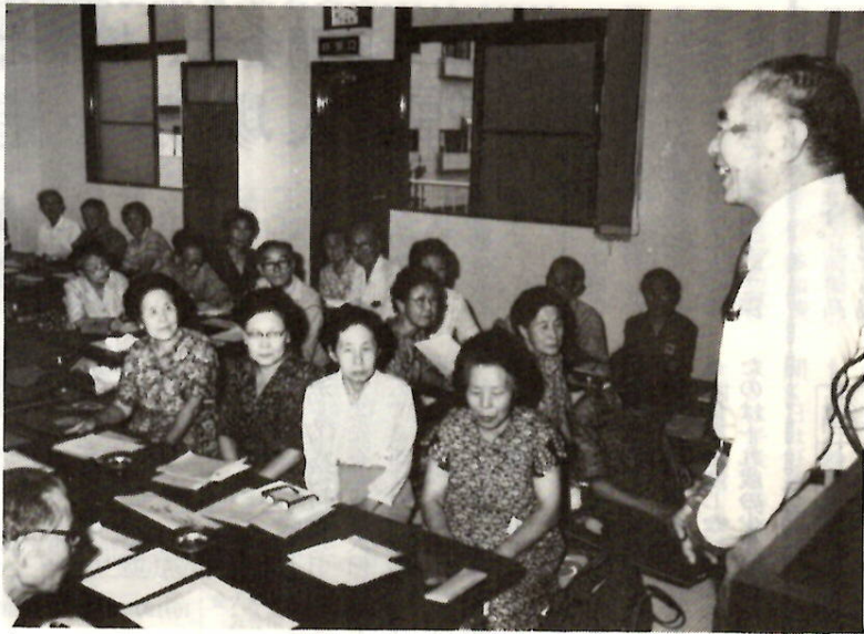
講師のお話になさながら聞き取る教室のみなさん