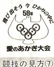
愛のあかぎ大会 競技の見方⑦

「愛のあかぎ大会」の後夜祭の会場となるため、市役所の駐車場は使用が制約されます。市議会庁舎西側駐車場(10月29日(土)午前8時～10月30日(日)終日)市議会庁舎北側駐車場(10月29日(土)午後1時～10月30日(日)終日)中央公民館西側駐車場(10月30日(日)終日) ○：お問い合わせは厚生課(内線)3240へ。