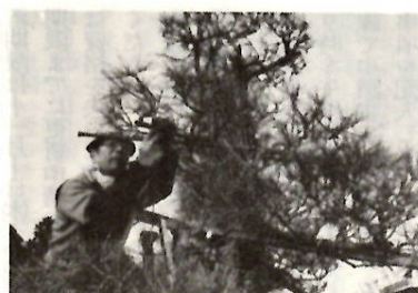
自慢の腕を生かして

みなさんの身近に高齢者向けの仕事がありましたら、シルバークラブセンターにご連絡ください。今までに就業した主な仕事内容は次のとおりです。専門技術(ボイラー運転、家庭教師、事務整理)一般事務、封筒あて名書き、毛筆賞状書き、伝票整理、監視管理(駐車場管理、施設管理)技能(植木手入れ)