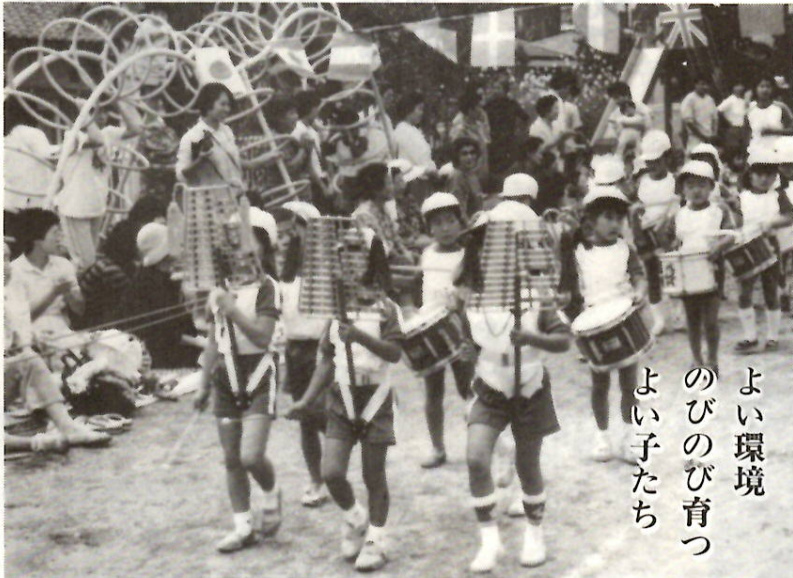
お母さんたちの前で名演奏 第一保育所の運動会で

保育所(園)は、家庭で保育のできない児童に 対して、施設や諸条件の整ったよい環境のなかで 零歳児から年齢の発達段階に応じて充実した保育 を行っています。市では、五十九年度保育所(園) の入所申請書を受け付けます。入所申請は、現在 入所中の児童の場合も必要です。