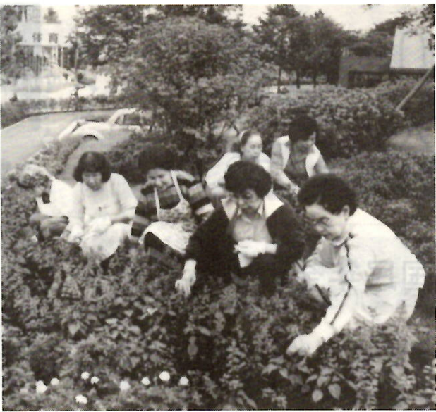
会場付近の花壇の手入れ

「あかぎ国体」夏季大会は、市民のみなさんの努力によって「きれいなまち」の印象で、成功に終了しました。引き続き