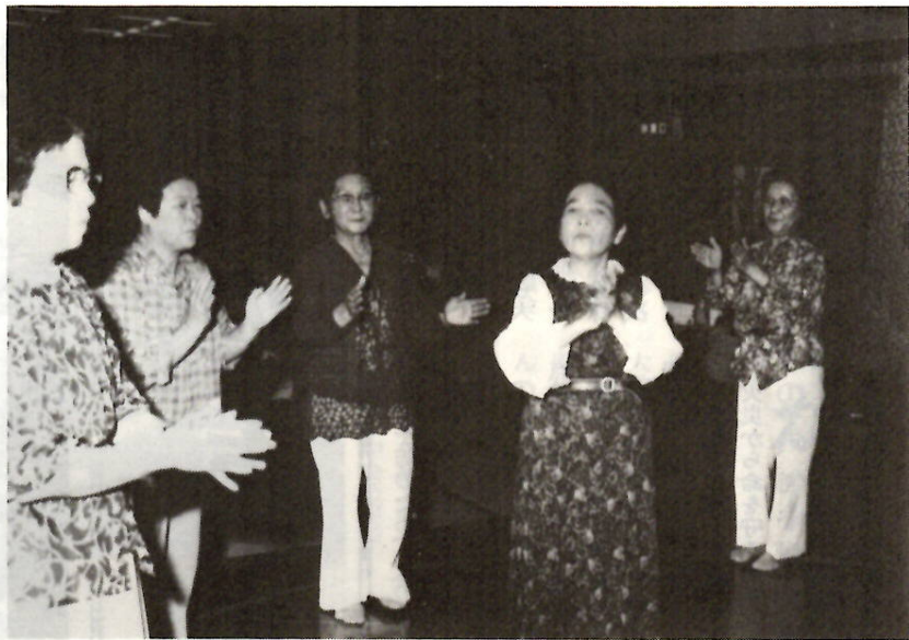
民謡踊りを楽しむお年寄り 市老人福祉センター「しきしま」で

昭和36年4月1日以降の他の公的年金加入者の配偶者期間と合わせて25年以上あること。