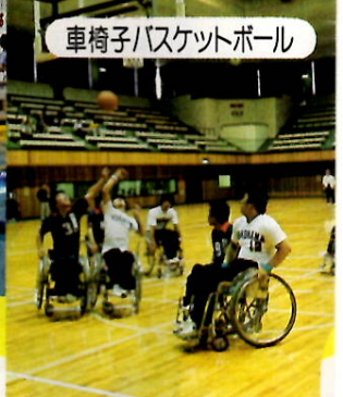
車椅子バスケットボール