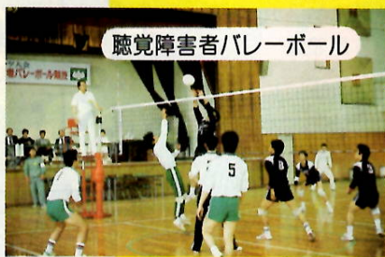
聴覚障害者バレーボール