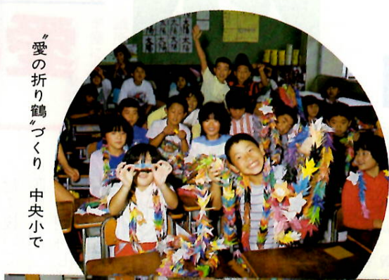
「愛の折り鶴」づくり 中央小で