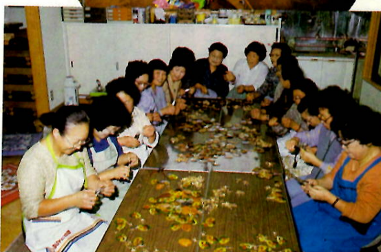
革細工に取り組む南橋地区の婦人ボランティア