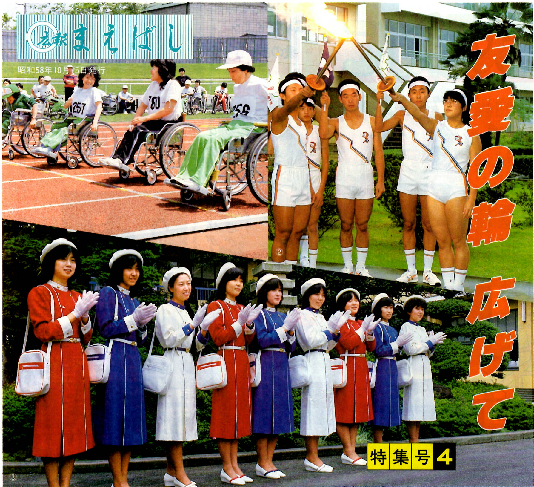
写真=①これからスタート、車いす競争②炬火引き継ぎの練習③大会に花を添えるコンパニオン