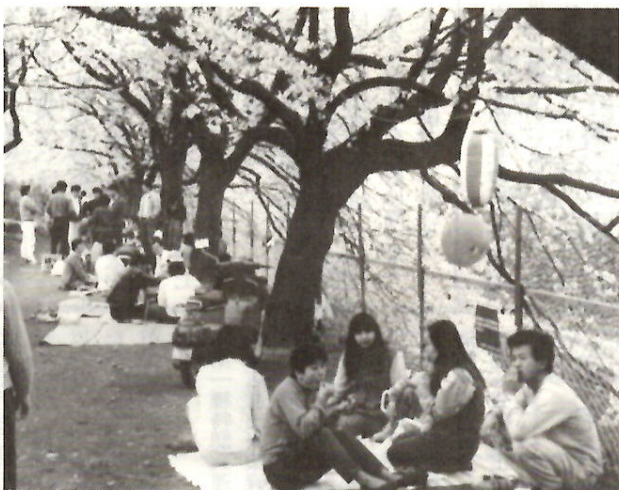
▶ 待っていたお花見にどっと

お花見の伴奏にいかが？ 日ごろの成果を披露する紅雲町一・二丁目高齢者教室のみなさん。