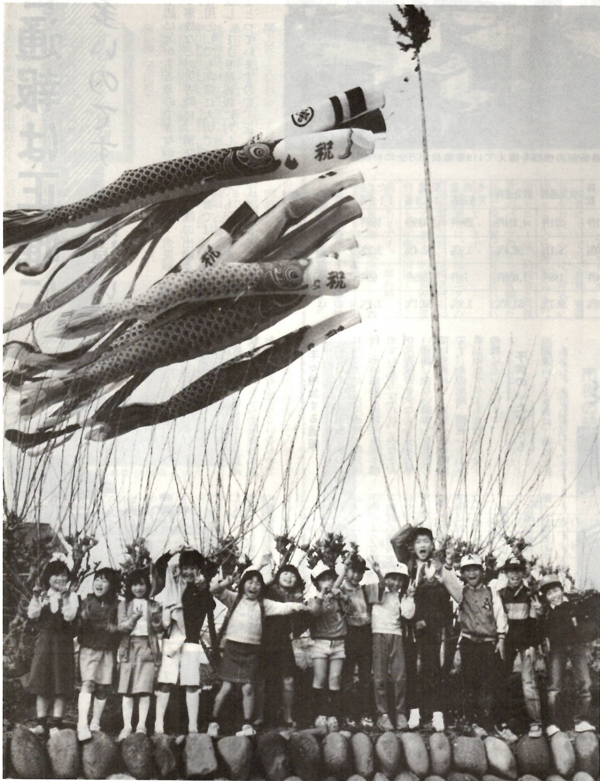
みんなみんな元気そのものの子供たち。桑の芽も日に日にふくらみを増して……。泉沢町で。

発行・前橋市役所 〒371前橋市大手町二丁目12-1・電話24局1111(大代表)／編集・総務企画部広聴文書課／毎月1日・15日