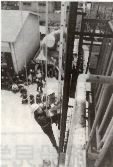
訓練を重ねる救助隊

消防本部では、日ごろの訓練成果の披露と県大会の予選を兼ねて消防救助大会を開きます。観覧は自由です。のでみなさんお誘いのう