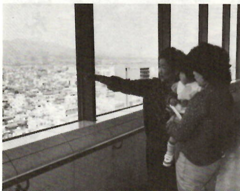
「ホラ、あれが谷川岳よ」