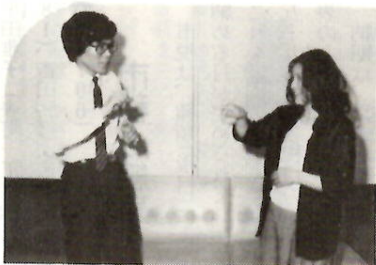
手の動きから触れ合いが