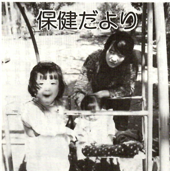
ブランコ 朝日町1号公園