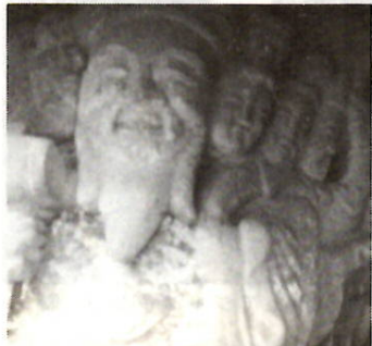
一石に刻んだ七福神像