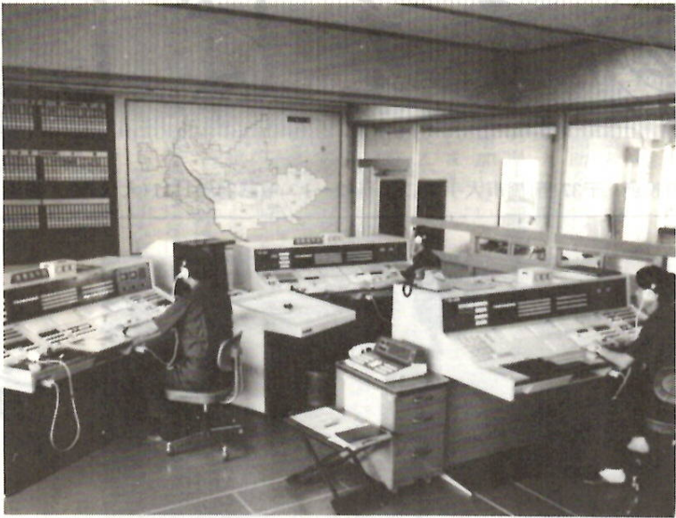
最新鋭の機器を備えて119番職員が万全の待機態勢

電話は日常生活に欠かすことのできないものですが、火災や人命に危険のある事故などの災害時に、消防隊、救急隊の出場を要請する緊急通報用としても非常に大切です。消防署では、職員が二十四時間待機し、119番通報に対し、一刻でも早く活動ができる出動態勢をとっていますので、正しく通報しましょう。