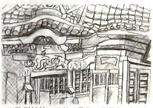
駒形神社 若林 勇作（木瀬中1年）