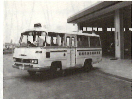
通報、指令、さあ出動だ！