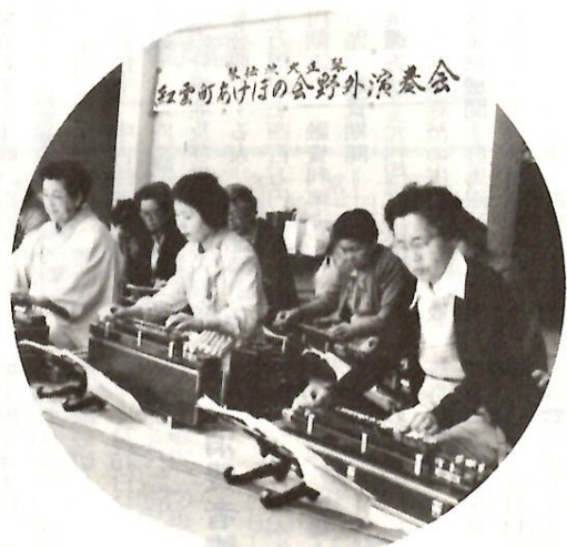
▲ 前橋公園ステージで大正琴

お花見の伴奏にいかが？ 日ごろの成果を披露する紅雲町一・二丁目高齢者教室のみなさん。