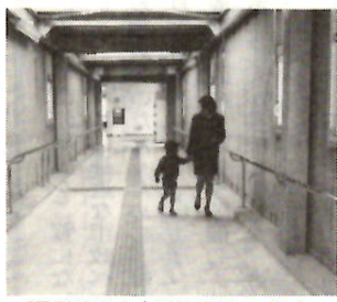
通路には点字ブロックも

線路をまたいで駅の東西を結ぶ西口自由通路は、長さ約百六十、幅三。駅利用に関係なくいつでも自由に通行できます。