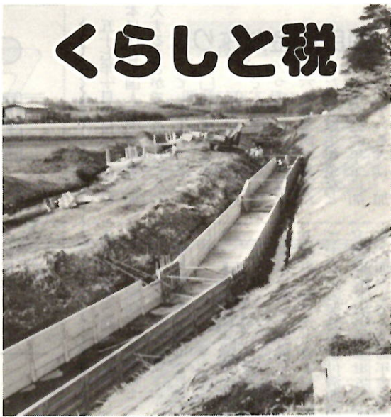
ほ場整備事業 荒子町で