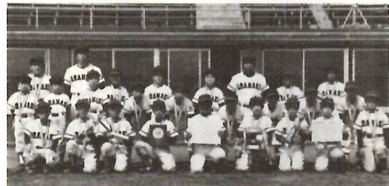
準優勝した荒牧町少年野球クラブのみなさん

いよいよテニスのシーズン到来。すばらしいコートでプレーしてみませんか。総合運動公園テニスコート（荒川町）は、今月から十月末までの間、早朝（午前6時～9時）や夜間（午後5時～9時）も利用できます。お問い合わせは同所 ☎911へ。