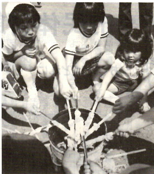
イベントがいっぱいの「つどい」 昨年

五月五日の「こどもの日」は中央児童遊園の開園三十周年を記念して、この日に利用券を百円以上お買い上げの先着二千人の子供さんに、お祝い品を贈呈