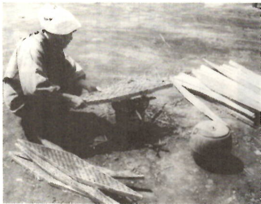
毛羽焼きの残り火には特にご注意

今年も春蚕の時期を迎えました。養蚕農家ではこの時期多量に火の始末がおろそかになり、大