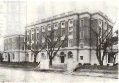
建築当時の群馬会館

建設費用は総額五十四万円、県費や商品陳列所の売却代金と多大な寄付によって賄われた。ルネサンス様式の鉄筋コンクリート造り、地上四階、地下一階の建物の延床面積は千二百七十五坪(四千二百四平方)の広さを持ち、県内初の公会堂と