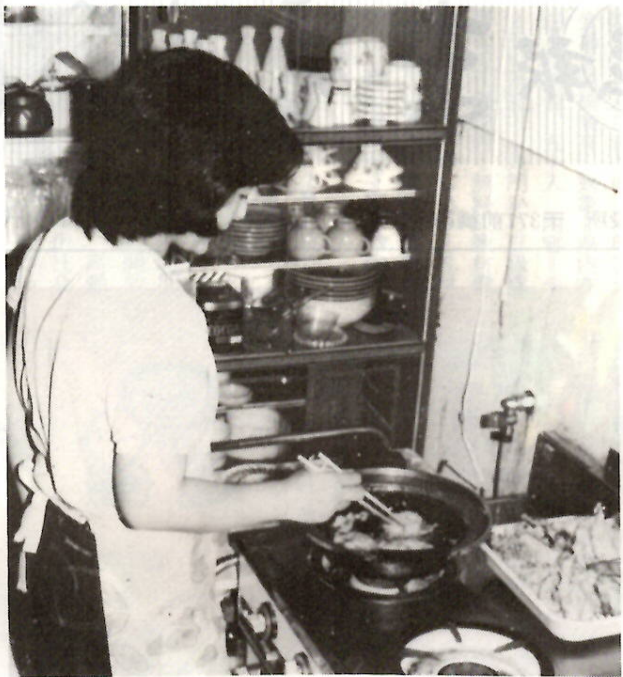
揚げ物料理を始めたら特に油断は禁物です

最近では冷凍食品の普及などで、食生活の変化とともに天ぷらやフライなどの揚げ物料理の機会が多くなっています。それに伴って「天ぷら油火災」が増えています。全国の揚げ物の火災発生件数は、住宅火災の約一割を占めるようになりました。市内の最近の天ぷら油火災は、下新田町と上佐鳥町で発生しています。大切な家を守るため、特に注意してください。