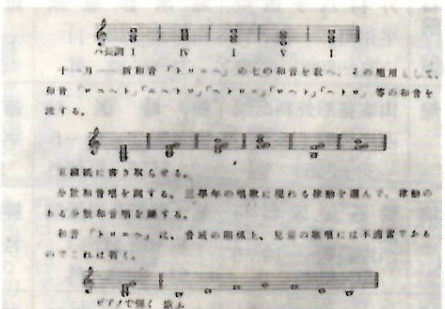
イロハ音名法による和音の指導説明

反骨 井上武士 国民学校の教科書が作られる少し前から、音楽関係者の一部に、後に音楽教育論といわれる運動が起こってきた。ドイツ音名唱法はその一環である。これは、現在行われている音名や音階の「ドレミ唱法」でなく、ドイツ語の音名で、例えば、ツェー・エー・ゲーと歌う方法である。なぜか軍部がそれを支持するようになり、軍当局は、国民学校での採用を教科書編纂委員会に強く迫ってきた。