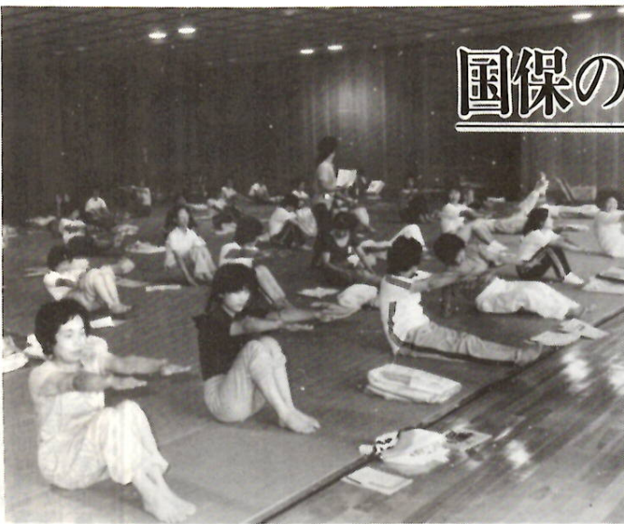
ヨーガ教室で健康づくりをする主婦のみなさん

六月定例会市議会で「前橋市国民健康保険条例」と「前橋市高齡重度障害者医療費の助成に関する条例」の一部改正案が可決、成立しました。 今回の改正は、地方税法など関係法令の一部改正に伴うものです。国民健康保険税率は、五十八年度に引き続き据え置き、被保険者の負担の増加をできるだけ押さえることにしました。高齡重度障害者医療費は助成対象者が拡大されました。 改正の内容は、次のとおりです。