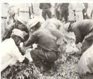
東上野町地内桃木川竹橋で

☆ 七月三日、消防隊員ら約三百五十人が参加して実施。今年から婦人会による炊き出し訓練や小学生の見学が加わりました。