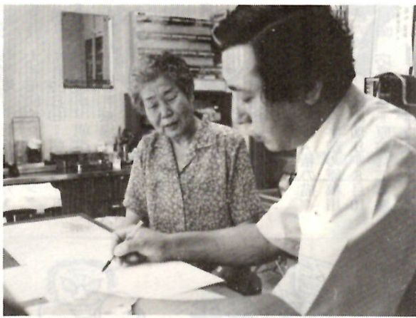
自覚症状が無くても年1回は受診しましょう

かハガキで申し込んでください。電話の場合は内線3264・3267へ。ハガキの場合は、住所・氏名・生年月日・希望検診日・会場・電話番号を明記して保健衛生課あてに。 〔胃がん〕7月21日(土)メデイカルセンター 7月25日(木)医療センター 8月8日(水)南極公民館 8月18日(土)メデイカルセンター 8月センター 午前9時 民館 ＜子宮、乳腺＞ 7月19日(木)広瀬センター 7月23日(木)7月26日(木) 8月9日(木)医療センター 8月23日(木)医療センター