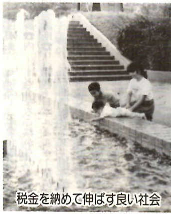
税金を納めて伸ばす良い社会

滞納処分を厳しく行います。 ○徴収を猶予 納税者が病気、失業、倒産などで、納期限内に納税ができない場合は、事情をご連絡ください。実態を調査し、一定の条件に該当する時は、分割納付などにより徴収を猶予します。 ○詳しいことは収税課内線3231へ。