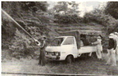
蛇穴山古墳での薬剤散布作業