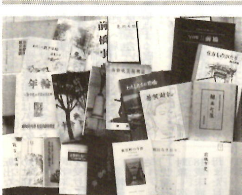
空襲の記録が収められている本や小冊子

八月五日、終戦直前の三十九年前、前橋市が米軍の大空襲を受けた日です。空襲でいまだ、平和と繁栄の中で、改めて戦争の恐ろしい災禍の大きさを問い直すことは、極めて意義深いものと思われまふ。 最近、前橋の空襲を始め、戦争中のさまざまな市民の体験を文章につづったものが、印刷物