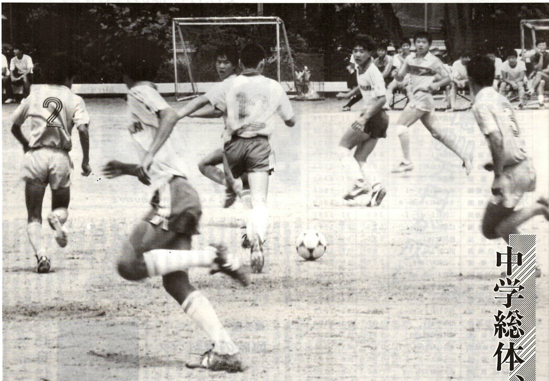
延長、再延長の末、PKで桂萱中が鎌倉中を押さえて優勝。両者力を出しきった好試合でした。24日、5中で。

発行・前橋市役所 〒371前橋市大手町二丁目12-1・電話24局1111(大代表)／編集・総務企画部広聴文書課／毎月1日・15日