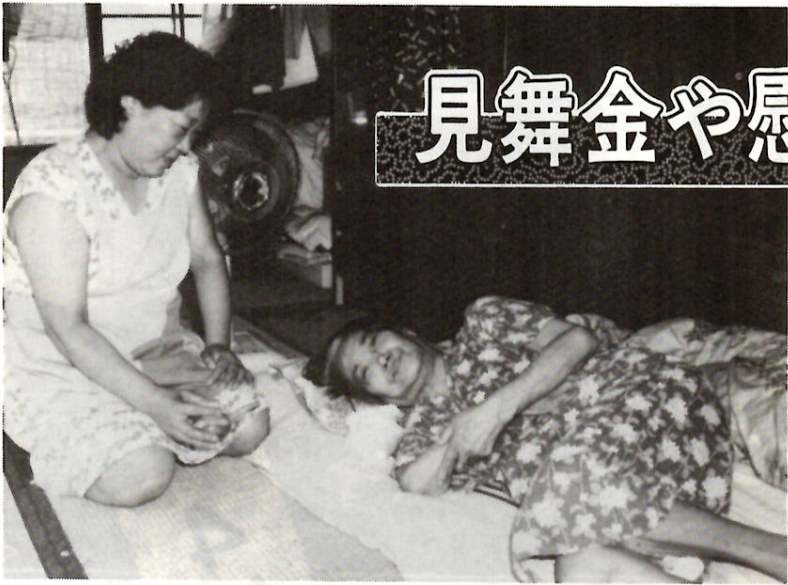
「今日の具合は？」 何よりも心強い家族との触れ合い