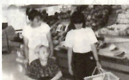
買い物介助の実習

七夕まつりに70万人 エリマキトカゲ、イグルサムなどおなじみの人気者も登場。華やかな彩りの下、季節感あふれるにぎわいでした。