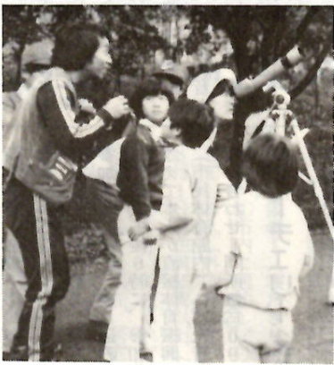
珍しい野鳥を探して

高校生を持つ家庭は、わが子が本人任せにできる状態にあるかどうかをしっかりと見極める必要がありそうです。そして適切な指導の手を加えなければならぬというところを知っていただく。