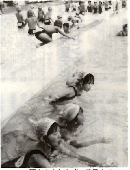
この夏うまく泳ぐぞ 清里小で

期日 第一回 9月15日(土)・16日(日) 第二回 10月6日(土)・7日(日) 泊二日 会場 国立赤城青年の家 対象 高校生以上の青年七十人 内容 テニスの技能研修や交流会 参加費 第一回 三千円 第二回 二千五百七十円 申し込み 第一回 9月10日(土) 第二回 9月20日(土) 市民体育館 内線 0900。無料