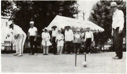
ゲートを通過 / 古市町一丁目滝川公園