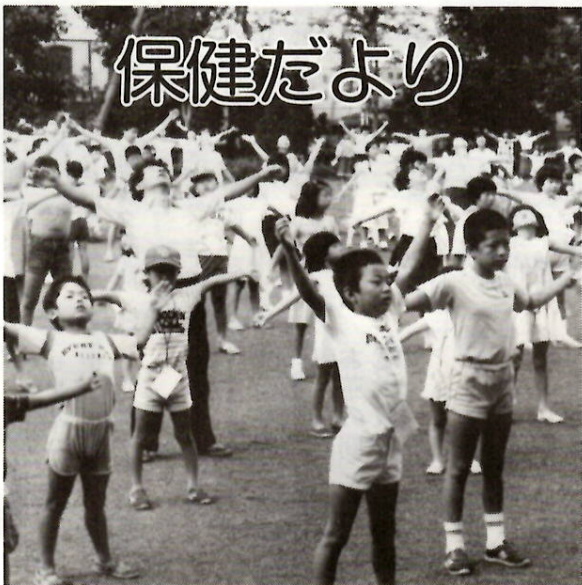
夏休みラジオ体操 下細井町で