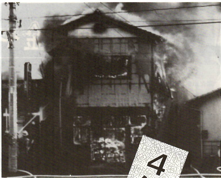
住宅火災 西片貝町で

□火災件数 燃えた建物の棟は百二十一棟で前年同期より十四棟増えています。内訳は全焼が三十八棟、半焼が九棟、部分焼が七十四棟でした。 □損害額 損害額は約四億八千二百万円