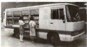
新しい移動図書館車「ひろせ号」とともに活躍する「いずみ号」が、期待にこたえて新車に。従来の倍二千五百冊を積載する最新鋭車で

市民のみなさんから五千人の方々に七月下旬、市民アンケートの回答をお願いしております。対象となつた方は、いわば市民の代表