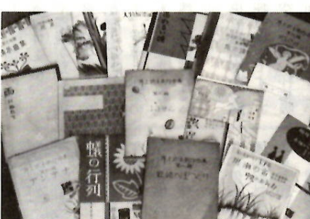
武士が作曲した歌曲の楽譜

音楽の教科書や学習指導要領の編集に参加した。相変わらずの多忙の中で、作曲のべんきよう」