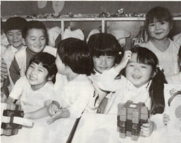
よい環境の中、みんな元気で明るくのびのびと

幼稚園は、幼児を保育し、適当な環境を与えて、その心身の発達を助長することを目的としています。