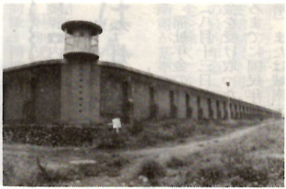
特徴あるレンガの外壁

の信仰の様式が、期せずして前橋の街にも存在しているのです。期せずして、と書いたのはどうもこの外壁はロマネスク様式を意図して築かれたのではなく、レンガの材質感や機能性に徹した造りが、様式としてはロマネスクに分類できるといふことです。ちよつと近づきすぎた、神秘的で重厚な感じのする前橋刑務所の外壁の印象は、写真集などで見るヨーロッパの中世の教会や修道院の壁面に非常に良く似ています。この前橋刑務所は、