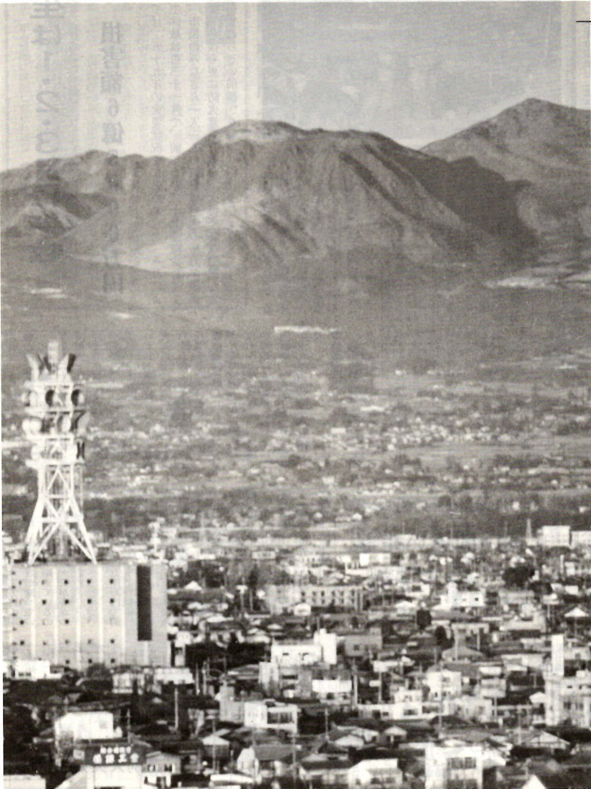
30分ほどの間に、影の部分は刻々と変化を見せます。1月24日午後4時30分、市役所12階から。