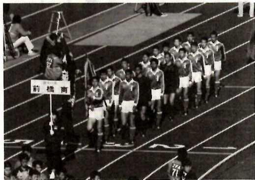
晴れの開会式で堂々の入場行進

一月一日、晴天の国立競技場に全国の予選を勝ち抜いた四十八代表が集まり、第六十三回全国高校サッカー選手権大会が開幕。われわれ前橋サッカー部も県代表として出場しました。一回戦は山口高校と対戦、守勢に回りながらも2-0と快勝しました。続く二回戦の相手は愛知県刈谷高校。先取点を奪われたものの後半開始早々に同点に、以降再三刈谷ゴールに迫りましたが、PK合戦の末7-6で勝利をつかむことができた。ついに念願の帝京高