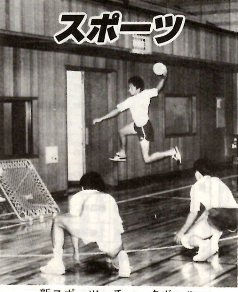
新スポーツ・チュックボール