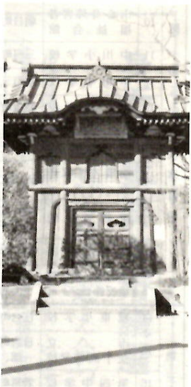
屋根の権現造りに唐様建築の特色も

唐門ともいう。材は八本の柱が二階まで通しのケヤキ材を用い、正面一階の柱には三個のほぞ穴があり、横木が組み込まれている構造がわかる。