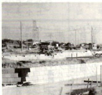
住宅団地側の石積工事

前橋工業団地造成組合による芳賀地区の団地造成事業は、北部住宅団地(高花台)と西部工業団地が既に完了し、引き続き五十七年度から東部団地の造成工事に着手、年次計画に基づいて順調に工事が進んでいます。 この団地は中央のメーン道路を挟んで、東側に二十五・五の工業用地、西側に十三の住宅用地を配置した総面積三十八・五の住工併設の団地です。各宅地は六・十の街路によって区画され、公園、緑地、上下水道、都市ガスなどの関連施設を整備して、優良な住宅・工業用地