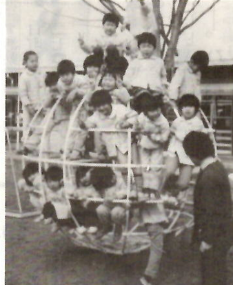
整った施設で元気いっぱい

納税は口座振替で 所得税の納税の期限は、申告期限と同じ三月十五日です。納税を口座振替で行うと便利です。お忙しい方や不在がちな方にはとくに便利です。全額を一時に納税することができない人は、延納制度をご利用ください。青色申告で経営の合理化と節税を図りましょう。