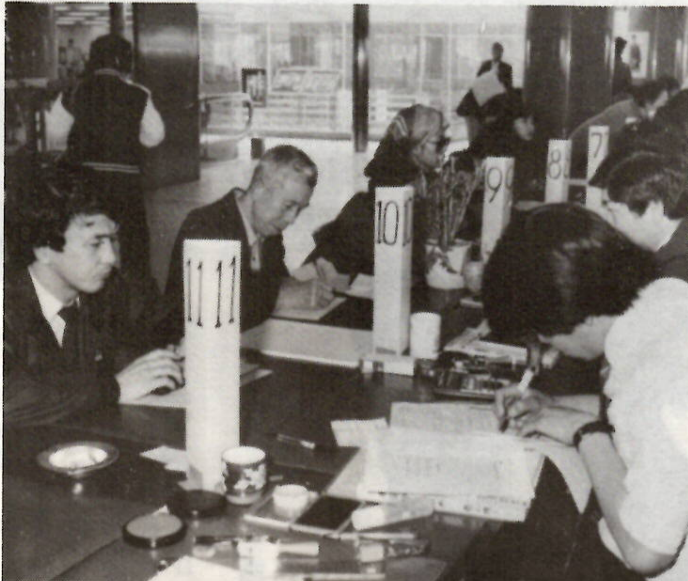
市役所2階の受付窓口 期限間近は込み合います

●確定申告の必要な人 事業所得や不動産所得などがある人 ①五十九年中の各種の所得金額の合計額から、各種の所得控除の合計額を差し引き、その金額を基として計算した税額が配当控除額よりも多い人。 ②給与所得のほかに各種の所得金額が二十万円を超える人。 ③二か所以上の給与などの支払者から給与を受けている場合で、年末調整をしなかった給与の収入金額と各種の所得金額の合計額が二十万円を超える人。 ④同族会社の役員やこの人と親族関係などにある人で、その同族会社から給与と所得のほかに店舗・工場などの賃貸料や貸付金の利子などの支払いを受けている人。 ⑤災害を受けたため、五十九年中の給与の源泉徴収額の徴収の猶予や、徴収された税金の還付を受けた人。 退職所得がある人 普通は申告する必要はありませんが、退職