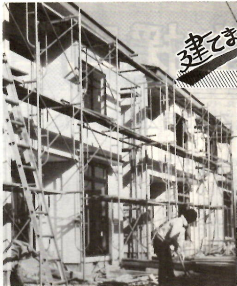
完成間近い前回分譲の芳賀団地現場