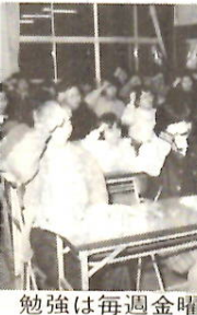
勉強は毎週金曜日の夜間

☆ 南橋公民館手話教室 参加者は親子連れも含む小二から六十代まで幅広い年齢層で三十六人。聴覚障害者も交じえて絶好の交流の機会です。