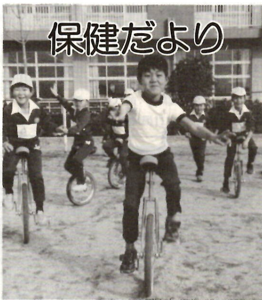
一輪車乗り 桃木小

がん、脳卒中、心臓病などの成人病は、社会的にも家庭的にも中心となる年齢層に多く発生します。また、自覚症状がないうちに忍びよってくるため、手遅れになることが多く、死亡者