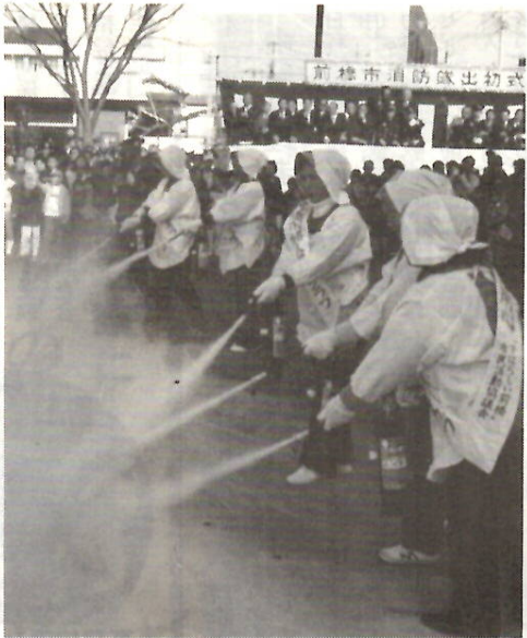
婦人防火クラブの初期消火訓練