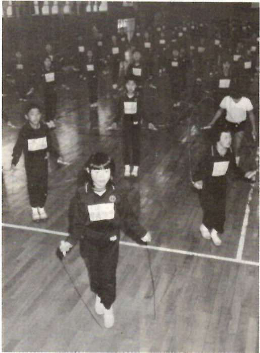
縄跳びマラソン 荒牧小で

経済的な理由で就学が困難な場合に、必要な学用品、通学用品、給食費、修学旅行費などの援助を行っています。基準に該当し受給を希望する人は、申請してください。ただし、生活保護受給者は教育扶助を受けているので対象となりません。 対象 生活保護法による生活扶助を受けている人に準ずる程度に困っている人で、教育委員会が認める人（必要保護者） 認定の基準 ①生活保護法に基づき保護が一時停止されている、または廃止になり、現在何の保護も受けていないに困っている ②市県民税、国民健康保険税、固定資産税、事業税、国民年金保険料などが、非課税、減免、