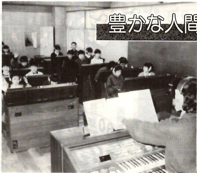
順次各校に設置される音楽学習装置 元総社北小で

学校教育関係では、魅力ある学校を創造するために、学校教育推進にあたって、重点として、教育課程の開発、編成、教育活動の創造的実践及び教職員の指導力向上に努めます。この具体的な主要施策として、授業改善、