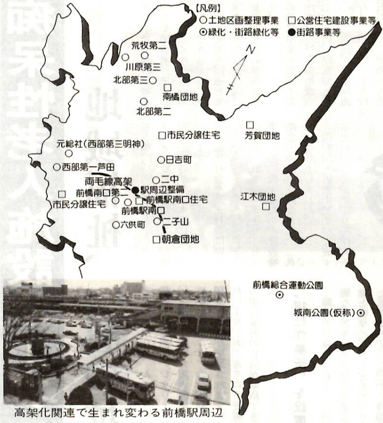
高架化関連で生まれ変わる前橋駅周辺