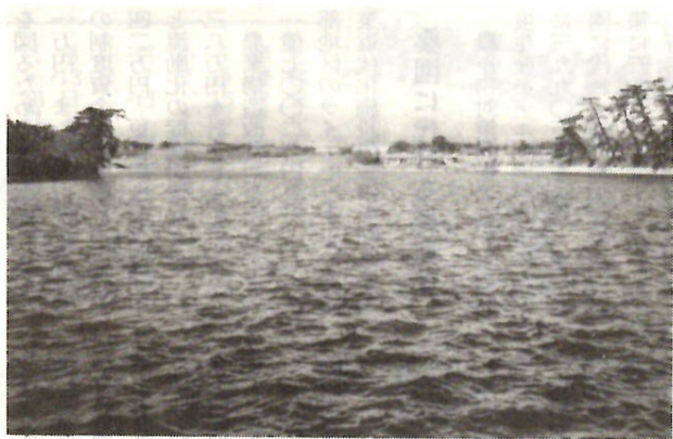
城南公園(仮称)の整備が始まる五料沼付近

消防施設費としては、一億三三六万円を計上。内訳は、複雑多様化する災害に対応するための防災工作車一台、消防ポンプ自動車三台(内消防団用二台、救急車一台、予防業務車一