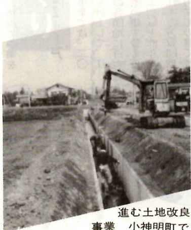
進む土地改良事業 小神明町で

わが国の農業は、総合的食料自給力の維持強化を基本として生産性の向上と需要に応じた農林水産物の安定供給を図ることが重要な課題となっています。 生産基盤の整備促進 本市でもこれを基調とし、豊かな村づくりを目指して、農業生産基盤の整備と共に近代化の促進、環境整備などを重点に本年度の諸施策を進めます。 農業委員会関係では、中核的自立経営農家を育成するための農業振興事業、農業後継者確保