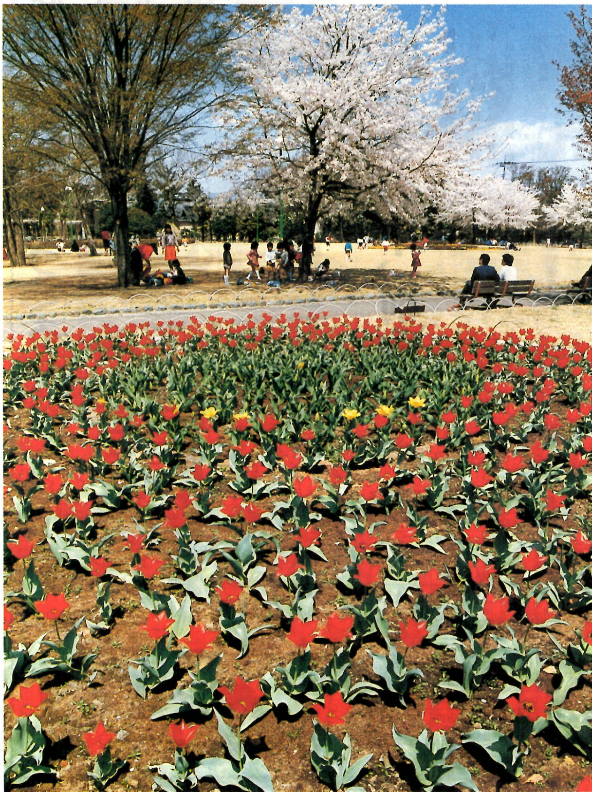
「春の前橋公園」田 寿夫(日吉町二丁目) 59年度前橋観光百景写真コンテスト入選作品

発行・前橋市役所 〒371前橋市大手町二丁目12-1・電話24局1111(大代表)／編集・総務企画部広聴文書課／毎月1日・15日