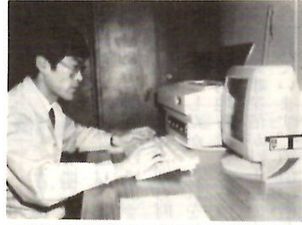
平常事務に不可欠なパソコン

市民を交通事故から守るための交通安全対策では、ガードレール、カーブミラー、道路照明灯などの交通安全施設工事費として、八四四四万円。更に、上毛電鉄踏切道保安設備整備費補助も計上されています。夜間の犯行を未然に防止するための防犯灯の新設補助と維持管理の助成金二二八万円。市税の賦課