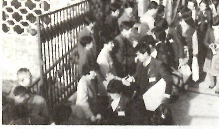
別れを惜しむ日中青年たち 無錫で

県主催の「日中青年親善交流事業」の本市の帰庁報告会が行われます。中国青年との交流、施設見学、観光などについて本市から参加した三人が発表をします。今年は国際青年年でもあります。将来この事業に参加し