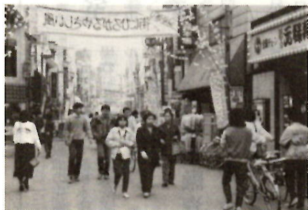
活気とにぎわいに満ちた商店街へ

また、今秋には、第三十七回中小企業団体全国大会が、本市、市民体育館を会場に催され、市内はもとより、県内産業経済界に対す