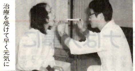
治療を受けて早く元気に

歳入では、各医療保険制度から拠出されたものが社会保険診療報酬支払基金を通じて交付される、支払基金交付金が五二億一九三三万円、国庫支出金が四億八七二〇万円、県支出金が三億七三三三万円、市の一般会計からの繰入金金が四億〇八九五万円となっています。