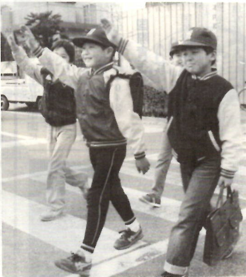
横断歩道はしっかりと手を上げて

子供を守る5つのしつけ ①左右の安全を確認させる ②信号を確実に守らせる ③歩道や道路の右側を歩かせる ④交差点の角で一度止まらせる ⑤ドライバーの死角に注意させる