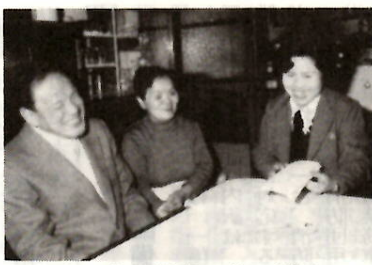
きょうは読書のサービス

桑園に代わる振興策 農作物対策関係では、果樹高度生産モデル団地設置事業などに三九〇万円を計上、また桑園に代わる畑作物の作付振興対策に五〇万円を計上しました。 畜産関係では、飼料作物の自