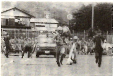
消防団のポンプ操作大会

目指して一四億七一八九万円を計上しました。 主な計画事業には、公園緑地、街路樹グリーンベルトなどの計画的な整備と日常の維持管理事業があり、また、総合運動公園整備事業では、野球場建設が三年計画の二年目、本年度中オープンが多目的広場の建設があります。 本年度の新規事業としては、市民アンケートなどにも多くの市民要望のある、大規模公園の一つとして東大室町にある五料沼を中心とした四十を仮称城南公園として整備に着手する計画です。生活環境の文化レベルを言い表す指標の一つに市民一人当たり公園面積数値があります。が、本市の場合、四月現在約六・八平方メートルで全国平均をかなり上回っています。