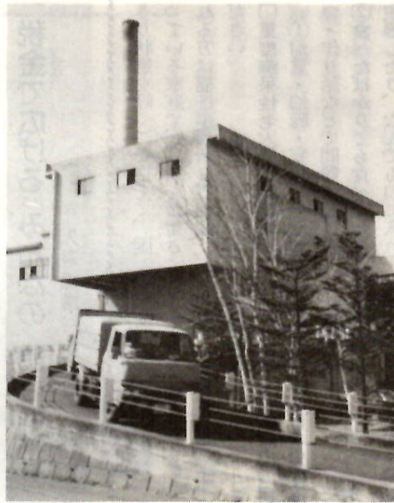
毎日大量のゴミを処理する清掃工場

衛生費関係は一九億〇八一八万円を計上しました。下水道事業合計負担金、同補助金が一六億五九七七万円を大部分を占めています。 そ族（ネズミ）昆虫駆除事業は、消毒用や衛生害虫駆除薬品、消毒用機器を購入して防疫活動に備えます。畜犬対策事業では、狂犬病予防接種を、野犬対策としては、不用犬、不用猫の引き