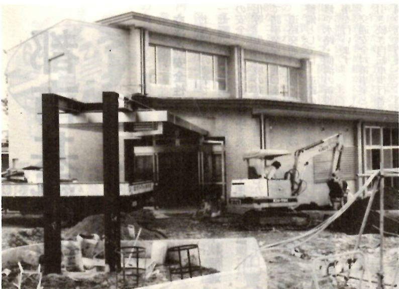
江木町内に完成間近い痴呆性老人専門施設「やすらぎ園」