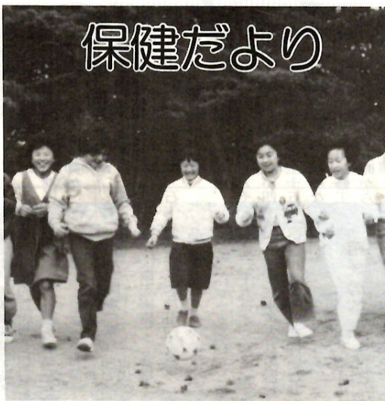
サッカー遊び 敷島公園

日程：4月17日(水) 映画と医師による講話(4月24日(水) 栄養士による調理指導と試食、二日間)