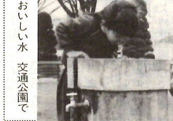
おいしい水 交通公園で