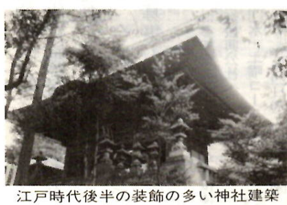
江戸時代後半の装飾の多い神社建築

正面には唐破風を付ける。出の深い軒（二軒）は、三手先斗拱（みてきさきとぎょう）で支える。