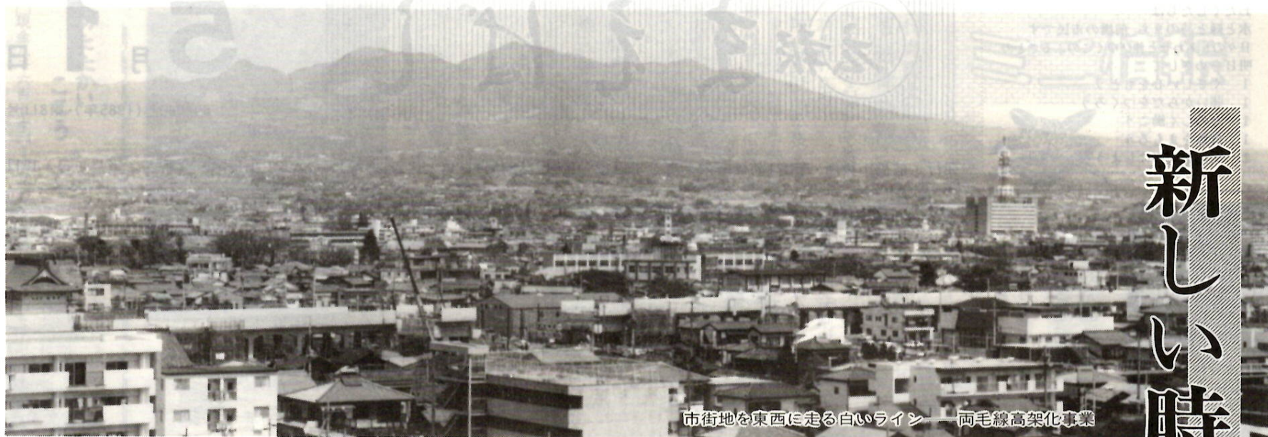
市街地を東西に走る白いライン 両毛線高架化事業