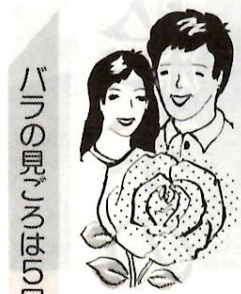
バラの見ごろは5月20日～6月10日

四月十五日、江木町に落成した痴呆（ちほう）性老人専門施設。既に三十人ほどが入所し、日常業務がスタートしました。