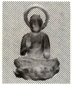
円満寺薬師如来坐像

■新指定物件 《妙安寺関係》一谷山記録八冊、妙安寺筆録（最頂院成實筆）一巻、妙安寺古系図一巻、一谷山最頂院妙安寺縁起上・下冊、満寺薬師如来坐像 ■二巻、唯信抄（伝親鸞筆）一冊、唯信抄文意（伝成実筆）一冊、葵紋幕付本多佐渡守正信奉書一冊、二張二通、親鸞寿像遷座関係書状二十八通、絹本着色蓮如上人像一幅、円満寺関係、円満寺薬師如来坐像一、円満寺石造阿弥陀三尊坐像一、円満寺関係、旧関根家住宅一棟