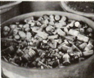
西部清掃事務所で

ひとまず家庭での保管をお願いしていた簡型の回収を四月から行っています。不燃ゴミ回収日に分別して出してください。