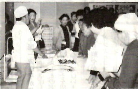
人気の魚料理実演 昨年

今、消費者を取り巻くいろいろな問題について、みんなで考えようという開催するものです。みなさんお誘い合わせでお出かけください。 日時 10月17日(木)～19日(土)、午前10時～午後4時(19日は午後3時まで) 会場 中央公民館 コーナー①②③④⑤⑥ ①食生活にひと工夫②暮らしと省エネ③暮らしと防災④暮らしの再考⑤ヘルステック⑥ご注意！悪質詐欺の特設コーナー ○お問い合わせは商政課 内線3606へ。