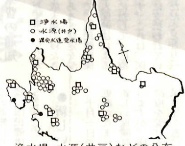
浄水場、水源(井戸)などの分布

本格的な戦災復興事業がスタートし、市街地は大胆なデザイン都市計画が打ち立てられ、推進された。水道もそれに伴って拡充が必要だった。第一次拡張計画は、三十一年