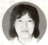
「広報まえばし」9月15日号の「お年寄り」のコーナー

「広報まえばし」9月15日号の「お年寄り」のコーナーのボランティア活動をした 味を持つて読みました。地域によつてはさまざまな老人福祉制度がありますが、私たちは「お年寄り」ということを頭に置いて、今から積極的にボランティア活動をした 市では五十一年度から社