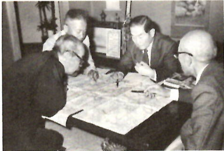
念入りの事前の打ち合わせ

今年の見学コースは、 町民から一番希望の多 かった妻籠宿を中心 に信州を回るコースで 二十七日・二十八日の