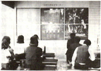
郷土を映すマルチスクリーン

群大、高崎音楽短大の学生たちが音楽学習の一環として団体鑑賞したことも特筆されます。管絃では催馬楽(さいばら)や越殿(えてん)楽、舞楽では萬歳楽などが演じられ、格調高い古式の世界にいざなわれました。