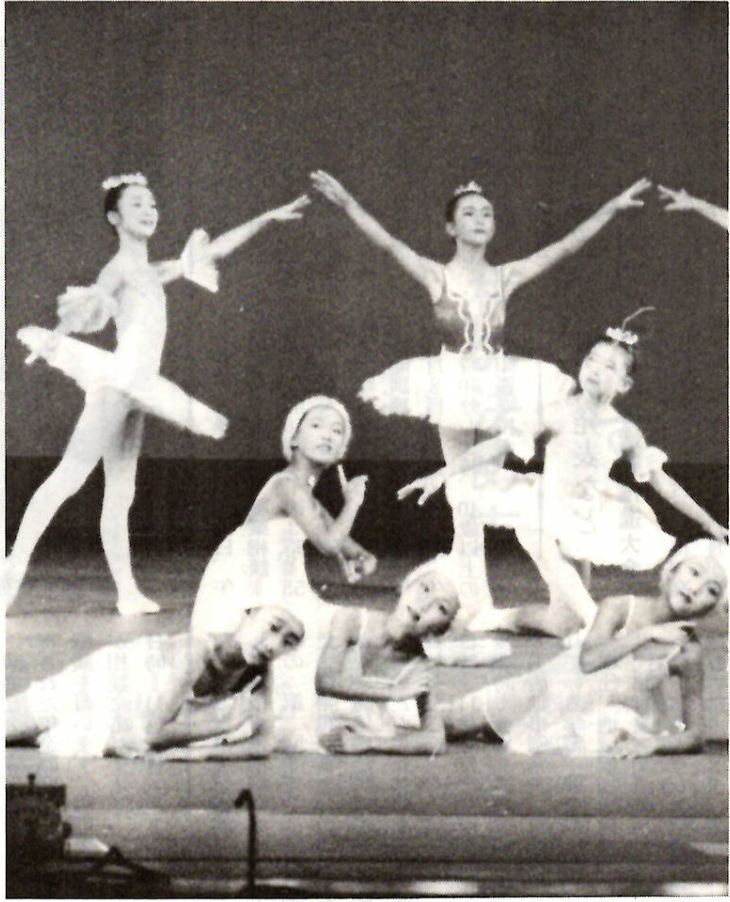
ステージに躍動 市民芸術文化祭バレエフェスティバル