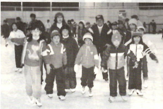
ほらもう滑れるようになったよ 昨年

期間 61年1月〜3月 コース 定員・時間・参加費 表のと おり 会場 温水プール・トレ ーニングセンター 対象 市内在