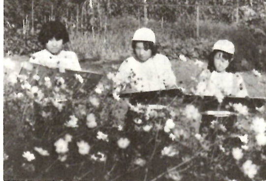
だれの秋が一番ステキかな——？10月24日、芳賀小の写生大会です。豆画家たちが、秋空の下、思い思いの場所で得意の筆を競い合いました。

エアコンは、外気温の変化に応じて、ダイヤルを手まめに調整してお使いください。 暖房の時は、適当な湿度を保つため加湿をしましょう。乾燥すると温度計の示す気温より低