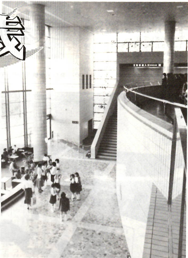
くつろぎと交流のスペース 大ホールホワイエ

私たちの心を豊かに広げる期待を担って、市民文化会館が開館して丸三年。その間に延べ百四十一万人を超える人々に利用されました。会館前の市民広場のケヤキがしっかりと根づいたと同じように、文化の殿堂は、私たちのまちに広く深く根を張りつつあります。新しい文化の時代が開かれたとも言えるこの三年間の歩みを、会館の主催事業を中心に振り返ってみました。