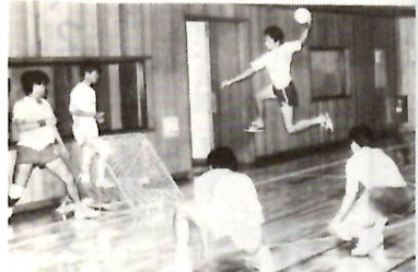
白熱するゴール前のプレー

日時 12月8日(日)午前9時 会 場 朝倉小体育館 対象 一般 十人以上十五人以下の男女別チ ーム 参加費 千円 申し込み み 11月8日(金)までに電話で体 育振興公社 0900へ 監