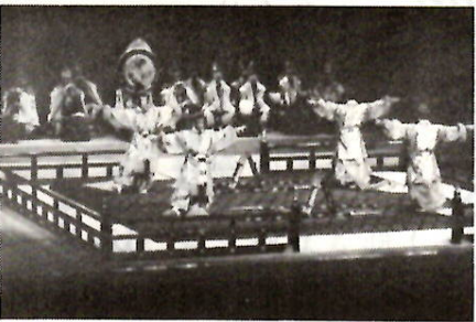
地方では珍しい宮中雅楽公演