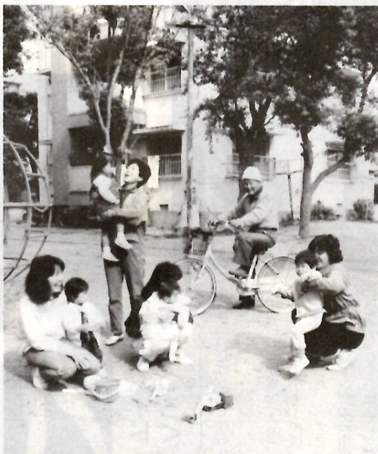
厚生年金加入者の奥さんなどが対象です

この現況届の受け付けを行いますので、指定された日または近くの受付場所へ届け出て下さい。 なお、勤務先で現況届の証明を受けた人は、郵送で届け出ることもできます。