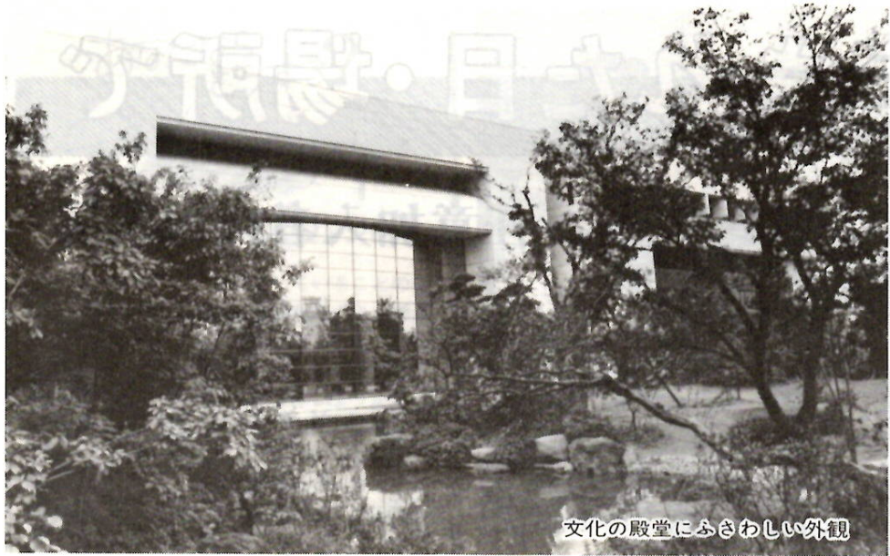
文化の殿堂にふさわしい外観