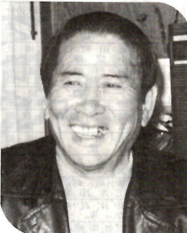
酒を断つ会の会長