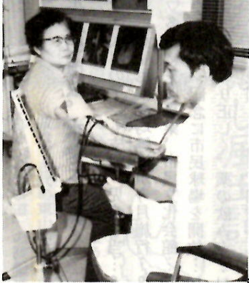
幸せな生活はまず健康から