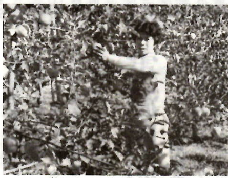
嶺町で嶺りんごの収穫

農業委員会関係では、農地流動化による自立経営農家育成のための農業振興対策事業、農業後継者確保のための農業就業改善推進事業、その他農地調整、農業者年金など