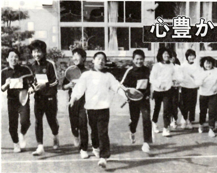
設備の整った校舎で健やかに育つ子供たち 四中で

また、全市民の協力を得て青 少年の健全育成と非行防止に努 めてきましたが、本年度は、更 にこれを進展させるため、相談 業務体制の充実などに努めます。