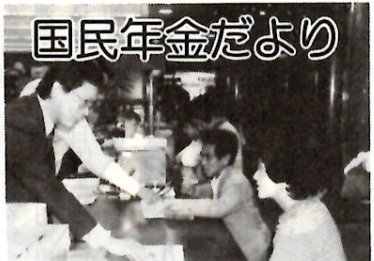
窓口ではいろいろな相談も