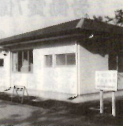
障害者の自立を促進

南橋・元総社の二団地に市営住宅(中層)の建設を計画しています。身体障害者世帯向け住宅として、南橋団地に二戸、元総社団地に二戸の合計四戸を予定しています。