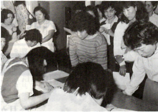
乳腺・甲状腺がん検診 広瀬コミュニティセンターで

股関節脱臼健診、七か月健診、一歳六か月健診を行います。また、各地区の母子保健推進員の協力により乳幼児の家庭を訪問し、各種健診や予防接種を受けるよう勧奨します。