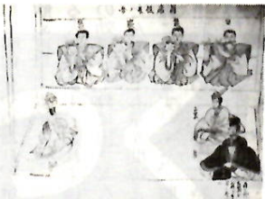
二之宮式三番叟の伝授書