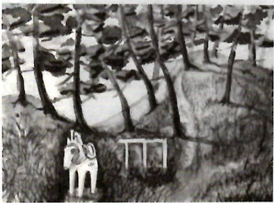
「八幡山公園」 高橋 直正 63 (朝倉町三丁目)