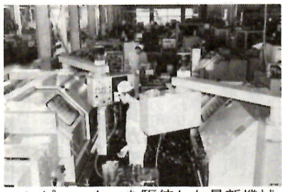
コンピューターを駆使した最新機械

老人保健事業では、四十歳以上の人を受ける一般健康診査とわが健康診査をはじめ、健康手帳の交付、健康教育、健康相談、機能訓練、訪問指導の諸事業を行います。