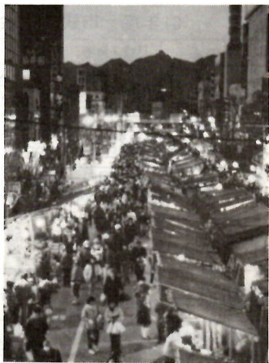
推薦「薄暮の初市」 石川久雄さんの作品