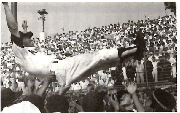
▲甲子園出場を決め みんなで監督を胸上げ