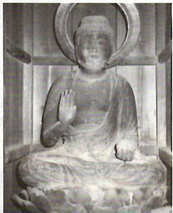
円満寺本尊の薬師如来坐像

かたどった頭髪を彫りだし、衣は右肩をぬき胸を広く開けてゆつたりとひざにかかる。印相(いんそう)は右手を挙げ五指を伸ばした施無畏印(せむいゐん)