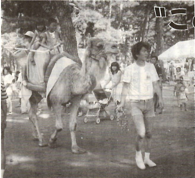
夏休みも終盤、ビッグイベントで思い出づくり

恒例のホリデーイン前橋も今年で十二回目。今回は「このゆびとまれ」を合い言葉に、市民の手作りのお祭りとして開催します。親子で、友達と一結に有意義な一日を過ごしましょう。