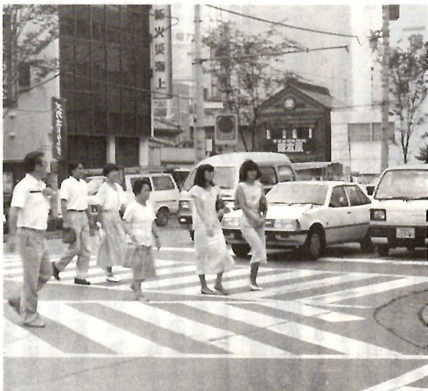
交通事故——まずあなたの町からなくしましょう

悲惨な交通事故をなくそうと家庭や職場、地域でそれぞれの取り組みがされています。自分の町から交通事故を追放しようという言葉を毎年、町自治会別無事故、無違反コンクールが実施されています。今年の中間集計がまとまりましたので、事故の少ない上位五十自治会を報告します。 このコンクールの期限は十二 月末日です。ここに挙げた自治会はもちろん、比較的違反や事故の多い自治会は、今後の事故防止に一層努力してください。 ○上位五十自治会（事故の少ない順） ①江木団地②千代田町四丁目③西善町④朝日が丘町⑤東上野町⑥下新田町東陽⑦緑が丘町⑧堤町北⑨江木町第二⑩端気町⑪光が丘町⑫石倉町北⑬山王町二丁目⑭橋島町⑮徳丸町⑯総社町総社大屋敷⑰総社町総社山王⑱朝倉町二丁目⑲表町二丁目⑳文京町三丁目㉑元総社町78⑳城東町四丁目㉒総社町植野立石㉓下新田町⑵昭和町三丁目⑶国領町二丁目⑷金丸町⑸大手町一丁目⑹紅雲町一丁目⑺総社町植野⑻下新田町南⑼西大室町⑽昭和町二丁目⑾鳥羽町東部⑿高花台一丁目⑿大手町二丁目⑿ 注 このコンクールは事故や違反の件数・程度と世帯数を考慮して順位を決めています。 ○お問い合わせは公害交通課 ☎内線3276へ。