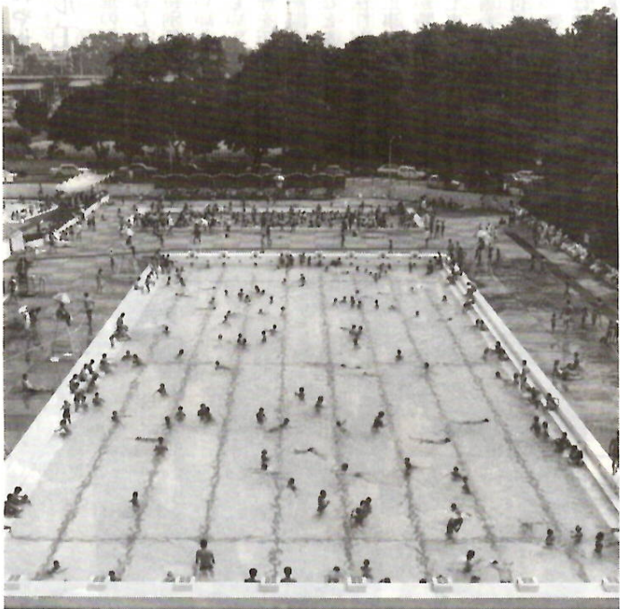
飛び込み台から見ると水槽で泳ぐ金魚のようです。夏の スポーツ施設の主役・市民プールには、涼を求める人たちが 集まります。8月10日までの入場者は延べ5万4,184人。