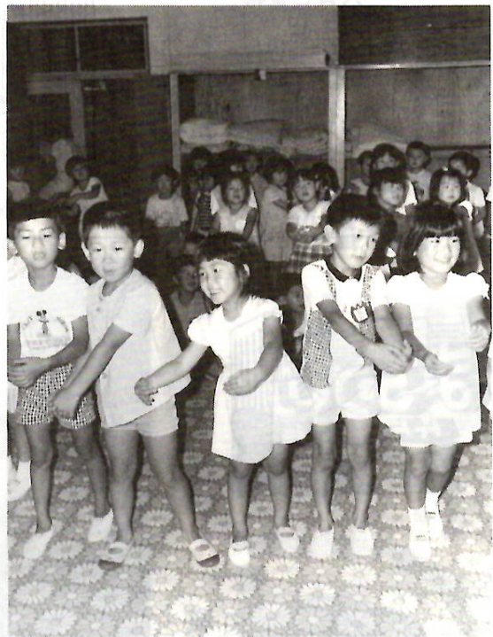
よい環境の中で明るく伸び伸びと

調査申請受付時に面接調査通 知書を渡します。この通知書に よって所定の日に保育所（園） で面接による調査を行います 入所児童の決定は62年1月中旬 保育料は61年分の所得課税額所 得税非課税の場合は61年度分の 市民税額を基準に決定。61年 度は国の徴収基準の約三年半遅 れの保育料として負担軽減を実 施。同一世帯で二人以上入所 （園）している場合は一人を除 き半額 給食は3歳未満児は完 全給食、3歳以上児は副食 問 い合わせは福祉事務所（内線3 149・3150または各保育 所（園）へ