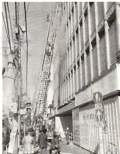
高層ビルで火災訓練