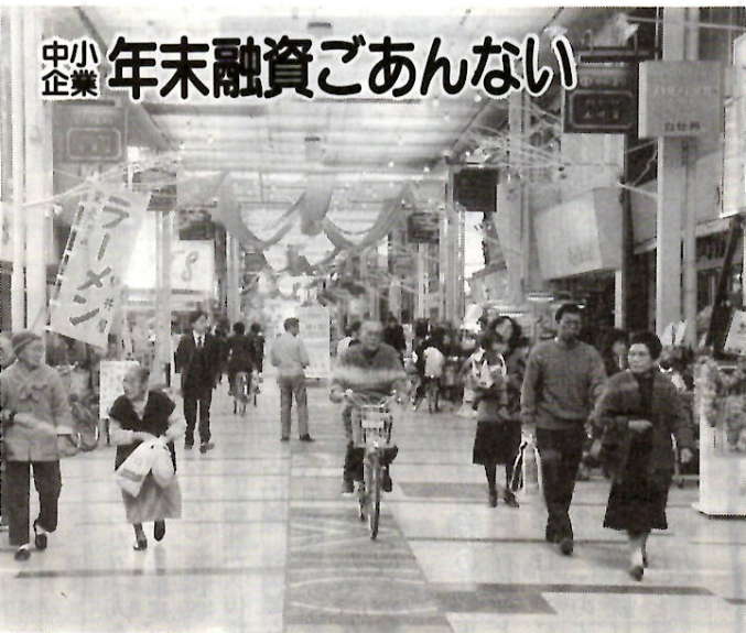
年の瀬を控えた中央ショッピング街

市内の中小企業（中小企業信用保証法に定める業種の運転・設備資金融資制度として、次の制度を取り扱っています。十二月八日から金利が引き下げられました。年末運転資金としてご利用ください。 □小口資金（運転・設備資金） 融資額は五百万円以内。期間は運転資金三年以内、設備資金五年以内。利率は年六・四％以内（ただし二年以内、分割償還は年五・七％以内。ほかに保証料年〇・二％以内）。 □中小企業経営振興資金（運転・設備資金） 融資額は七百万円以内。期間は運転資金三年以内、設備資金五年以内。利率は年六・六％以内（ただし二年以内、分割償還は年五・八％以内。ほかに保証料年〇・五％以内）。 ただし、次の資金使途のものは、市長特認として融資枠が拡大されます。 ▽第一種特認（運転・設備） 大型進出対策資金・市長が認める事業転換資金・運転資金一千万円以下、設備資金二千万円以下（ただし両資金合わせても二千万円以下。期間は運転資金五年以内、設備資金七年以内。利率は年六・六％以内（ほかに保証料年〇・五％以内）） ▽第二種特認（運転・設備） 商業施設出店資金・運転資金一千万円以下、設備資金二千万円以下（ただし両資金合わせても二千万円以下。期間は運転資金五年以内、設備資金七年以内。利率は年六・六％以内（ほかに保証料年〇・五％以内）） ▽第三種特認（設備） 工場建設資金・設備資金一千万円以下。期間は七年以内。利率は年六・六％以内（ほかに保証料年〇・五％以内） 申し込みは市内の群馬銀行、各地方銀行、各信用金庫、各信用組合または商工会議所へ。 □中小企業経営改善資金（運転・設備資金）