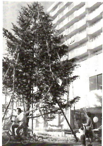
高さ十三メートル、幅八メートルのジャンボマツツリが出現。千代田町二丁目の国道17号沿いに飾られ、師走の街を彩っています。