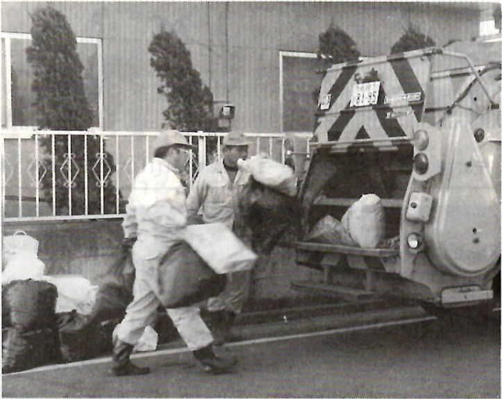
ルールを守って——決められた日に町内のゴミ集積所へ