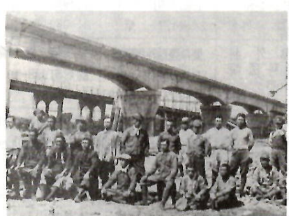
旧橋のすぐ北に建設が進む新橋

県は直ちに大渡橋の架け替えを計画した。経費はざっと三十万円と見込まれたが、もし支障がある場合には仮橋を架けることにした。 財源難か、支障があったのであろう。出来上がったのは仮橋だった。流失した部分に、残った橋脚を利用して木造の吊り橋を架けたのである。永久橋の工事が本格的に始まったのは昭和十五年秋だった。十六年に、盛岡にあった陸軍予備士官学校が榛名山山馬ヶ原に移転してくることになり、軍関係者の前橋からの最短ルート確保という要請があった。 軍部の出資額も大きかったと言われている。