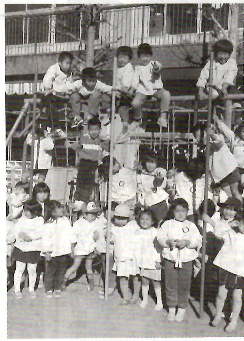
みんな元気いっぱい 第三保育所で

事業用資産のうち土地、家屋を除く償却資産の所有者（貸し付けている場合も含む）は、地方税法の規定によって毎年一月末日までに申告をしなければならなりません。市では限られた期間内に評価を完了しなければなりませんので、早めに申告をお願いしています。