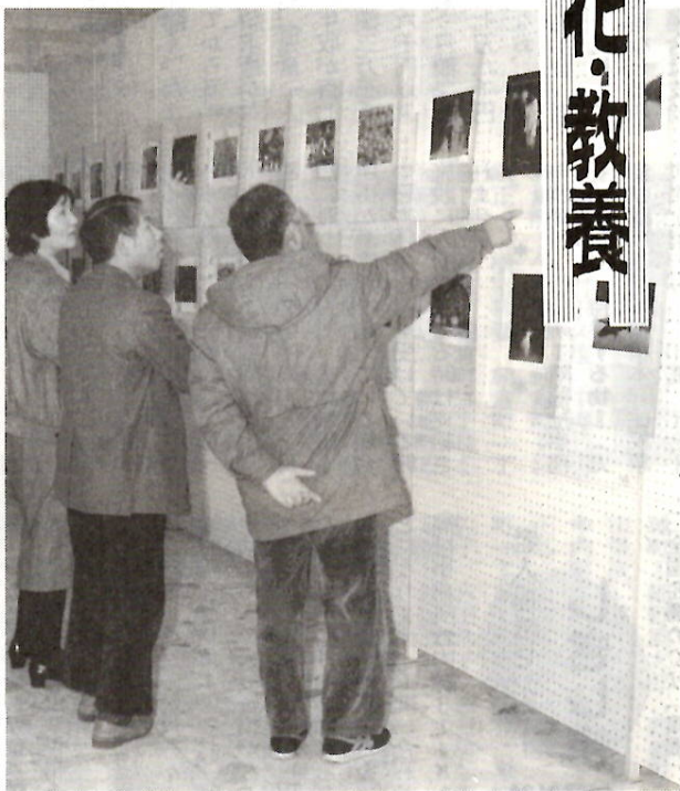
力作が並ぶ市民文化会館の展示会場 前回

市民芸術文化祭・第二十一回市民展覧会が、来年二月二十六日(木)から三月十三日(金)まで市民文化会館で開催されます。この作品を募集しますので、みなさん奮って応募ください。各部門とも出品点数の制限はありません。