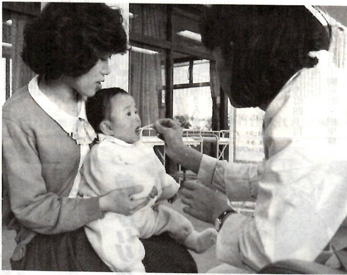
経口投与によるワクチンの接種

町一〜五丁目、下小出町、上小出町、三俣町一〜三丁目にある 浄化槽で六十年九月三十日以前 に設置手続きを行ったもの②六 十一年度に行った浄化槽放流水 の検査結果が基準を超えている もの③六十一年度の法定検査を 保留または拒否したもの。 料金は四千円で検査が終了す ると検査結果書が発行されます 乾電池は区別して 使用済み乾電池は、不燃ゴミ 収集日に、外のゴミと区別して 「乾電池」とはつきり書き、袋 に入れて出してください。 ○：お問い合わせは環境整備課 内線3273へ。