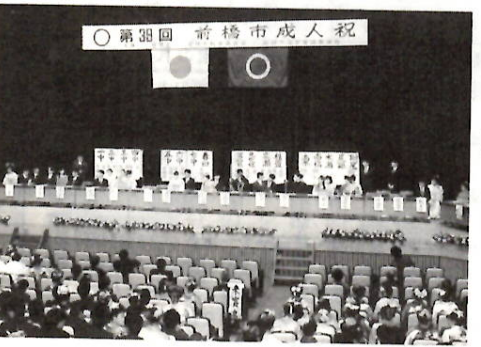
成人祝でクイズ大会(62年1月15日)