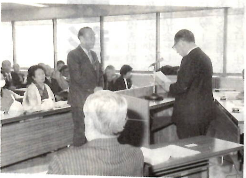
生涯学習奨励員を委嘱(12月10日)