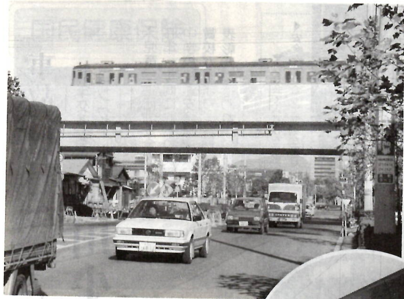
高架完成で踏切が解消(10月6日から)

1日 消防利根イレン設置 2日 3日 花の共進会 2日 20日 第一回定例市議会 3日 小中学校交通安全コンクール表彰式 7日 市民展・写真美術部門(13日まで)