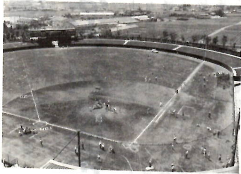
市民球場グラウンド開放(5月5日)