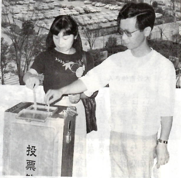
あなたの一票を県政に反映させましょう

四月十二日(日)は、県議会議員選挙の投票日。わたしたちの意志を県政に反映させるため、その代表を選ぶ大切な選挙です。棄権しないで必ず投票しましょう。