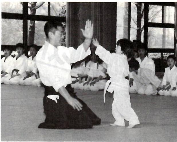
合気道、ほくもやってるヨ——毎週土・日は市民合気会の子供たちの練習日。5歳から中学生まで一緒に汗を流しています。(3月7日、市民体育館で)