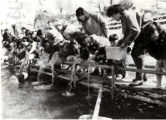
必ず戻ってきてね——親子連れなど1,850人がサケの稚魚8万匹を放流。映画「出発のとき」の撮影も。(8日、群馬大橋下で)