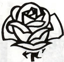
白バラは明るい選挙のシンボルマーク