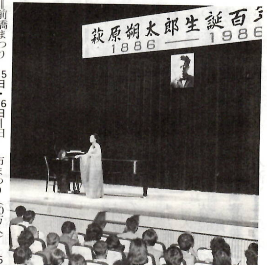
盛大に朔太郎生誕百年祭(10月5日)