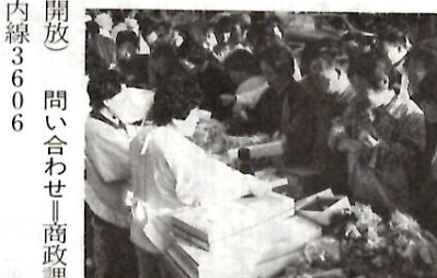
昨年の市民連合朝市

恒例の市民連合朝市(春季)を開きます。八十以上のお店が並び、野菜、果実、魚介類など新鮮でよい品を安価で販売します。気持ちいい朝のショッピングを楽しみましょう。 先着四百人の子供にプレゼント。古新聞、段ボールの買い上げ、包丁研ぎ、電気相談など特設コーナーもあります。 開催中は、会場の立川町通りが歩行者天国になります。 日時 5月31日(日)朝6時～8時 (雨天決行) 会場 立川町通り 販売品 生鮮食料品、日用品、雑貨品、生活用品、花木など 駐車場 弁天通り駐車場、中央駐車場(いずれも開催中は無料)