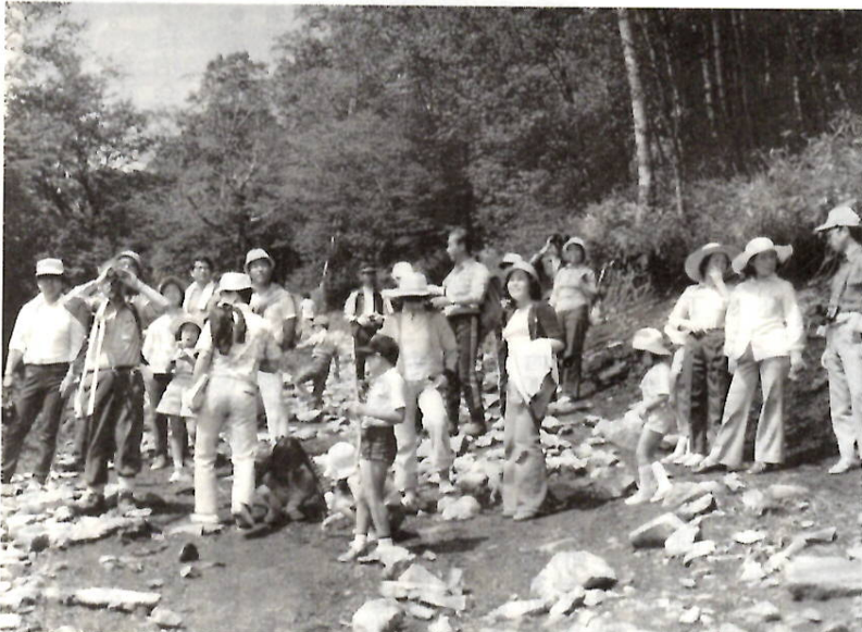
おいしい空気を吸って赤城山の鳥や植物を観察

新緑の美しい赤城山で自然観察会を行います。ご家族や友達で野鳥や植物に親しみましょう。 日時：6月6日(日) 午後3時に赤城少年自然の家集合(7日(日)泊二日) 対象：先着八十人(小学生以下は父母の付き添いが必要) 観察場所：地蔵岳、小沼、長七郎山、覚満湖、参加費(使用料、食事三食分、リフト代など)：大人二千三百円、未成年二千二百円、中学生二千円、小学生以下千八百二十円