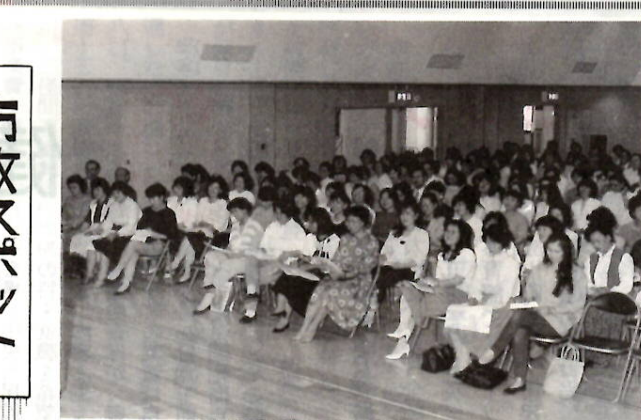
和やかに、PTA広報研修会

よりすばらしいPTA広報を作ろう——。7日に中央公民館で開かれた市PTA連合会の広報研修会には、各学校から広報部員ら 270人が参加。「親しまれる広報紙づくり」について和やかに学びました。