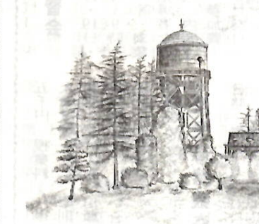
敷島浄水場 岩崎 正幾 33(広瀬町二丁目)