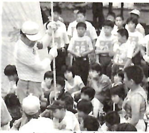
キャンプを楽しく

市と市子育連では、新しく子供会などの育成指導者になった人、また、既に初級程度の資格を有し、更に専門的な知識・技術を習得したい人を対象に、指導者講習会を開催します。 日時：〈初級〉6月5日～7月3日の間の毎週金曜合計五回、