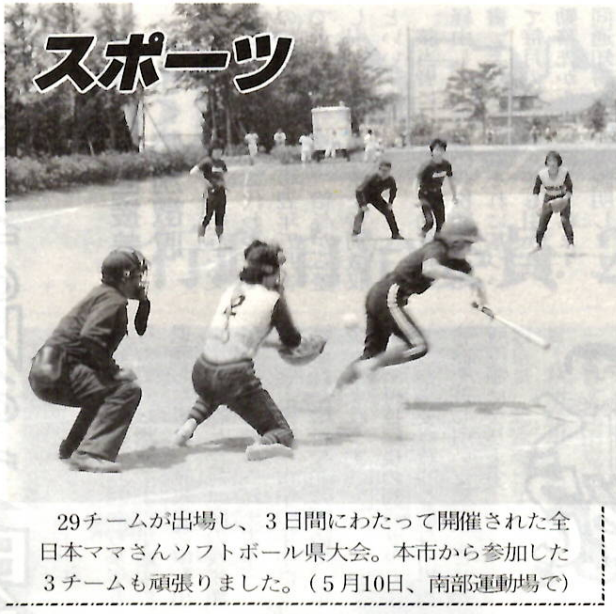
29チームが出場し、3日間にわたって開催された全日本ママさんソフトボール県大会。本市から参加した3チームも頑張りました。(5月10日、南部運動場で)

日時 6月12日(金)～7月17日(金) 毎週水曜合計十回(7月3日 除く)午後3時～4時 対 象 3歳児(幼稚園などの年少 組対象児)と保護者、二十組 参加費 一組二千元 申し込み 6月10日(水)午後3時に参加費を 添えて保護者が直接、定刻に 定員を超えた場合は抽選