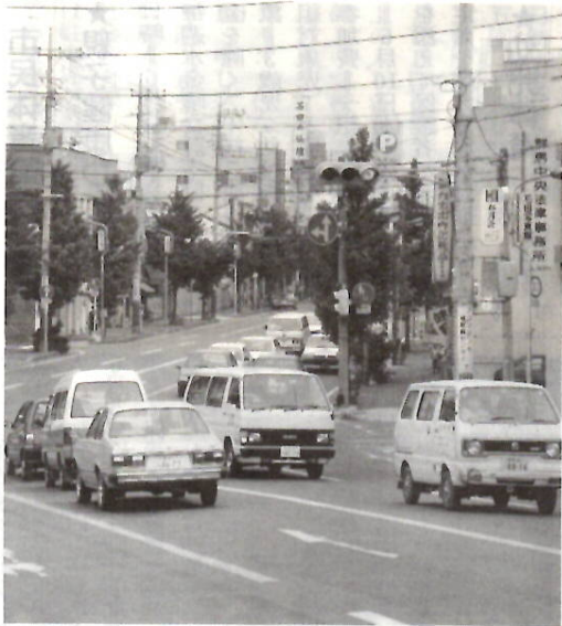
自動車税、軽自動車税の納期限は来月1日

給与から直接差し引く特別徴収 給与支払者が毎月の給与を支払う際に、納税者に代わってその年税額を六月から翌年五月まで十二回に分けて、給与から差し引いて納める方法を特別徴収といいます。 該当者には五月中に勤務先を経由して「特別徴収税額のお知らせ」を交付します。それに基づいて毎月の給料から差し引かれ、勤務先から市へ納入されます。同通知書の見方を説明します。 年税額と月割額 通知書の右側太線内は、六十二年度の特別徴