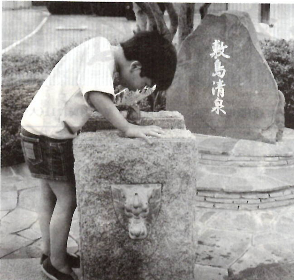
敷島浄水場にある清泉 5月3日の一般公開で

務職 申込期間：事務甲：6月15日(月)～26日(金)、事務乙・土木・保母：8月31日(月)～9月11日(金)、技能労働職：9月28日(月)～10月3日(土) 申込用紙・試験案内は人事課内線3502へ。