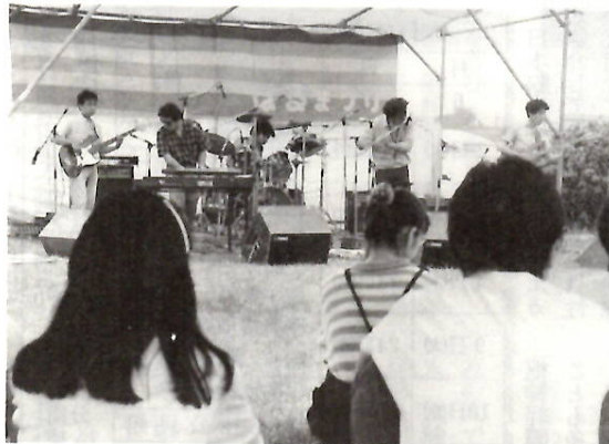
利根の河原にロックのリズム——3日に行われた「はるまつりフリーコンサート」。市内のアマチュアグループ13組が競演。