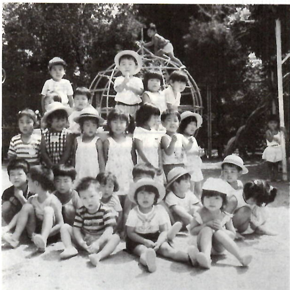
楽しい遊具やお友達がいっぱい

入園該当者3歳児59年4月 2歳児60年4月1日に生まれた人 4歳児58年4月2日〜59年4月1日に生まれた人 5歳児