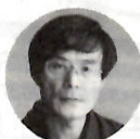
将棋棋士(九段) 米長 邦雄さん