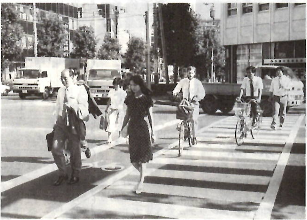
私たちの町から悲惨な交通事故をなくしましょう