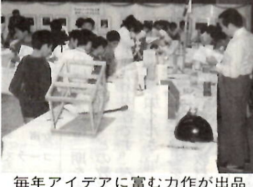
毎年アイデアに富む力作が出品

会期 9月13日(日)～15日(火)、午前9時～午後5時(15日(火)は午後3時まで) 会場 県民会館 対象 市内、勢多郡内(北橋・赤城・富士見・大胡・宮城・柏川)の在住・在勤者 応募要領 ①絵画：日本画・洋画、30号まで、額装(ガラス使用不可) 書道：漢字・かな・新傾向、本表装(仕上げ寸法：横(八三・二・七五)・縦(一・六二・五・三・五五)以内、縦・横いずれでも可、読み方を必ず付け、臨書は出典を明記、写真：白黒・カラー、四つ切り 題材 自由 搬入受付 9月9日(水)午前9時～午後8時、県民会館展示室 表彰 9月15日(火)午後2時から県民会館で、知事賞、市長賞、町村長賞、市議会議員賞ほか 問い合わせ 工業課 内線3615、前橋商工労働事務所 ③2744