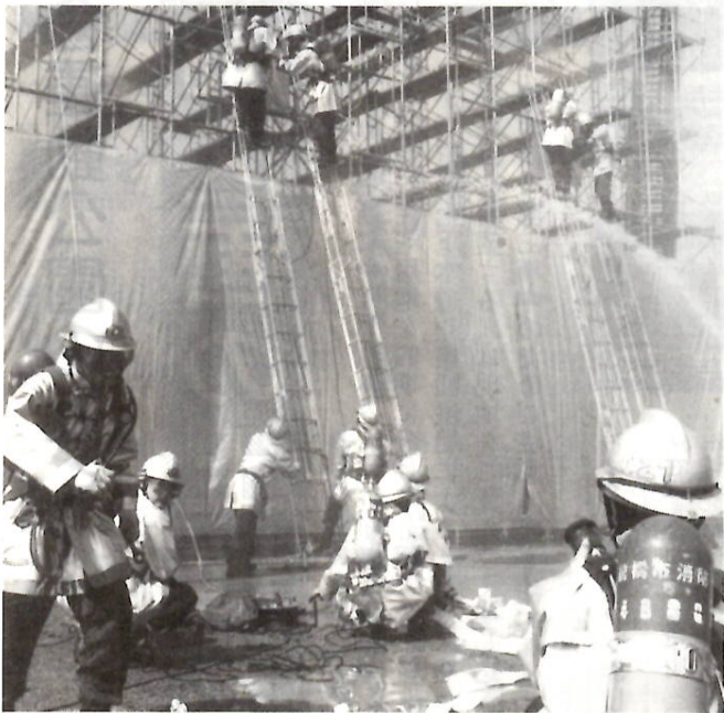
起ころは困る事なんです… (県防災総合訓練から)

十一月二十六日(木)から十二月二日(木)まで、全国一斉に秋の火災予防運動が実施されます。これからの季節は、暖房器具など火気を使う機会が多くなるため、ちょっとした油断が思わぬ大火となる危険があります。市民一人一人が防火意識の高揚を図り、火災を出さないよう十分注意しましょう。期間中は、市、消防本部、すばらしい前橋、市民活動協議会などが中心となり、この運動を進めます。