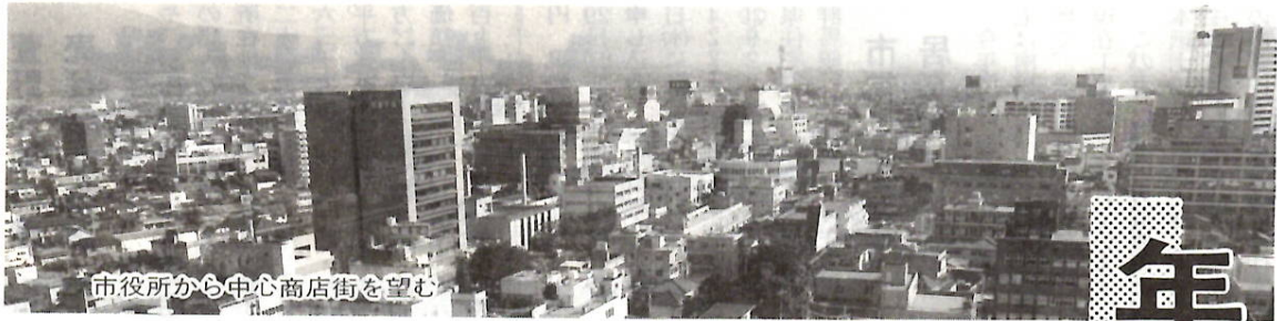
市役所から中心商店街を望む