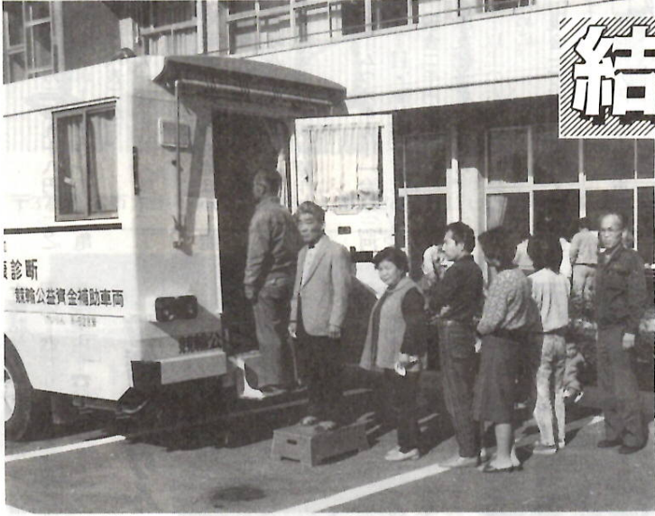
早期発見のために年に一度は結核住民検診 東公民館で

結核は個人や家族、ひいては社会に大きな損害を与える伝染病で、欧米諸国に比べ依然として高い死亡率を占めている病状です。そこで、みなさん一人一人が結核の恐ろしさを知り、正しい予防知識を身に付けることができるようにと、結核予防の標語と作文を募集します。奮って応募ください。