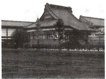
跡地は将来児童公園に

二中地区土地区画整理事業の一環として、この地域の住環境の向上と、遊びや休息の場としての公園などの確保を図るため、六十年から三年をかけて進めていた高峯院（朝日町二丁目）の墳墓への墓地移転が、今年五月に終わりました。