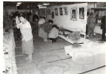
自慢の作品が会場いっぱい

会場を飾った作品は、手芸、書、写真、盆栽、彫刻、工芸品など約四百点。九月月上旬に回覧板で出品募集を行い、老人会や婦人会などの