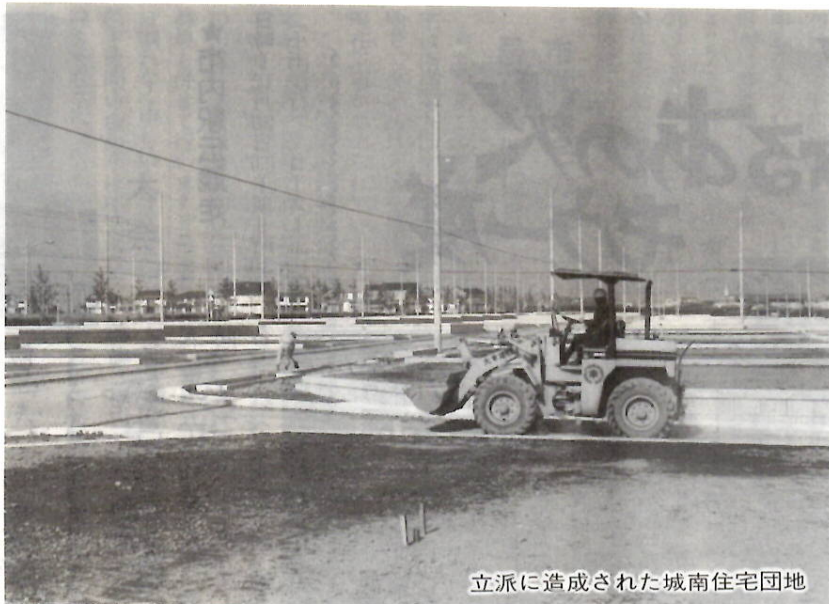
立派に造成された城南住宅団地

市の東部の環境に恵まれた場所にマイホームを——。前橋工業団地造成組合では、城南住宅団地の住宅用地を四期に分けて分譲。このうち第二期を分譲します。市の上下水道や集団供給によるLPガスを完備した百四十三区画。分譲を希望する人は現地をご覧のうえ申し込んでください。なお、現地は一部工事中のためご注意ください。