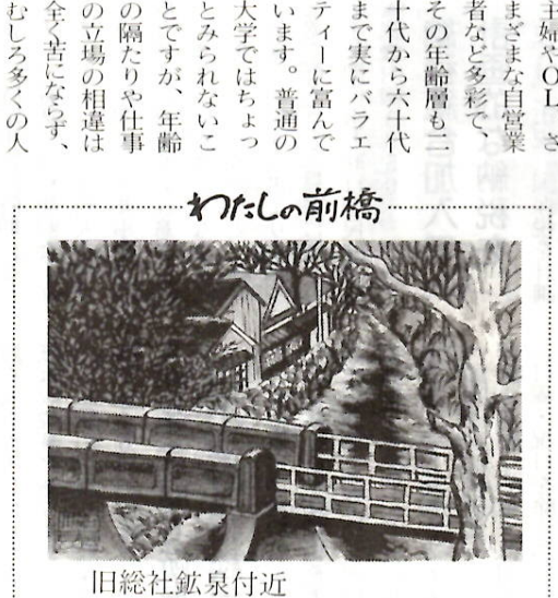
狩野 満恵 45 (総社町植野)

の隔たりや仕事 とですが、年齢 とみられないこ の立場の相違は 大学ではちょっ います。普通の