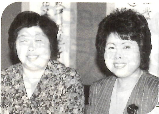
姉妹が皮革工芸で日中友好