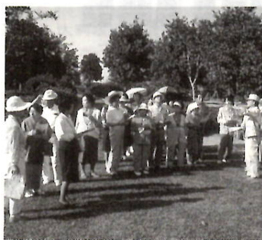
総合運動公園を見学する参加者

* * 次回以降の予定は次のとおりです。 第二回 7月27日(水) 親子対象(小3~小6) 募集は7月1日号で 第三回 10月5日(水) 一般対象、募集は9月15日号で 当市に転入した人や施設を見学したことのない人など、この機会に奮ってご参加ください。