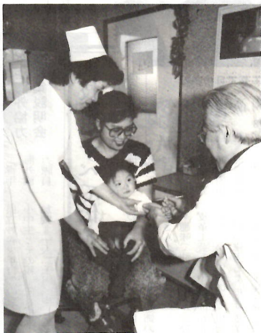
お済みですか 計画的に予防接種を