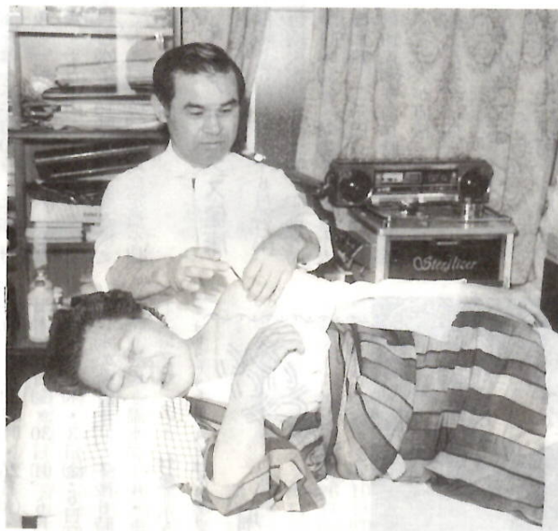
はり施術で健康維持——割引券を交付します

お年寄りの健康増進と身体障害者の生活安定を目的に、市視覚障害者福祉協会などの協力で「老人はりきりマッサー」サービス施設助成事業を実施します。割引券を交付します。割引券を交付します。割引券を交付します。