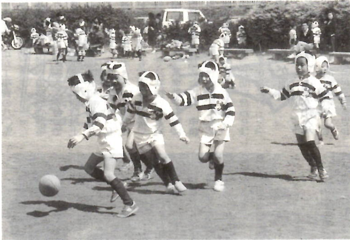
元気いっぱい！チビっ子ラガー——少年ラグビー教室には約150人の小中学生が参加。練習や試合を通じて、健全な精神と体力を養います。(先月24日、敷島河川敷ラグビー場で)

以上の会場は市民体育館、 申し込みは、市民体育館、 館内の体育振興公社 650 900へ。