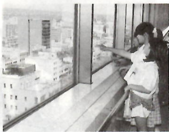
「あれが私たちの学校よ」

市役所12階市民ロビーを、 五月五日(木)に一般開放します。 「あれが私たちの学校よ」