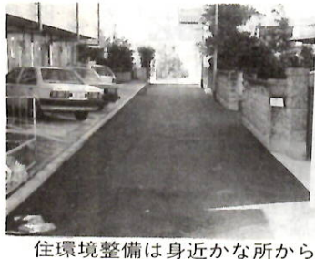
住環境整備は身近な所から

住環境整備事業の一環として、未整備の私道の舗装などを工事する場合、市が工事費の八〇％以内を補助します。