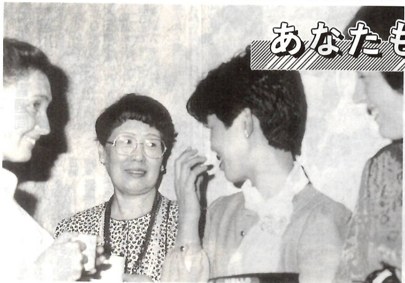
少しでも多く前橋のすばらしさを外国人に伝えたい

日時・内容 5月24日(火)：国際交流のすすめ、6月13日(月)：前橋の歴史と文化(萩原靖太郎、