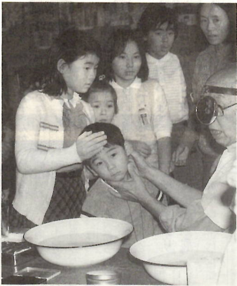
6年生のおねえさんもお手伝いして

必ず受けて 結核レントゲン 結核事情は、急速に改善されてきました。しかし、年々患者や死亡者が増えていてまだまだ最大の伝染病です。 最近、結核の集団発生が各地でみられます。現在、支所・出張所管内を対象に、結核レントゲン検診を実施しています。該当者は必ず受診してください。お問い合わせは予防課(内線3263)へ。 高齢者精神衛生相談 11月4日(内)午後1時30分~3時30分、保健所。予約を保健所(内線37721)へ。無料。