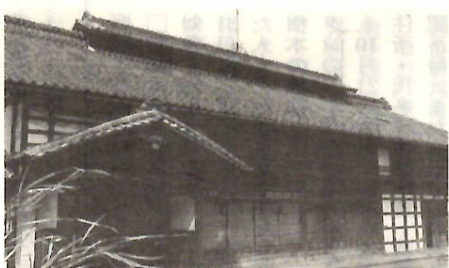
倉淵村から総社町総社に移築

にあり、石高は三百七十五石あり、ここに居を構え、在野にあつて人材を育成しようとした。