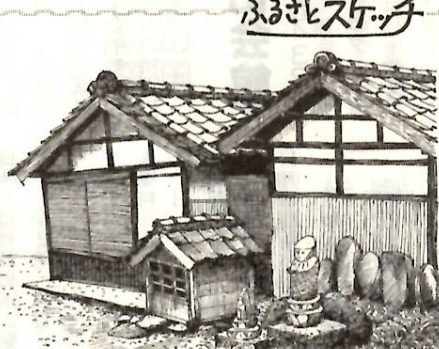
徳丸町の不動尊 井野 利定 45 (徳丸町)

受講生は三十人。町の公民館を会場に午後七時から九時まで、コースター(コップ敷き)作りにチャレンジしています。仕事を終えてから参加でき、会場も近いので最高「おしゃべりしながらの作業が楽しい」と先