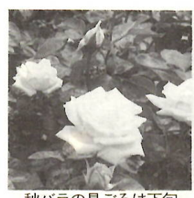
秋バラの見ごろは下旬