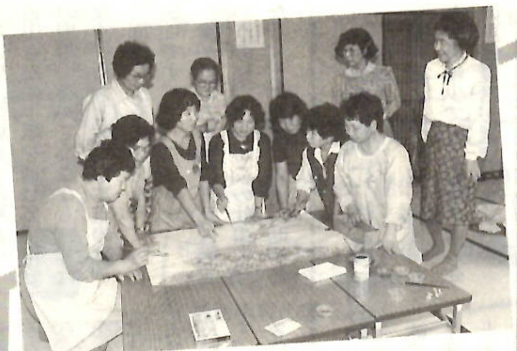
前橋民話の会 炉端

市では二十歳を迎えた青年が、成人として、社会の中で、たくましく生き抜こうとする抱負を、「20歳の主張」として募集します。奮って応募ください。なお、優秀作品を選び、成人祝式典(来年一月十五日)で表彰します。 対象 昭和43年4月2日～44年