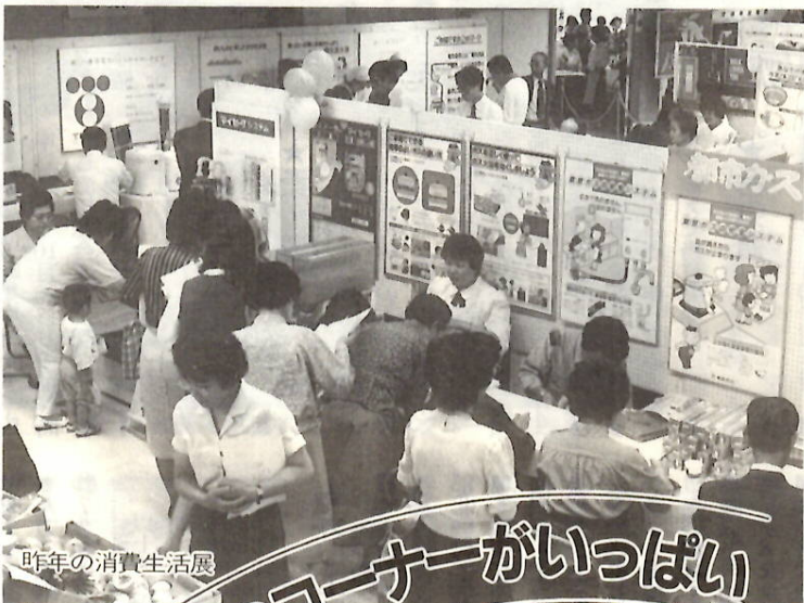
昨年の消費生活展

12回目を迎える今年の消費生活展は、「いのち、自然、くらしを考えよう」をテーマに、高齢化への対応、ゴミと資源、悪徳商法にご注意—という内容を中心として、生活に密着した課題を取り上げました。消費者を取り巻くいろいろな問題について、一人一人が、またみんなで考えようとするものです。どうぞお出かけください。○：お問い合わせは生活課内線3239へ。