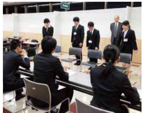
就職活動を成功させる第一歩に