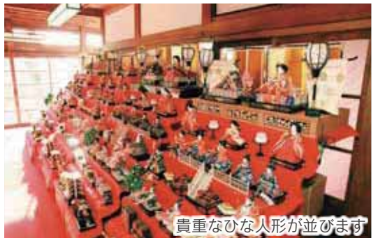
貴重なひな人形が並びます

桃の節句に合わせ、ひなまつりを開催。江戸時代末期から昭和初期までの雛人形や御殿飾雛などを展示します。 日時 = 2月8日(土)～4月6日(日)、午前9時～午後4時