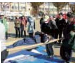
駒形町の防災訓練 (ハケツリレー)