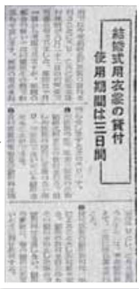
昭和 27 年 9 月 1 日掲載