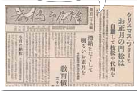
昭和 31 年 12 月 15 日掲載