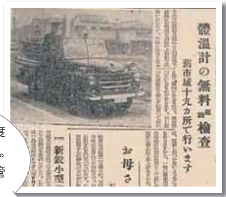
昭和 30 年 5 月 1 日掲載