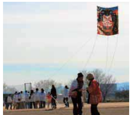
みんなで力を合わせて大空へ