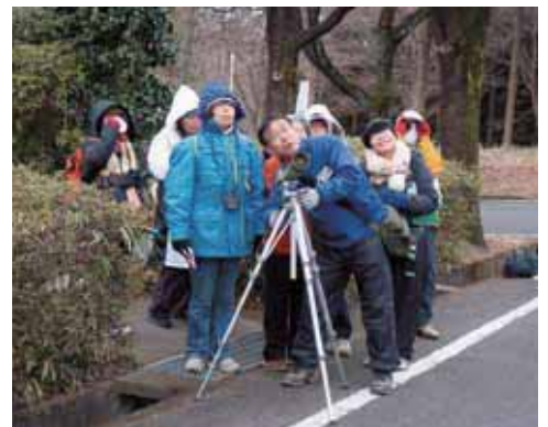
例年30種以上の野鳥に出会えます