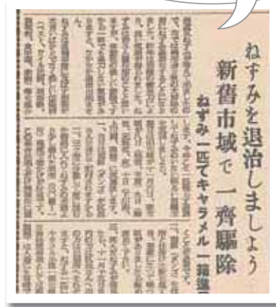
昭和 29 年 11 月 1 日掲載