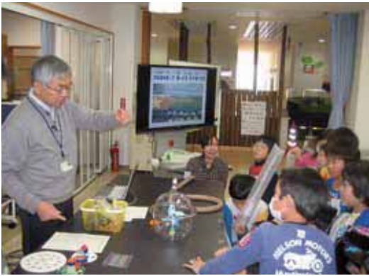
科学の不思議を楽しく学ぼう

で(各1人1通)。教室名・住 所・氏名(ふりがな)・性別・ 保護者名・学校名・学年・電話 番号・①は希望日を記入し、〒 371-0013 西片貝町五丁 目8・児童文化センターへ