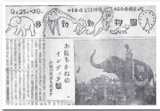
昭和 25 年 9 月 1 日掲載