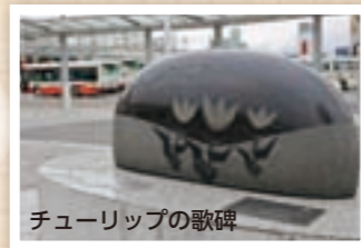
チューリップの歌碑

3月のJRのダイヤ改正に伴い、夜の通勤時間帯に、両毛線が増発され、高崎駅での東京方面からの乗継時間が短縮されました。