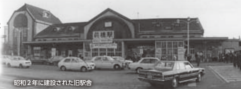
昭和2年に建設された旧駅舎