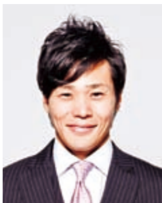
11月1日 清水宏保さん