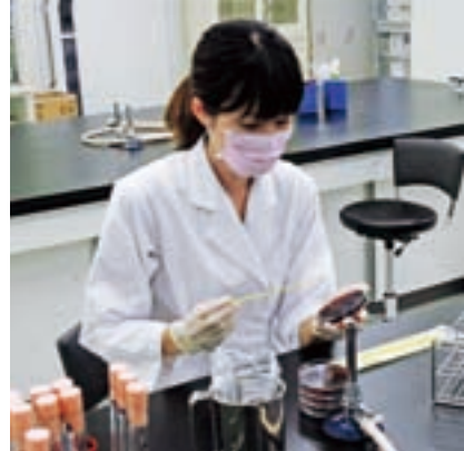
食品の安全性に関する検査を行う職員

市職員の給与状況や定員管理について、透明性を高め広く皆さんに知っていただくため、そのあらましをお知らせします。(数字は平成26年4月1日現在)