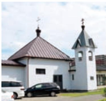
精糸原社跡地付近にある前橋ハリストス正教会(千代田町一丁目)

新島襄、内村鑑三の二大クリスチャンを輩出した群馬は明治以来、地方としては、まれなキリスト教県と称されました。そして前橋はキリスト教諸教派による群馬伝道の中心拠点であり、その普及は製糸業と密接に関わっていました。明治3年、前橋藩小参事・