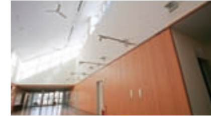
住民交流・作品展示スペース