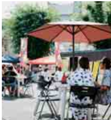
開放的な気分を楽しんで

前橋の玄関口である前橋駅北口広場で造形コンテストを開催。優秀作品は表彰します。 期日=9月12日(土)~19日(土) 対象=個人・団体、7区画(選考) 規格=4㎡(縦2m×横2m、高さは原則2m以下) テーマ=「楯取素彦」や「文と素彦」、「至誠」などを連想させ、花と緑を使って前橋らしさをPRできる物 申込書の配布=市役所公園緑地課、各市民サービスセンターで。本市ホームページからダウンロードもできます ☑8月20日(木)までに郵送で。申込書に記入し、市役所公園緑地課(☎027-898-6845)へ