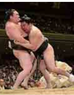
迫力ある取り組みを観戦

ニクルーズなどを楽しみます。 日時=9月18日(金)午前7時35分 集合場所=上毛電鉄中央前橋駅(城東町三丁目) 対象=一般、先着40人 費用=18歳以上1万3,480円(60歳以上は500円割引) ☑8月7日(金)午前9時から上毛電鉄☎027-231-3597へ