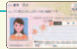
個人番号カード(表面)