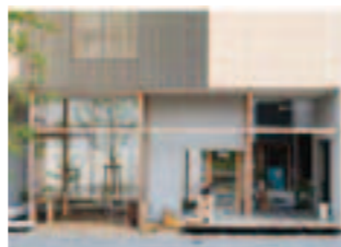
Eureka 《Dragon Court Village》2013年