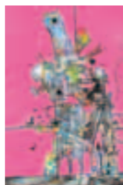
生物建築舎 《キメラ》2015年

群馬は車でちょっと行けば森や温泉といった豊かな自然があり、同時に大都市である東京にも近い。中途半端な場所かもしれませんが、都市と自然の両方が身近なよさもあります。今回の企画展を、若い世代が、群馬で、前橋で開催することを考えると、今までにない展覧会になると思います。