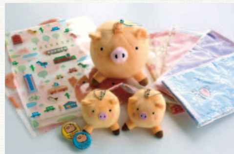
グッズもたくさんあるころ!