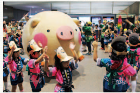
みんなで踊ると楽しいころ〜♪