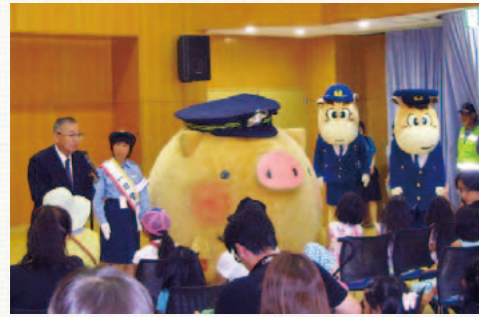
まちの安全を守るころ!